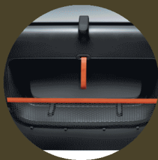
FILETS DE PORTE