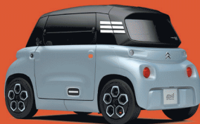
MY AMI BLUE