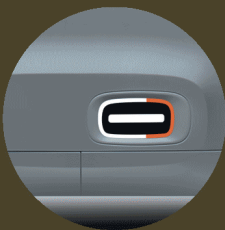
STICKERS DE PORTE