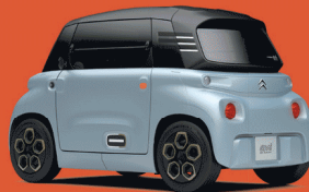
MY AMI KHAKI