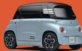
MY AMI GREY