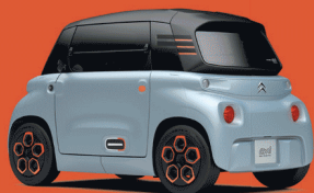
MY AMI ORANGE