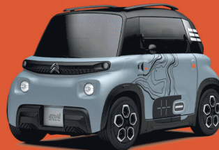
MY AMI VIBE