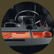
BACS DE RANGEMENT