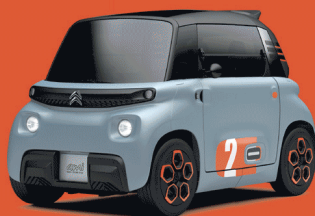
MY AMI POP