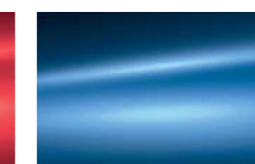
Bleu Electra (M)