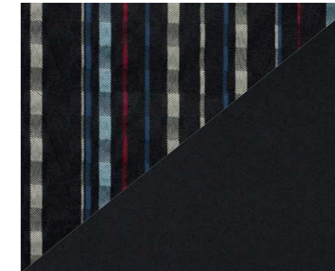
Tissu Orsai Multicolor / Tyot Mistral (2)