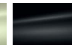
Noir Caldera (M)