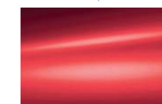
Rouge Scarlet (O)