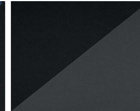
Tissu Nokimat Mistral et Bise (2)