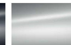
Gris Gallium (M)