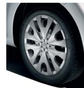
Enjoliveur Notus 14"