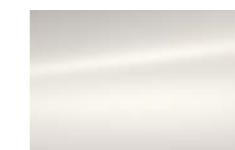
Blanc Lipizan (O)