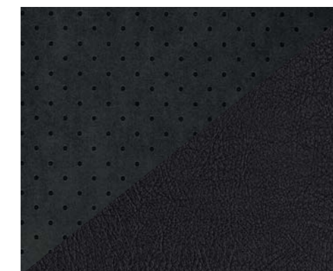
Alcantara® perforé / Cuir Claudia Mistral (2) (3)