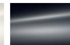
Gris Carlinite (M)