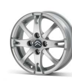
Jante City 14" (1)