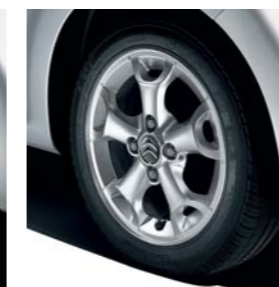
Jante Rift 14"