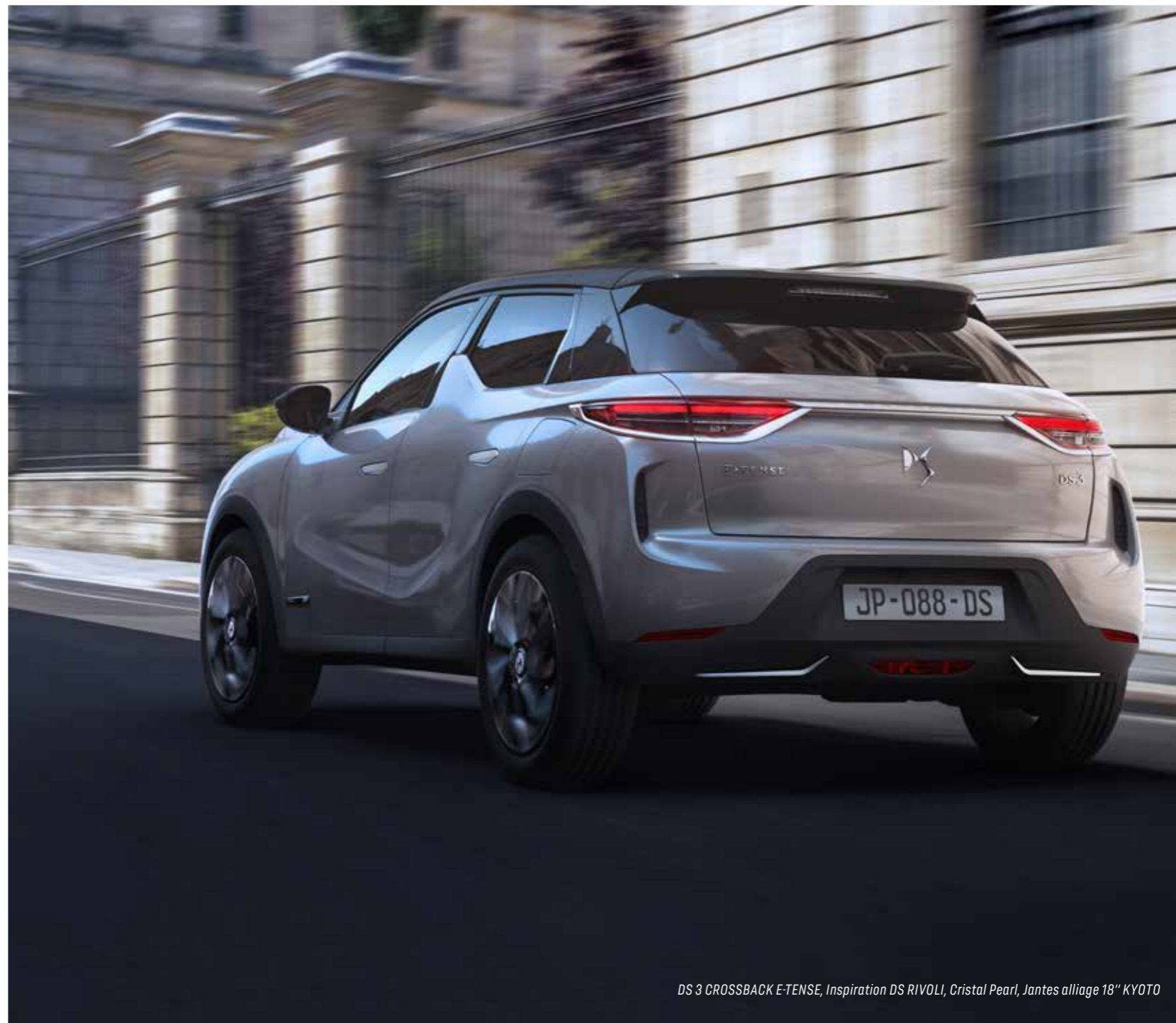
DS 3 CROSSBACK E-TENSE, Inspiration DS RIVOLI, Cristal Pearl, Jantes alliage 18" KYOTO