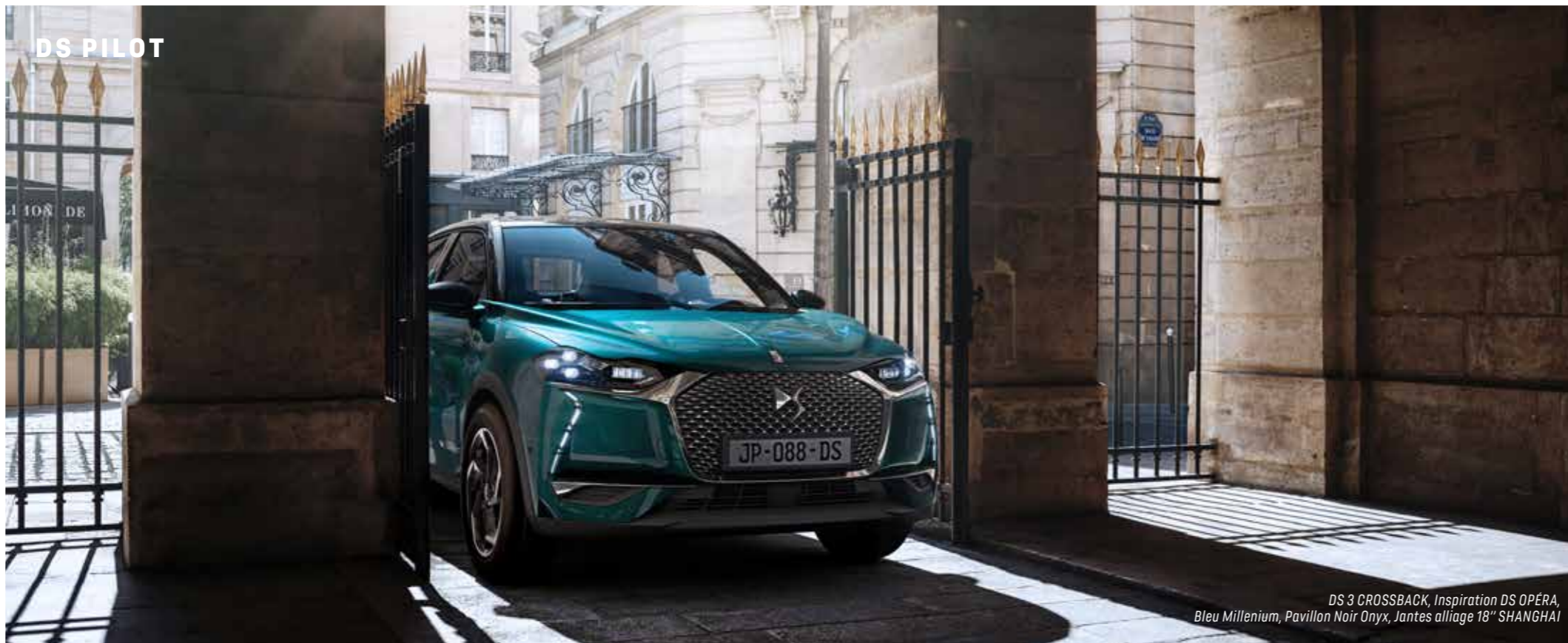
DS 3 CROSSBACK, Inspiration DS OPÉRA, Bleu Millenium, Pavillon Noir Onyx, Jantes alliage 18" SHANGHAI