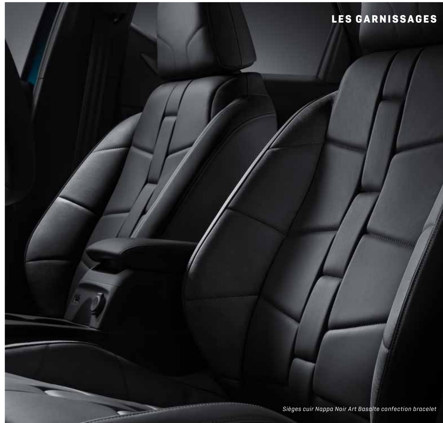
Sièges cuir Nappa Noir Art Basalte confection bracelet