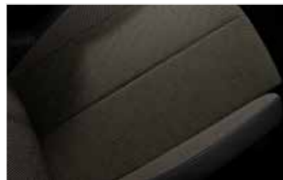
Tissu Perruzi Bronze (Inspiration DS BASTILLE)