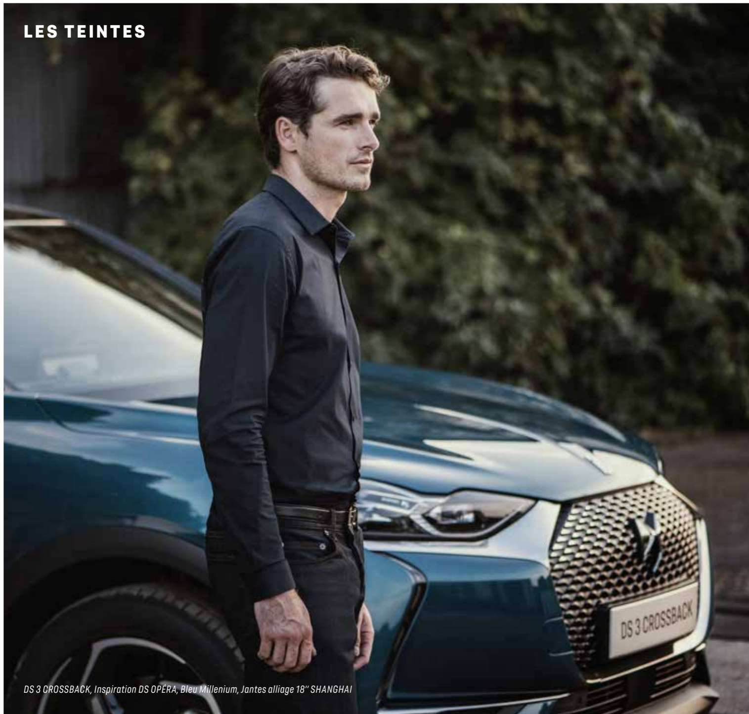
DS 3 CROSSBACK, Inspiration DS OPÉRA, Bleu Millenium, Jantes alliage 18" SHANGHAI