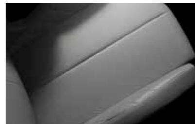
Tissu Luxembourg avec Cuir Nappa Gris Galet (Inspiration DS RIVOLI)