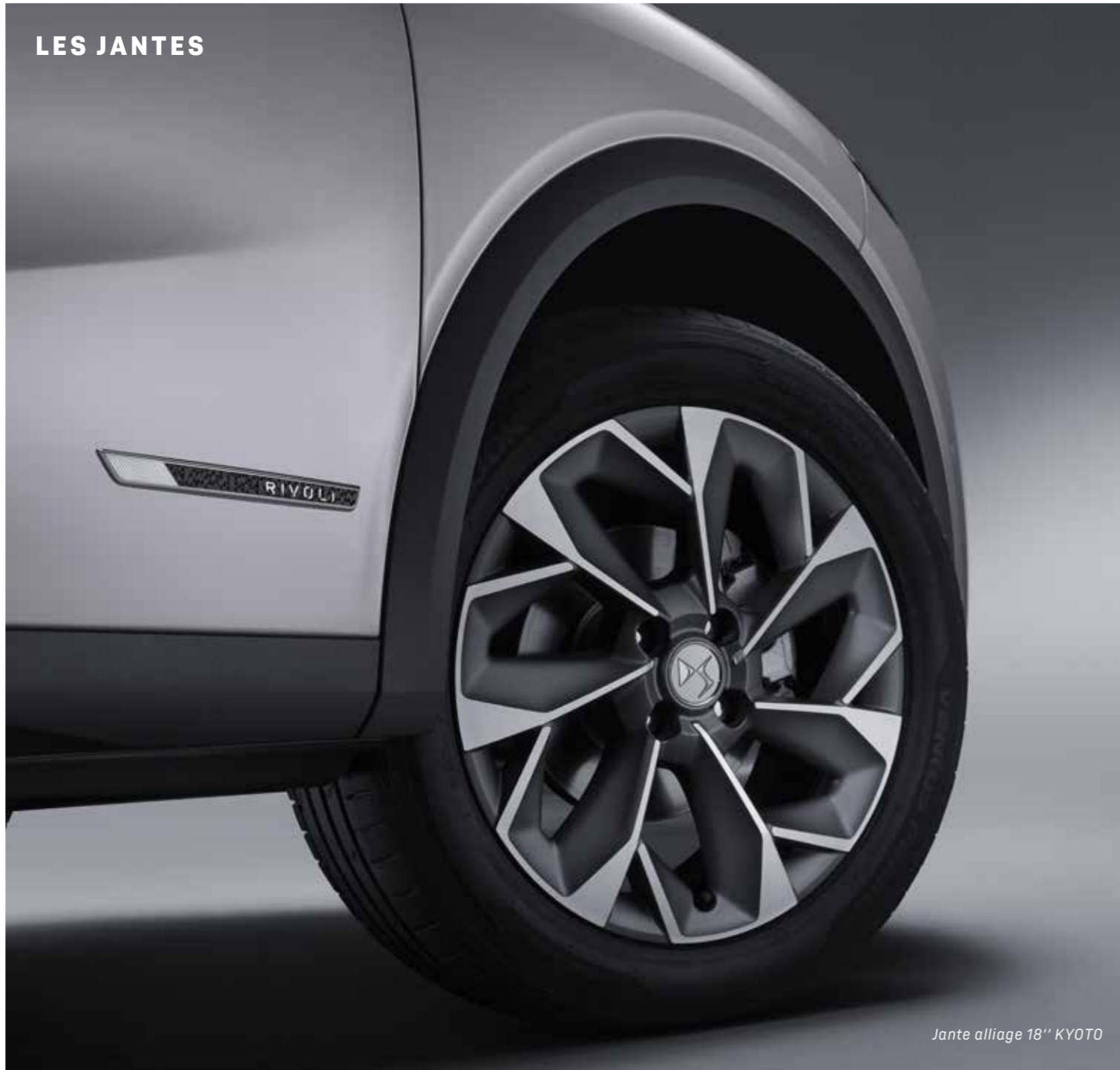
Jante alliage 18" KYOTO