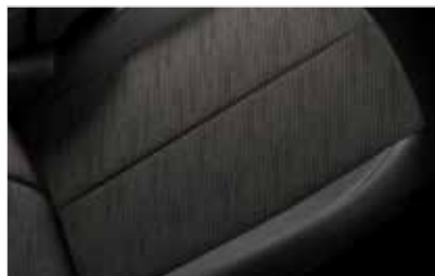
Tissu Météorite Bronze (Inspiration DS MONTMARTRE)