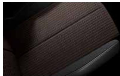
Tissu Tressé Basalte avec Alcantara® (Inspiration DS PERFORMANCE Line)