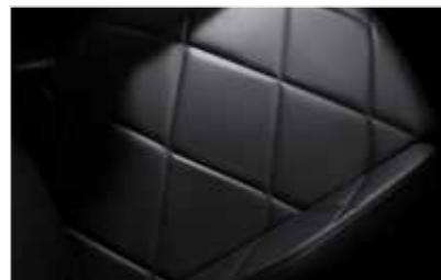
Cuir grainé Noir Basalte (Inspiration DS BASTILLE)