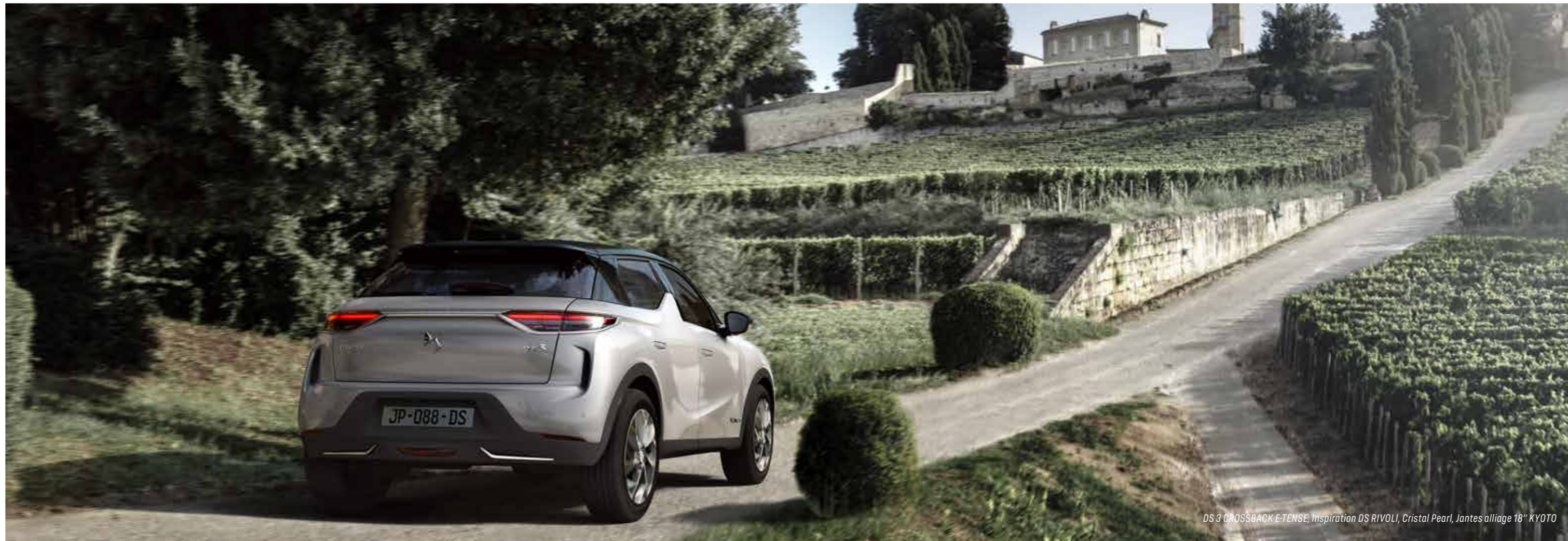
DS 3 CROSSBACK E-TENSE, Inspiration DS RIVOLI, Cristal Pearl, Jantes alliage 18" KYOTO