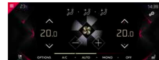
AMBIANCE PERFORMANCE Line

Faisant écho au style identitaire de DS Automobiles, les commandes sensibles et les deux aérateurs centraux prennent la forme de diamants.