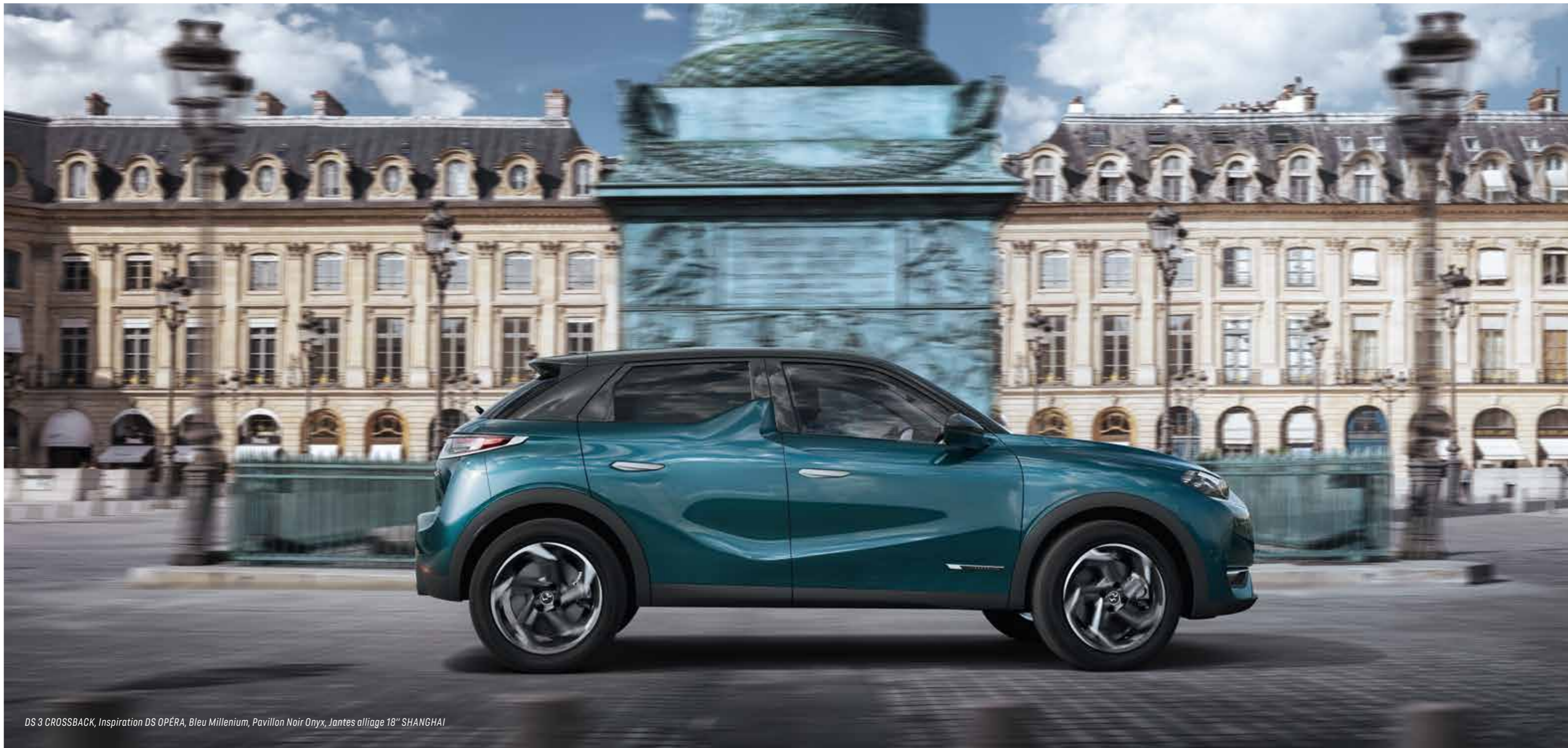
DS 3 CROSSBACK, Inspiration DS OPÉRA, Bleu Millenium, Pavillon Noir Onyx, Jantes alliage 18" SHANGHAI