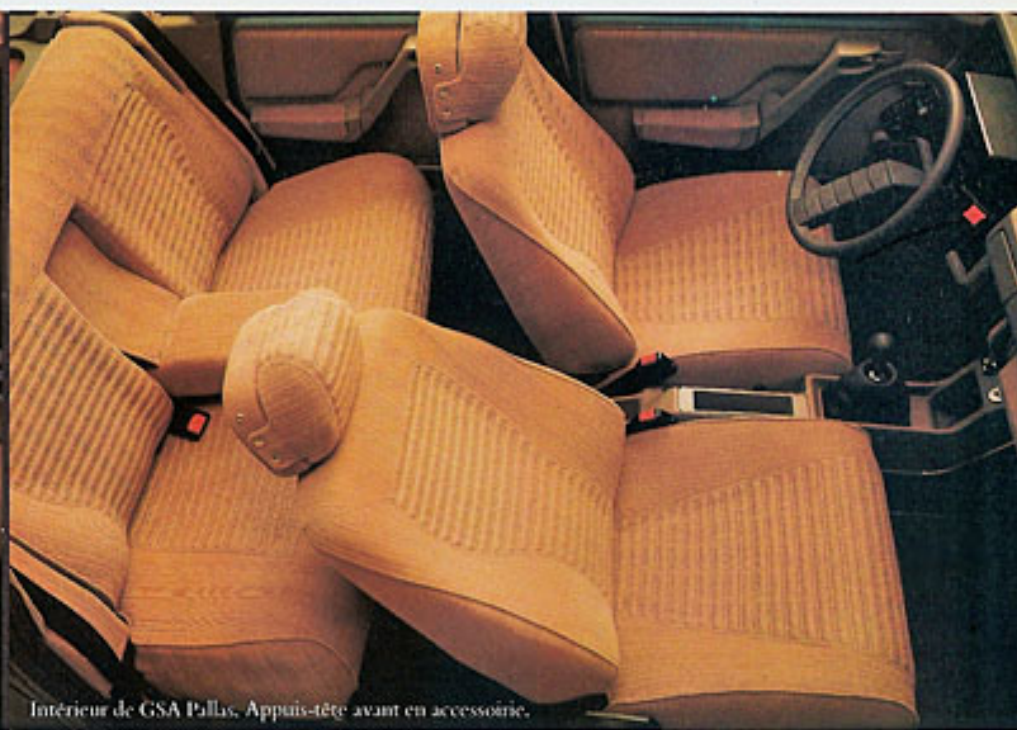
Intérieur de GSA Pallas. Appuis-tête avant en accessoire.