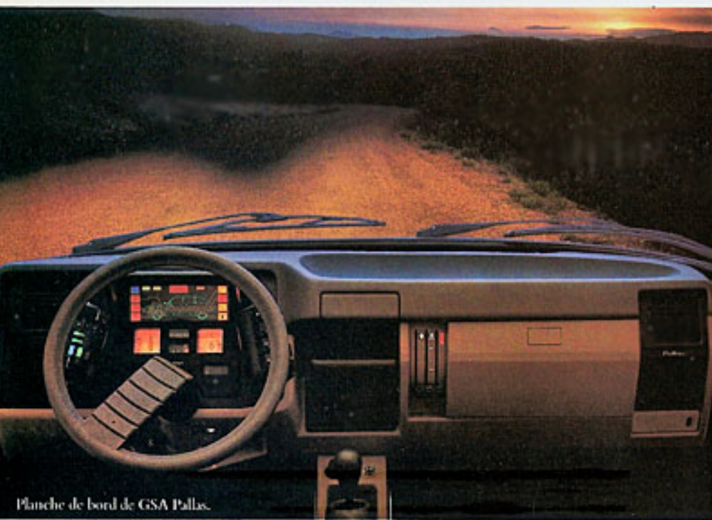
Planche de bord de GSA Pallas.