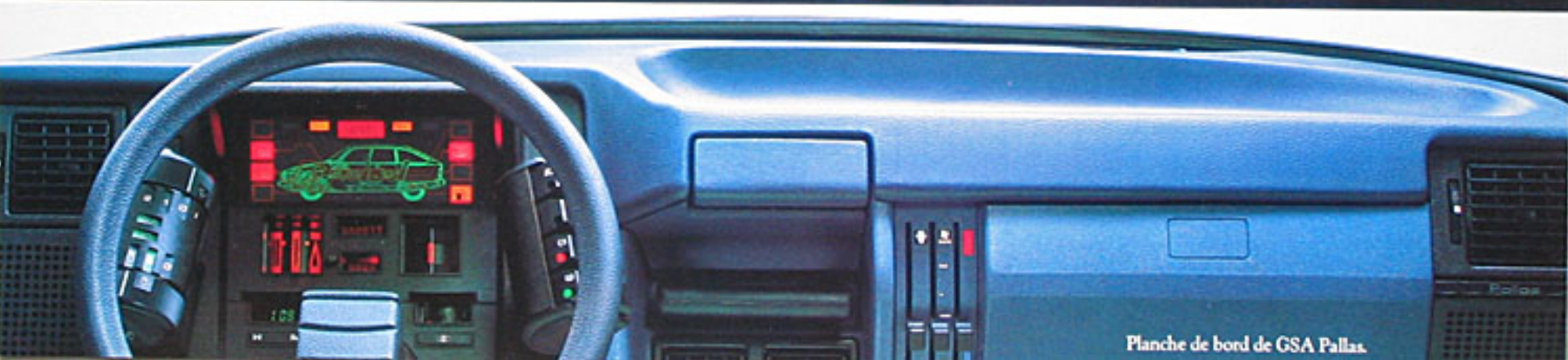
Planche de bord de GSA Pallas.