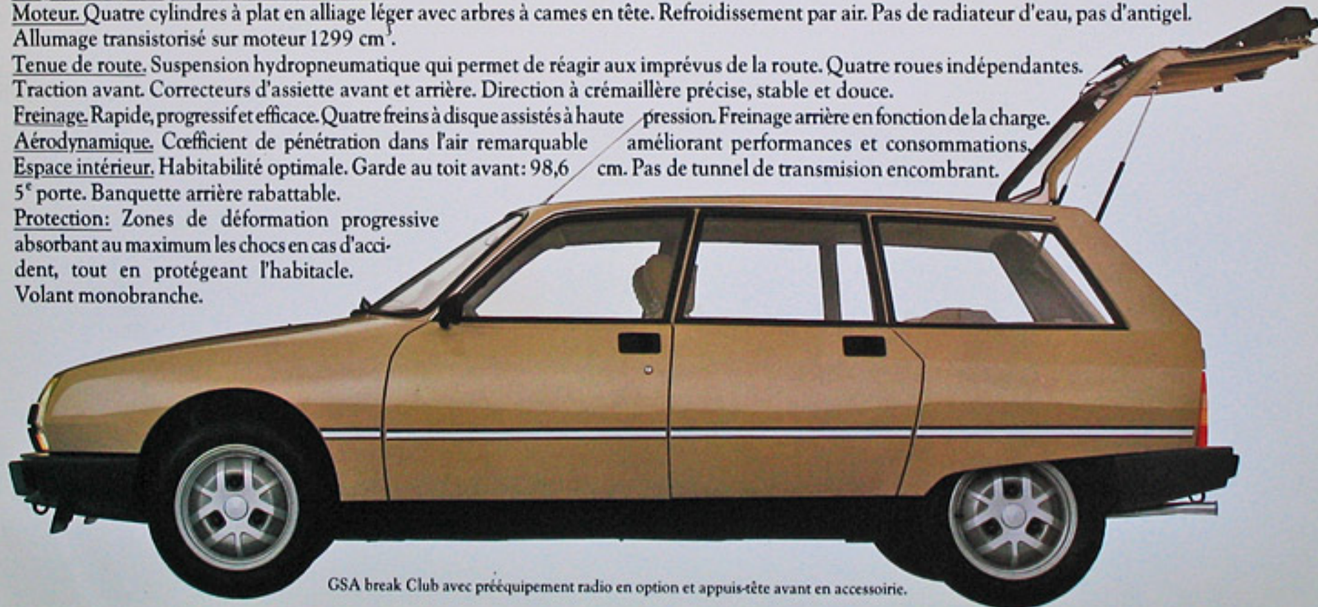
GSA break Club avec prééquipement radio en option et appuis-tête avant en accessoire.