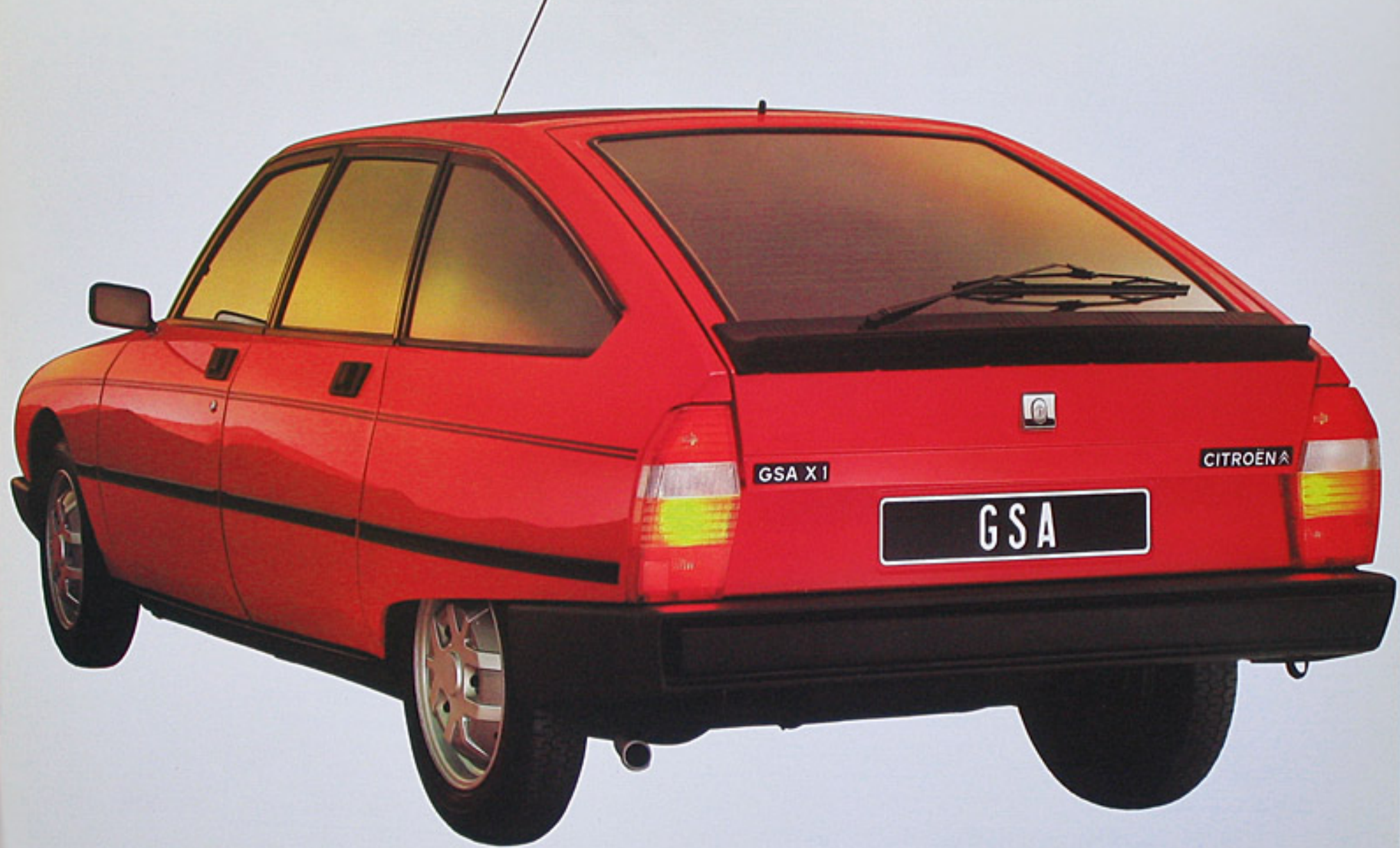
Modèle présenté ci-dessus: GSA X1 avec essuie/lave-glace de lunette arrière en option.