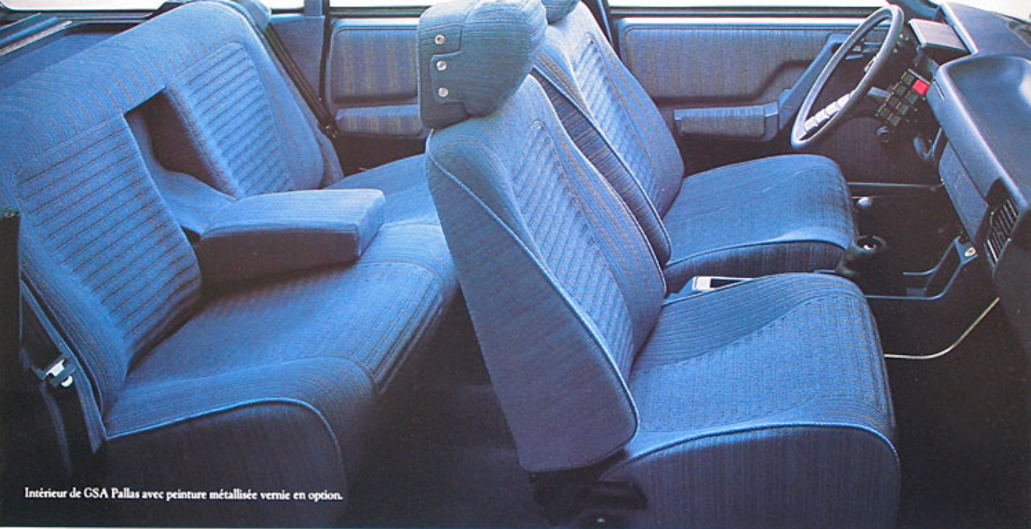
Intérieur de GSA Pallas avec peinture métallisée vernie en option.