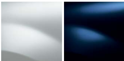
BLANCO GLACIAR (369)