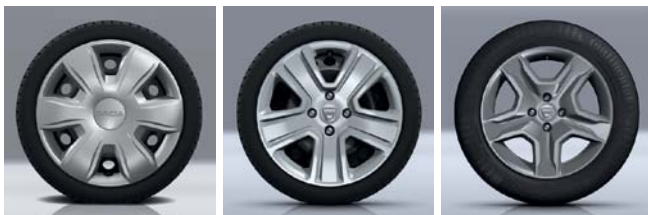
EMBELLECEDOR 38 CM (15") TISA