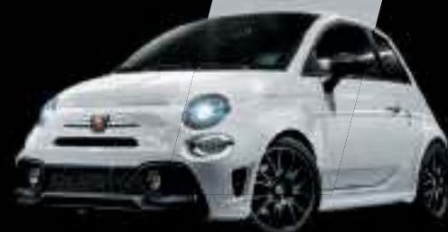
Blanc Gara (existe aussi avec toit noir sur finition Esseesse uniquement)