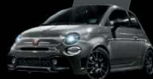
Gris Record (existe aussi avec toit noir sur finition Esseesse uniquement)