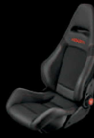
Sabelt® Racing à coque en fibre de carbone (De série sur 595 Esseesse)