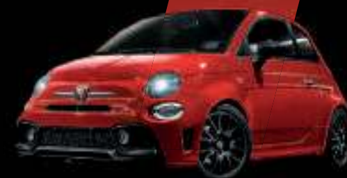
Rouge Abarth (existe aussi avec toit noir sur finition Esseesse uniquement)