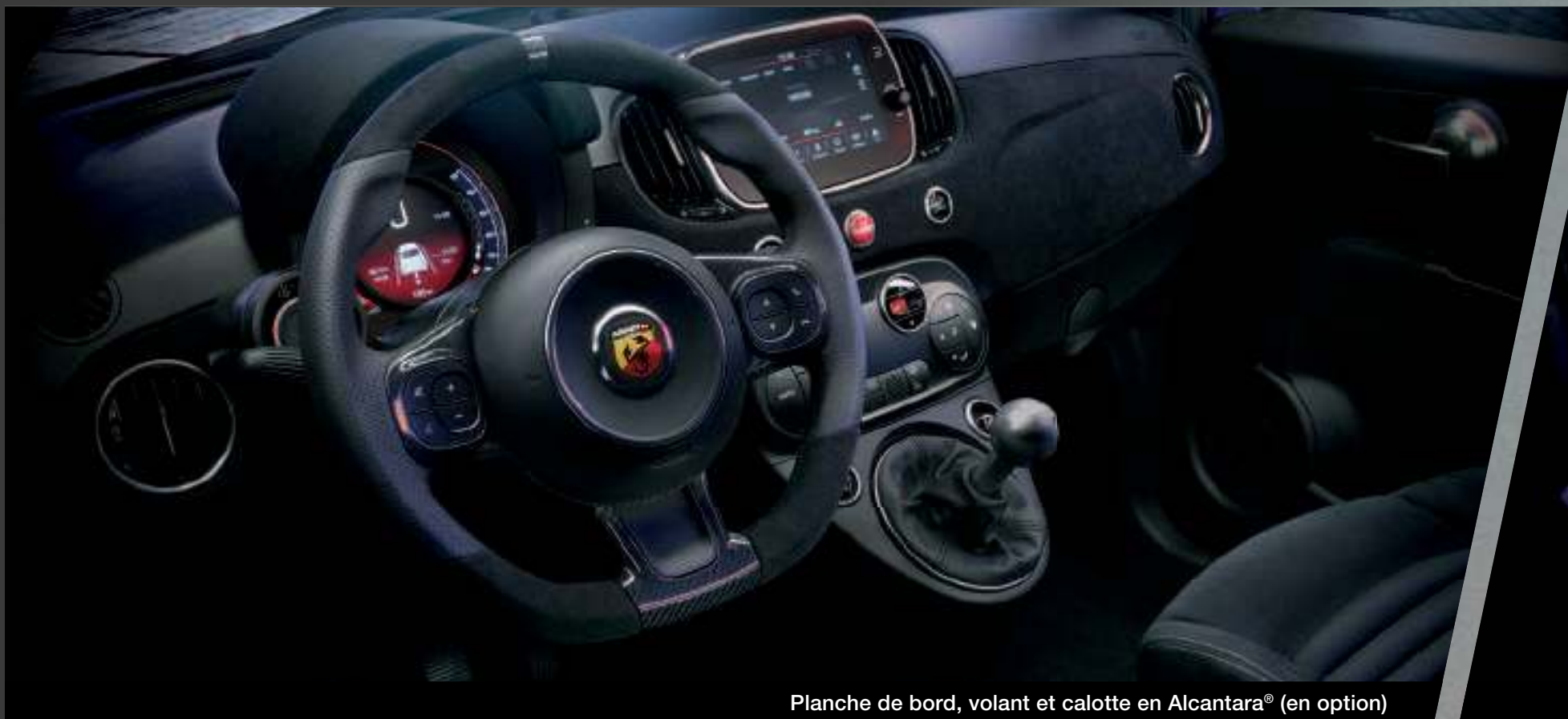
Planche de bord, volant et calotte en Alcantara® (en option)