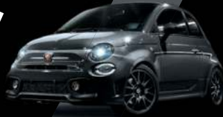
Gris Pista (existe aussi avec toit noir sur finition Esseesse uniquement)