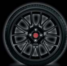
17" FORMULA NOIR MAT