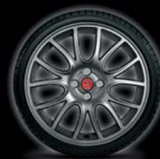
17" FORMULA TITANE