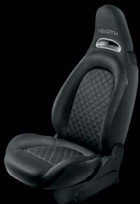
Tissu Abarth noir (De série sur 595)