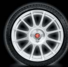
17" SUPERSPORT BLANC