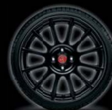
17" SUPERSPORT NOIR MAT