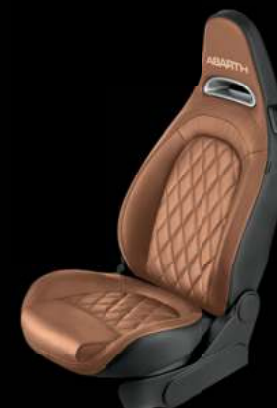
Cuir Abarth marron clair (De série sur 595 Turismo, en option sur 595 et 595 Competizione)