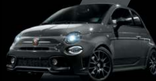
Gris Record (existe aussi avec toit noir sur finition Esseesse uniquement)