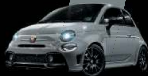
Gris Campovolo (existe aussi avec toit noir sur finition Esseesse uniquement)