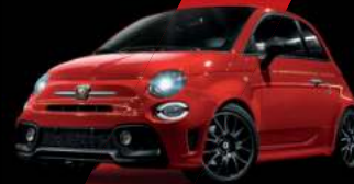
Rouge Abarth (existe aussi avec toit noir sur finition Esseesse uniquement)