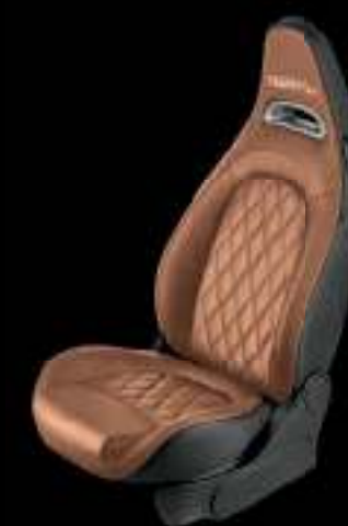
Cuir Abarth marron clair (De série sur 595 Turismo, en option sur 595 et 595 Competizione)