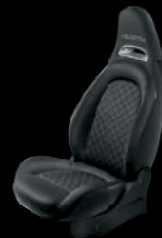
Tissu Abarth noir (De série sur 595)