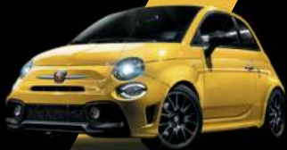
Jaune Modena (existe aussi avec toit noir sur finition Esseesse uniquement)