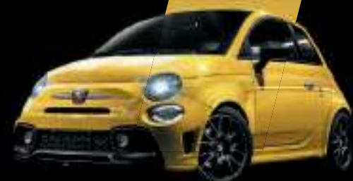
Jaune Modena (existe aussi avec toit noir sur finition Esseesse uniquement)