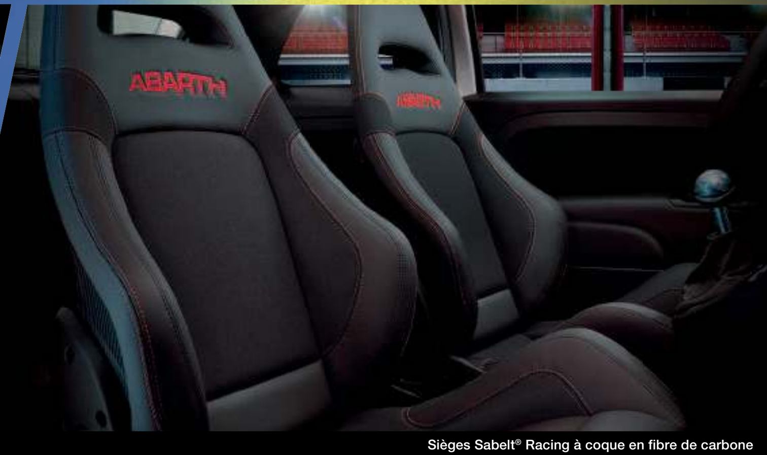
Sièges Sabelt® Racing à coque en fibre de carbone