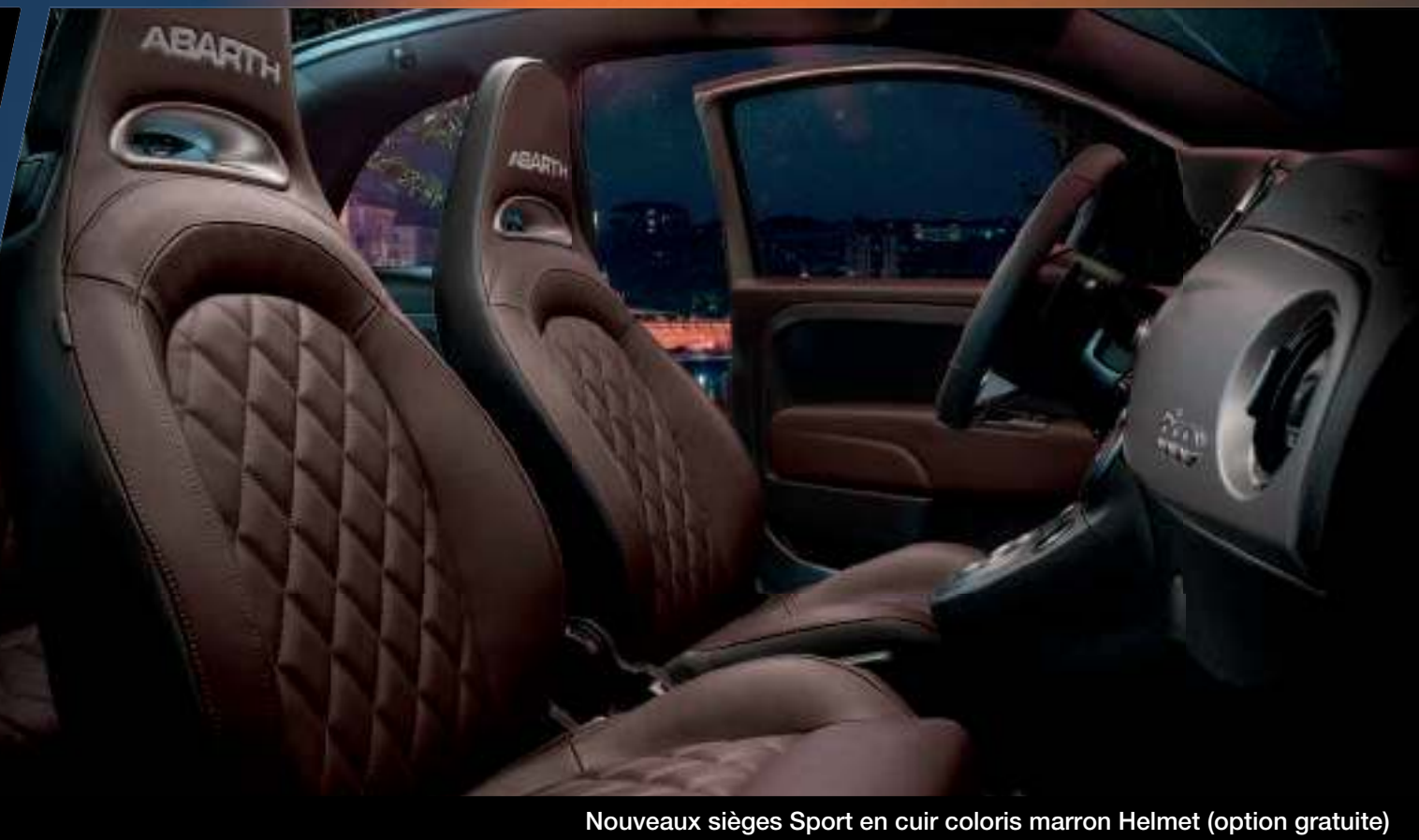
Nouveaux sièges Sport en cuir coloris marron Helmet (option gratuite)