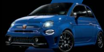
Bleu Podio (existe aussi avec toit noir sur finition Esseesse uniquement)