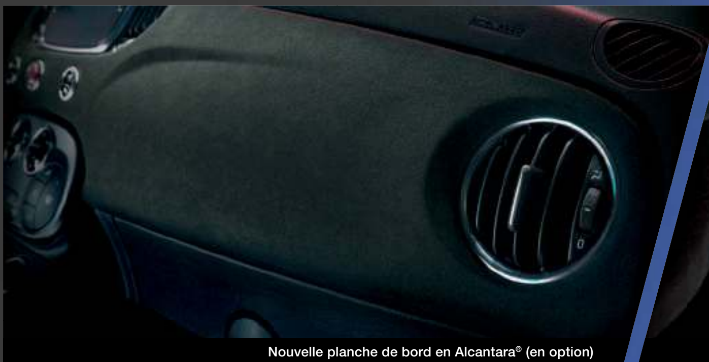
Nouvelle planche de bord en Alcantara® (en option)