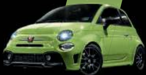
Vert Adrenaline (existe aussi avec toit noir sur finition Esseesse uniquement)