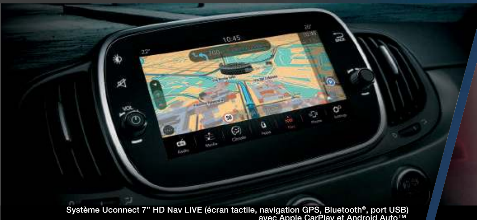
Système Uconnect 7" HD Nav LIVE (écran tactile, navigation GPS, Bluetooth®, port USB) avec Apple CarPlay et Android Auto™