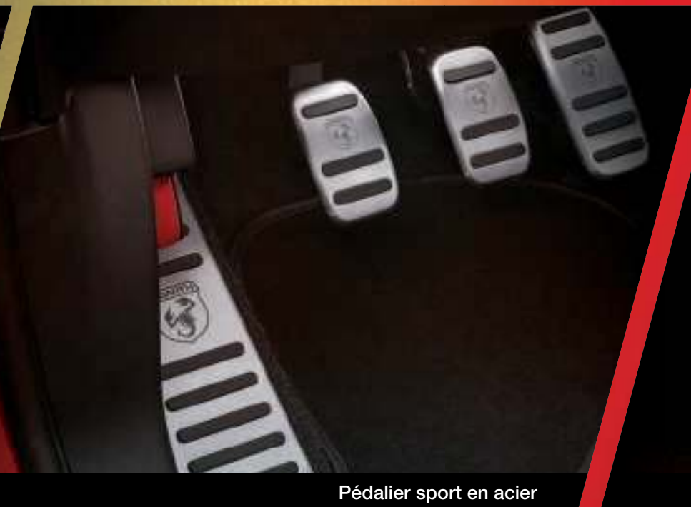
Pédalier sport en acier