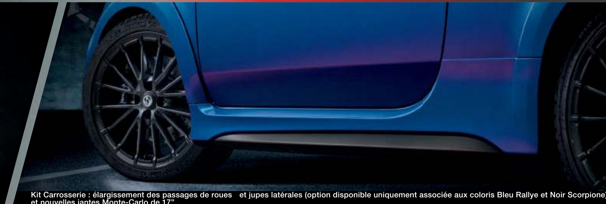
Kit Carrosserie : élargissement des passages de roues et jupes latérales (option disponible uniquement associée aux coloris Bleu Rallye et Noir Scorpione) et nouvelles jantes Monte-Carlo de 17"