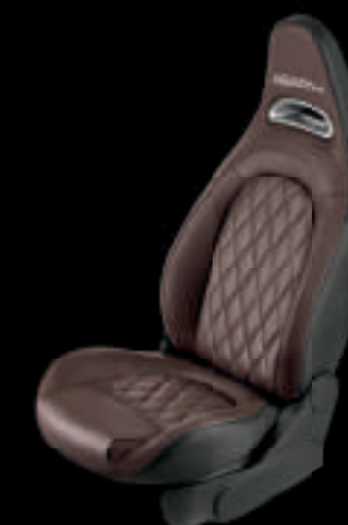
Cuir Abarth marron Helmet (De série sur 595 Turismo, en option sur 595 et 595 Competizione)