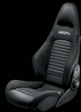
Sabelt® GT cuir noir (En option sur 595 Competizione)