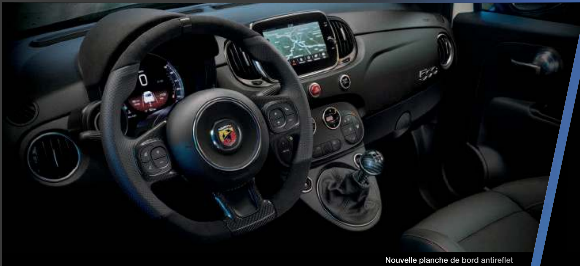
Nouvelle planche de bord antireflet