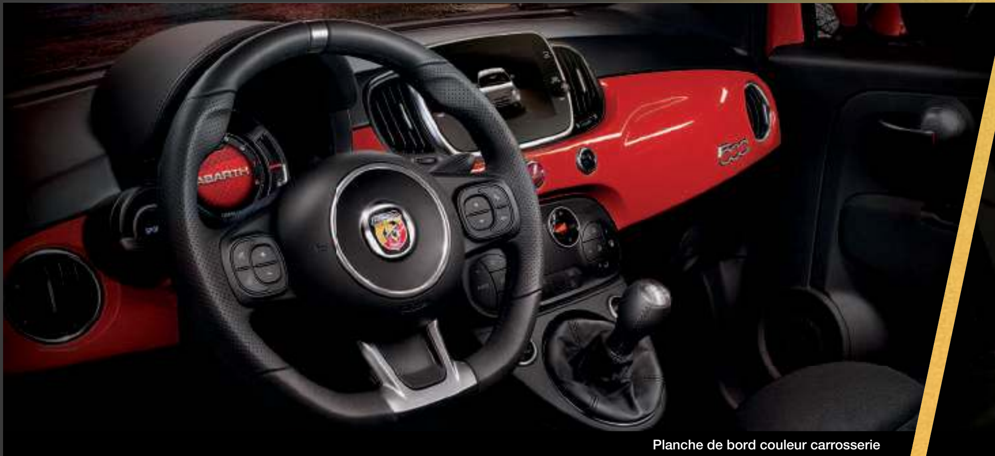
Planche de bord couleur carrosserie