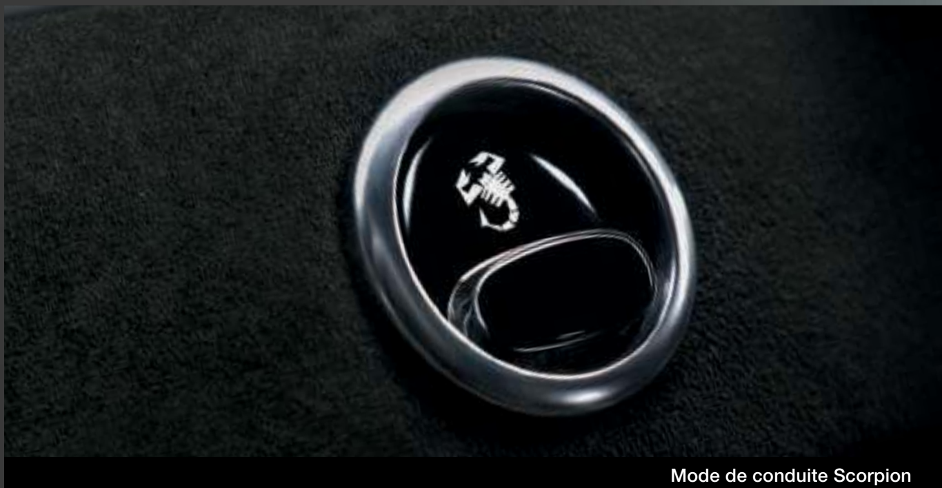
Mode de conduite Scorpion