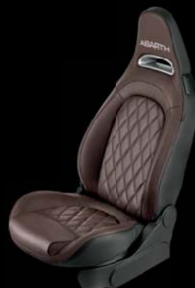
Cuir Abarth marron Helmet (De série sur 595 Turismo, en option sur 595 et 595 Competizione)