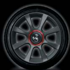
16" 8 BRANCHES

● : série. ○ : option. - : non disponible.