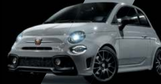
Gris Campovolo (existe aussi avec toit noir sur finition Esseesse uniquement)