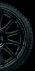
17" SUPERSPORT NOIR MAT