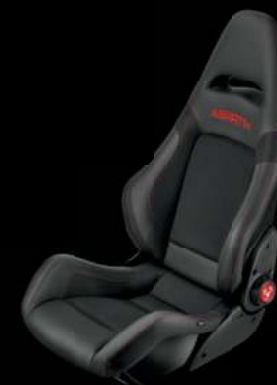
Sabelt® Racing à coque en fibre de carbone (De série sur 595 Esseesse en exclusivité)