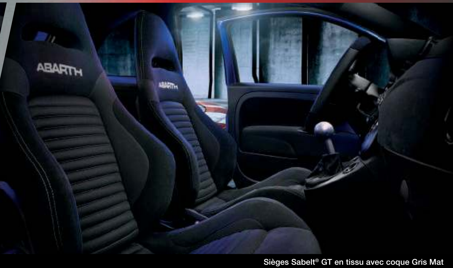
Sièges Sabelt® GT en tissu avec coque Gris Mat