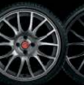
17" FORMULA TITANE