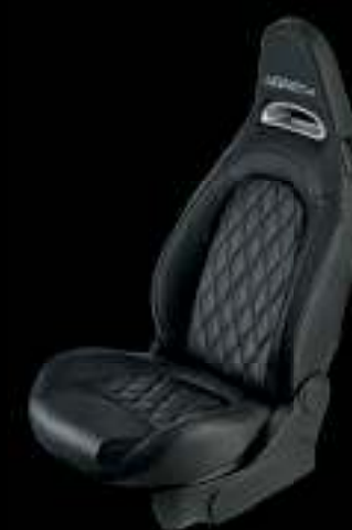
Cuir Abarth noir (De série sur 595 Turismo)