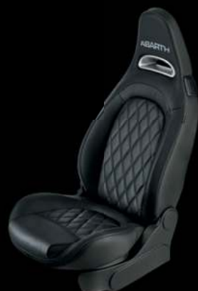
Cuir Abarth noir (De série sur 595 Turismo)