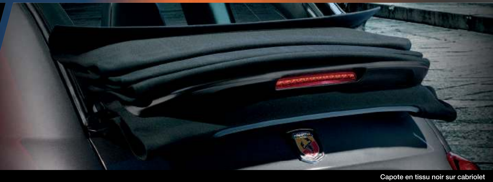
Capote en tissu noir sur cabriolet