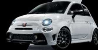
Blanc Gara (existe aussi avec toit noir sur finition Esseesse uniquement)