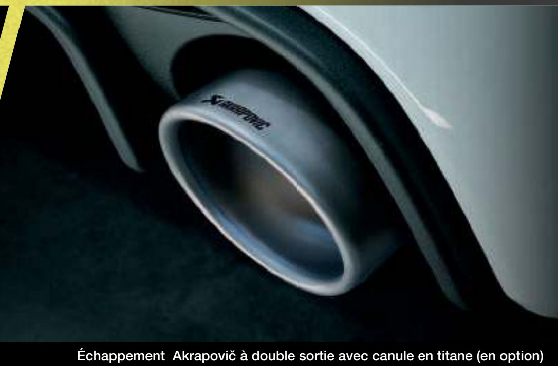
Échappement Akrapovič à double sortie avec canule en titane (en option)