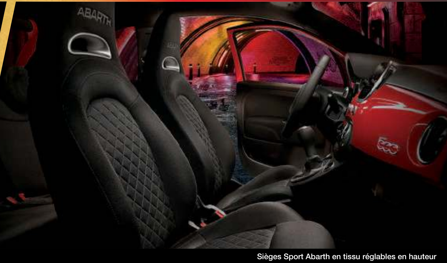
Sièges Sport Abarth en tissu réglables en hauteur