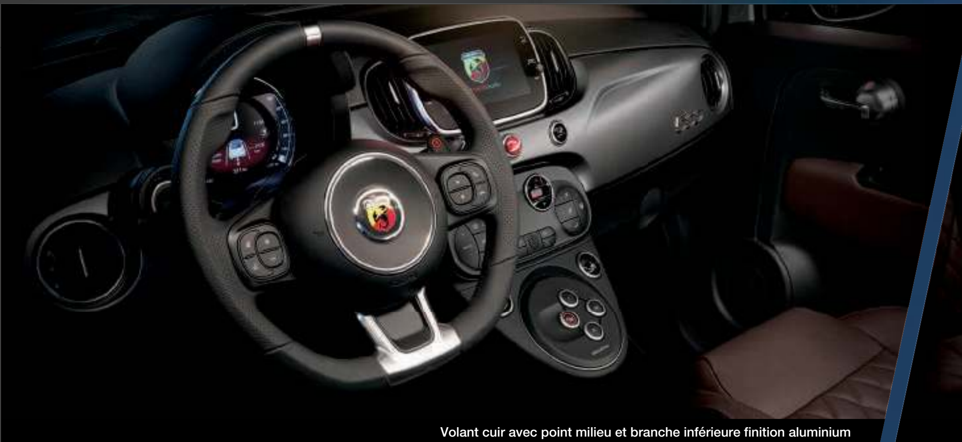
Volant cuir avec point milieu et branche inférieure finition aluminium