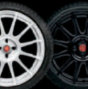
17" SUPERSPORT BLANC