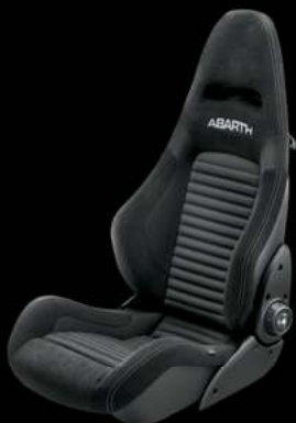
Sabelt® GT tissu noir (De série sur 595 Competizione)