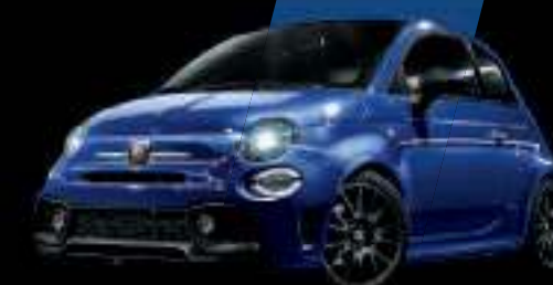
Bleu Podio (existe aussi avec toit noir sur finition Esseesse uniquement)