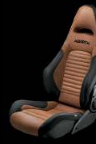
Sabelt® GT cuir marron (En option sur 595 Competizione)