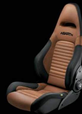
Sabelt® GT cuir marron (En option sur 595 Competizione)