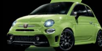
Vert Adrenaline (existe aussi avec toit noir sur finition Esseesse uniquement)