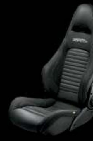
Sabelt® GT cuir noir (En option sur 595 Competizione)