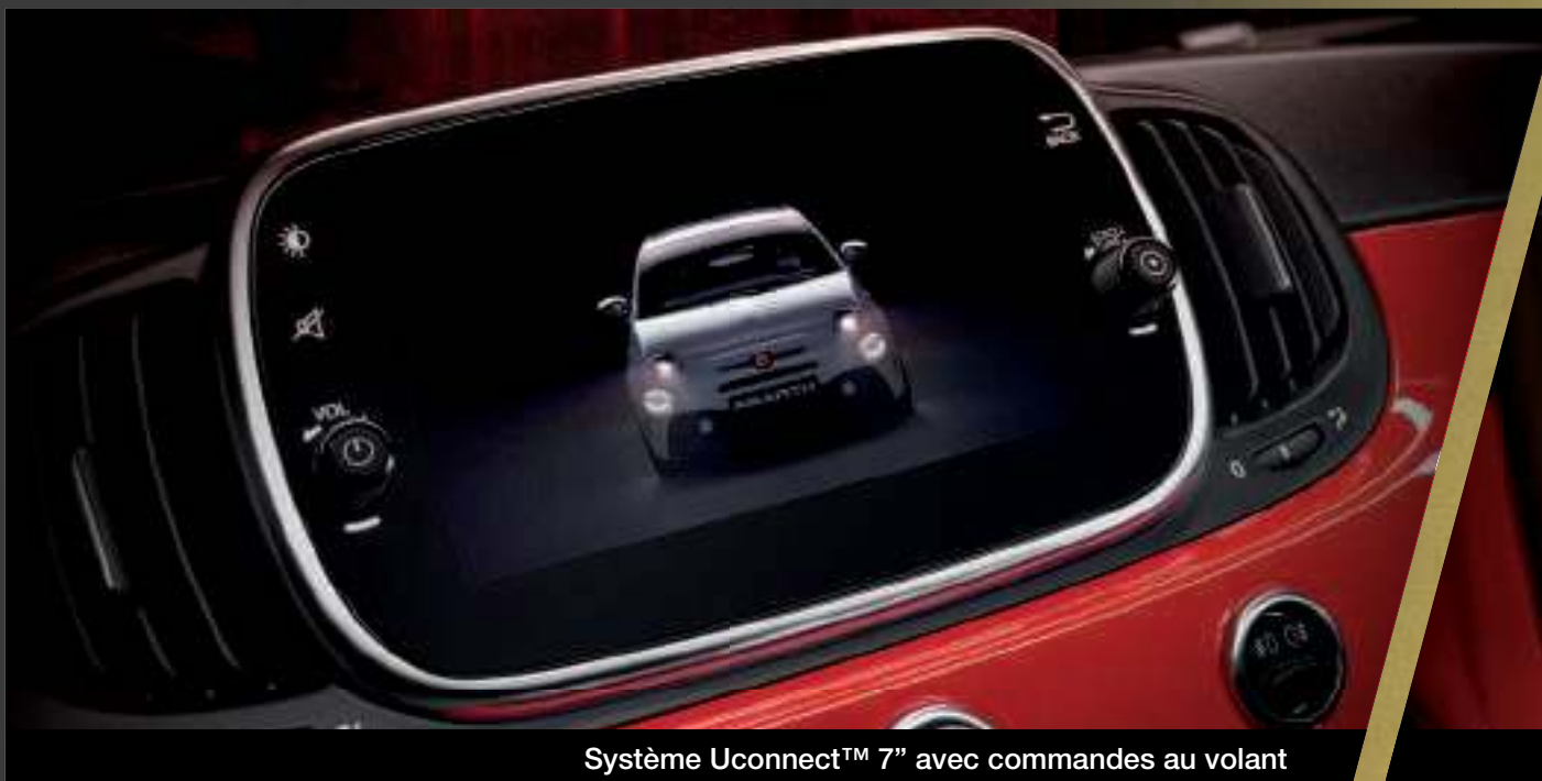
Système Uconnect™ 7" avec commandes au volant