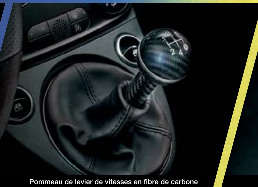
Pommeau de levier de vitesses en fibre de carbone