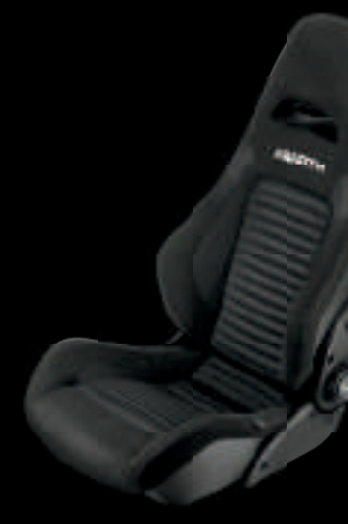
Sabelt® GT tissu noir (De série sur 595 Competizione)

Des sièges conçus pour garantir un maintien latéral optimal comme sur une voiture de course. Pour ne faire plus qu'un avec votre voiture et tirer le maximum de tous vos parcours sportifs.