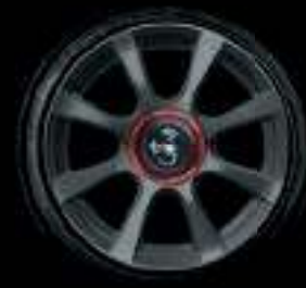
16" 8 BRANCHES