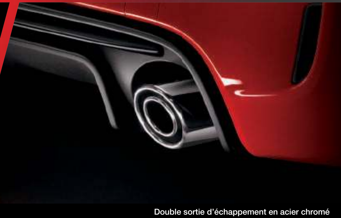
Double sortie d'échappement en acier chromé