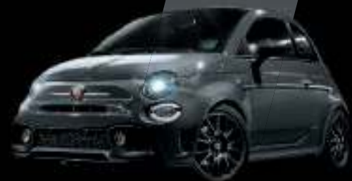
Gris Pista (existe aussi avec toit noir sur finition Esseesse uniquement)