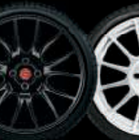
17" FORMULA NOIR MAT