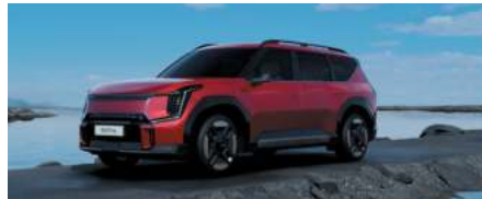
Rouge Volcan (de série)