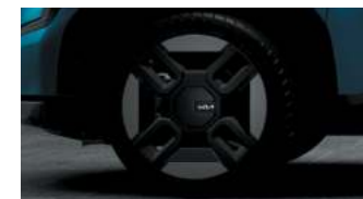
Jantes 21" avec inserts aérodynamiques (GT-line)