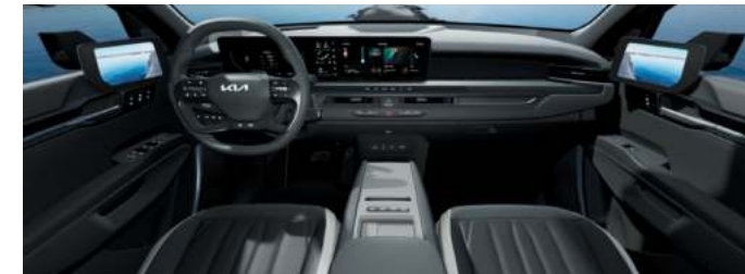
Environnement intérieur cuir végétal artificiel GT-line Noir Abysses / Gris Ecume