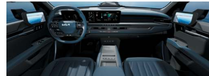
Environnement intérieur cuir végétal artificiel GT-line Bleu Maritime / Gris Ardoise