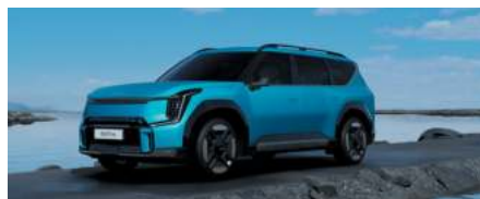
Bleu Océan Mat (exclusivité GT-line)