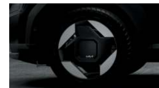
Jantes 19" avec inserts aérodynamiques (Earth)