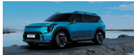
Bleu Océan (exclusivité GT-line)