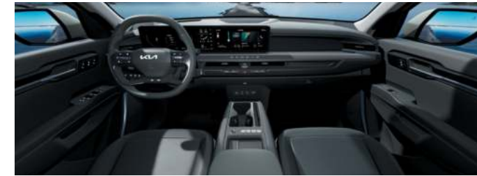
Environnement intérieur cuir végétal artificiel Noir Abysses / Gris Ardoise