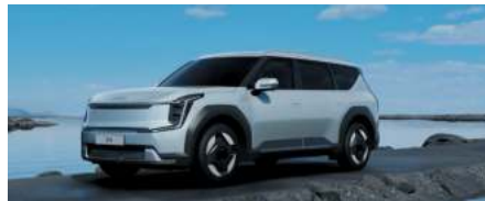
Gris Ivoire (exclusivité Earth)