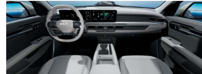
Environnement intérieur cuir végétal artificiel Gris Ardoise / Gris Ecume