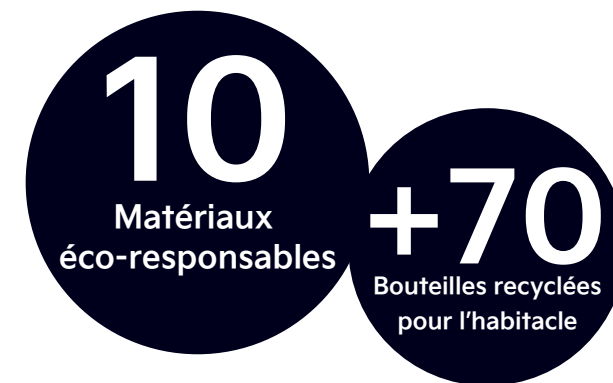
Tableau de bord PET recyclé

En configuration six places avec sièges rotatifs au second rang, EV9 se transforme en lieu de vie, favorisant les moments d'échange ou de partage.