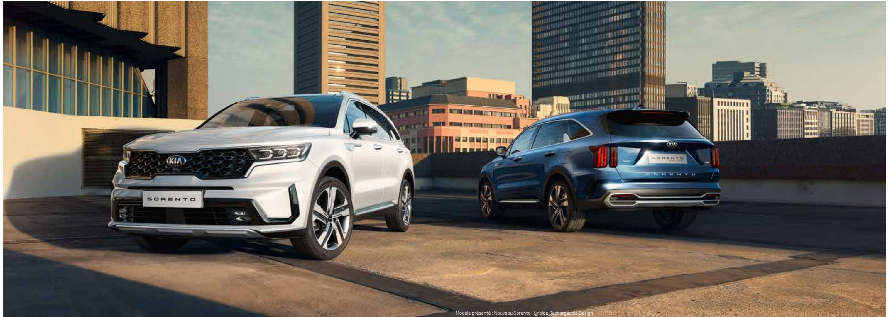
Modèle présenté : Nouveau Sorento Hybride Rechargeable Design

Si vous voulez vivre, comme bon vous semble, sans compromis, alors le nouveau Kia Sorento avec sa motorisation électrifiée est clairement fait pour vous. Vous souhaitez une conduite sans émission ? Le nouveau Kia Sorento Hybride Rechargeable saura répondre à vos attentes grâce à son mode 100 % électrique. Vous serez séduit par son design élancé et tout en puissance, conjugué à un habitacle aussi spacieux que confortable et luxueux. L'assurance de sillonner les rues des villes avec élégance sans vous soucier des regards réprobateurs. Vos règles – votre choix.