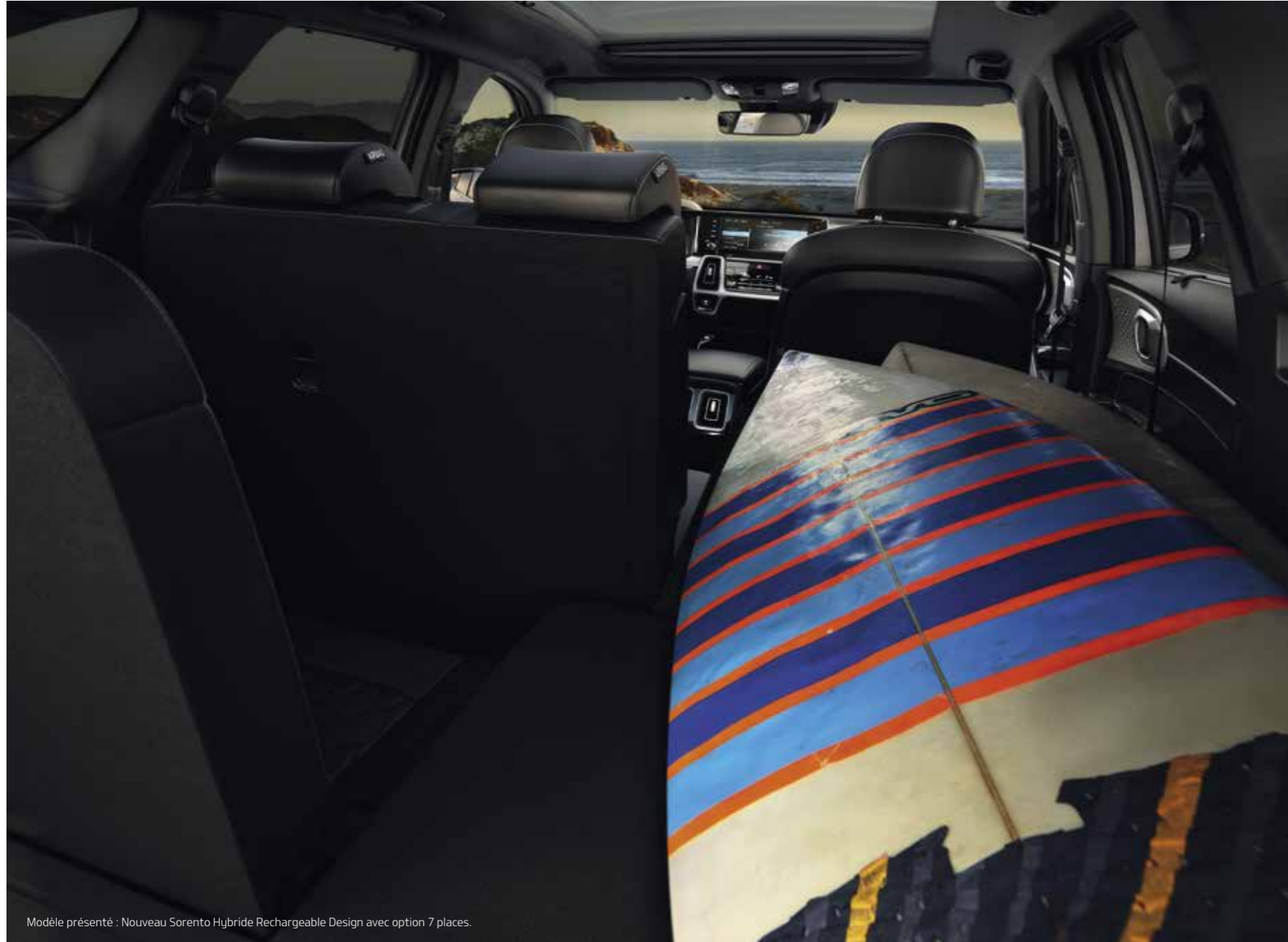
Modèle présenté : Nouveau Sorento Hybride Rechargeable Design avec option 7 places.