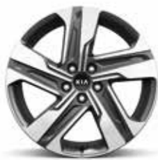
Jantes en alliage 19" (de série sur toute la gamme)