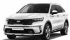
Blanc Céleste (UD)

Choisissez la couleur qui correspond à votre style. Le nouveau Sorento Hybride Rechargeable est disponible avec dix coloris extérieurs différents.