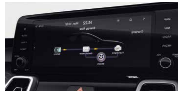
ÉCRAN DE NAVIGATION DE 10,25"

COMBINÉ D'INSTRUMENTATION 100% DIGITAL DE 12.3" De conception ingénieuse et personnalisable, le combiné d'instrumentation 100% digital de 12.3" fournit des informations sur la température, la pression de gonflage et d'autres paramètres clés du véhicule et du trajet. Il affiche également le statut du système de charge hybride, notamment les niveaux de carburant et de la batterie, ainsi que le mode sélectionné. Son écran haute résolution permet de lire toutes les informations pertinentes d'un simple coup d'œil.