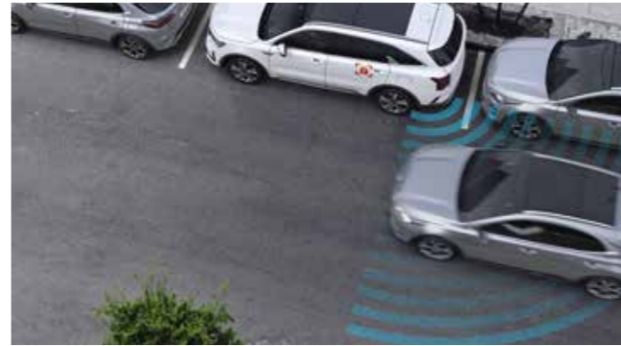
SYSTÈME DE SÉCURITÉ DE SORTIE DU VÉHICULE (SEA)

Conçu pour améliorer la visibilité dans les angles morts, le système BVM (de série sur la finition Premium) utilise des caméras latérales de manière à ce que, lorsque vous enclenchez le clignotant gauche ou droit, le combiné d'instruments affiche la vue de la route située dans l'angle mort. Actionnez le clignotant gauche et le système affichera la vue de la partie arrière gauche de votre véhicule ; actionnez le clignotant droit et le système affichera la vue de la partie arrière droite de votre véhicule.