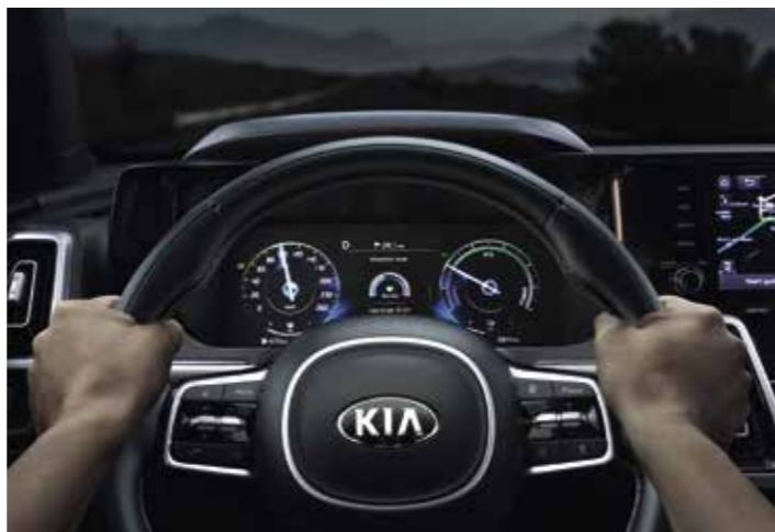
ALERTE DE VIGILANCE DU CONDUCTEUR (DAW)

Lorsque les conditions le permettent, le Kia Sorento allume automatiquement les feux de route. De nuit, lorsque la caméra intégrée au pare-brise détecte les projecteurs d'un autre véhicule approchant, le système de gestion automatique des feux de route permute automatiquement en feux de croisement pour éviter d'éblouir les autres conducteurs.