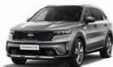
Gris Comète (KLG) (1)