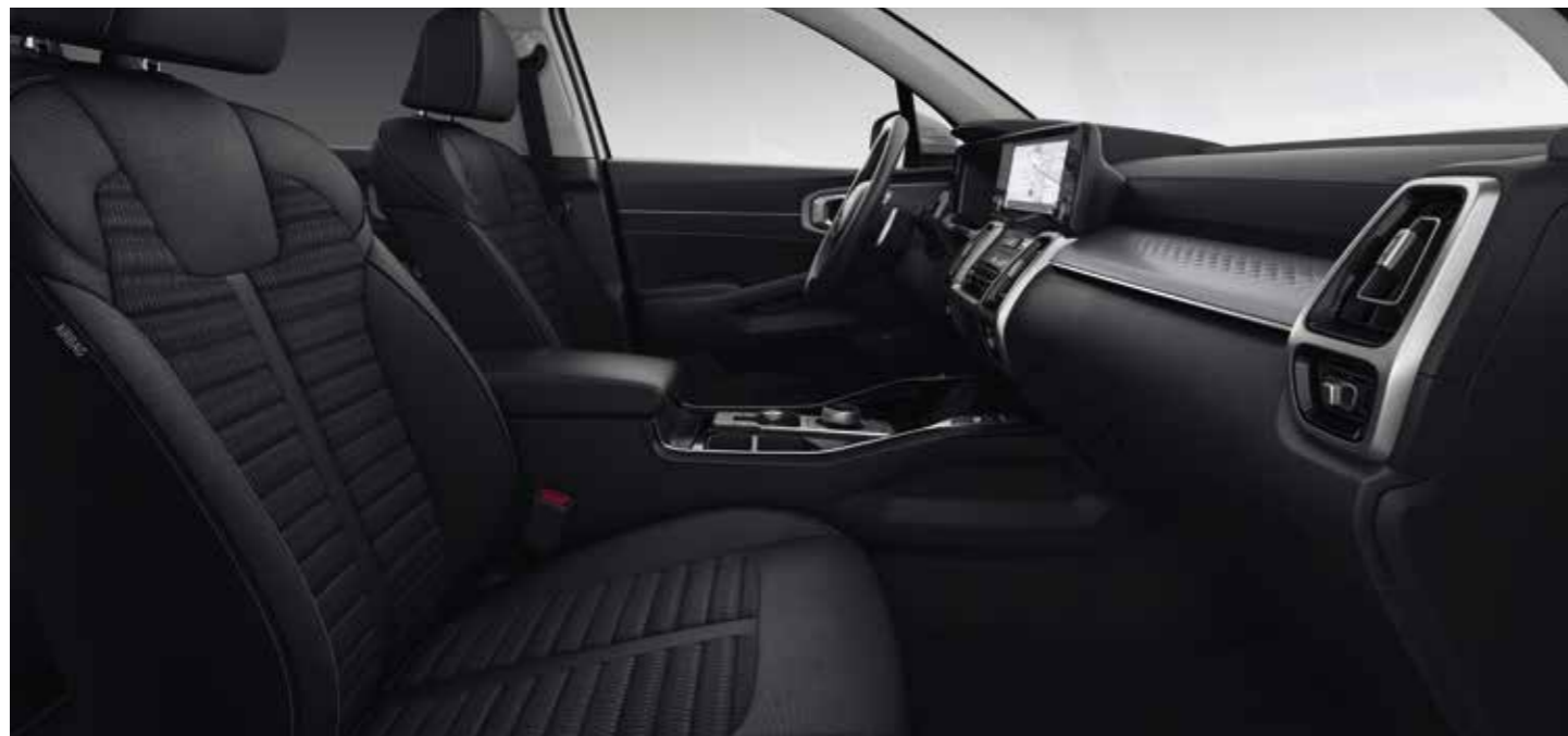
Sellerie tissu noir (de série sur les finitions Motion et Active)

Pour une touche d'élégance supplémentaire, la sellerie en tissu noir arbore un garnissage en finition métallisée avec gaufrage 3D, tandis que tous les sièges en cuir bénéficient d'un garnissage en finition broyée et d'un gaufrage 3D. La sellerie en cuir nappa noir est également complétée par un ciel de pavillon de couleur noire.