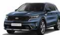
Bleu Minéral (M4B) (1)

(1) Couleur métallisée disponible en option