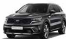
Gris Galène (ABT) (1)