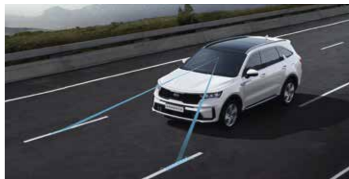
AIDE AU MAINTIEN DANS LA FILE (LKA)

À l'aide d'une caméra et d'un radar, le système SCC maintient la vitesse que vous avez sélectionnée, tout en conservant une distance de sécurité entre vous et le véhicule en amont. Il contrôle également l'accélération et la décélération afin de veiller à ce que votre véhicule s'arrête et redémarre en même temps que véhicule en amont. En outre, le système SCC utilise la navigation (de série à partir de la finition Active) et les données cartographiques ADAS pour réduire automatiquement votre vitesse dans les virages afin d'améliorer votre sécurité et de respecter la limitation de vitesse.