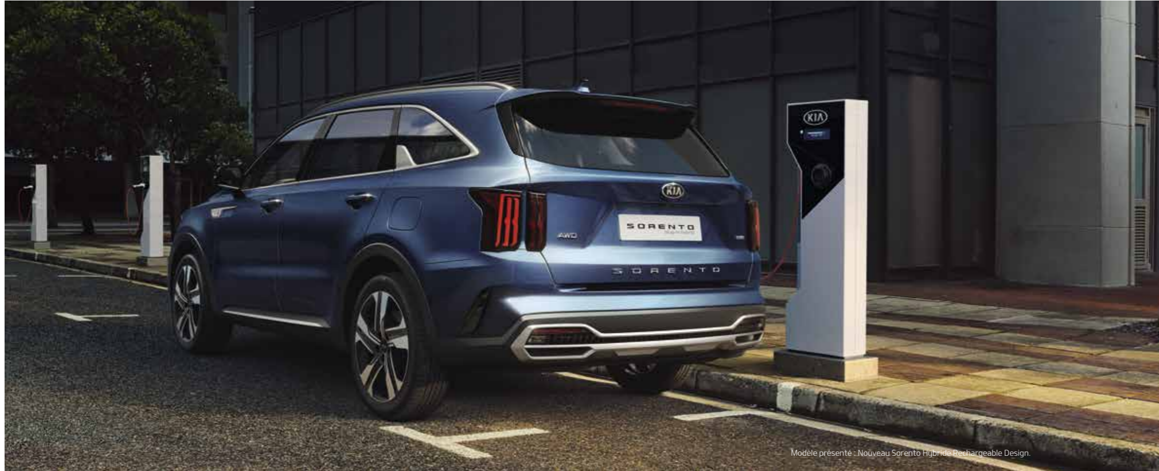
Modèle présenté : Nouveau Sorento Hybride Rechargeable Design.