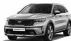
Gris Aluminium (4SS) (1)