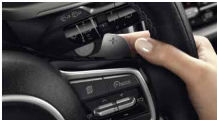
PALETTES DE VITESSES AU VOLANT

Laissez libre cours à vos envies : le nouveau Sorento Hybride Rechargeable est animé par un moteur essence électrifié T-GDi 1,6 litre associé à une transmission à quatre roues motrices.