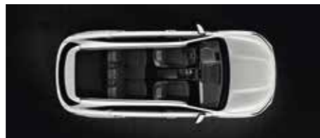
Sièges de la 3 ème rangée totalement repliés à plat