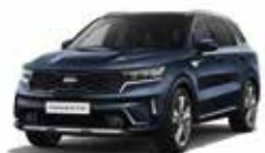
Bleu Saphir (B4U) (1)