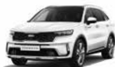
Blanc Nacré (SWP) (2)