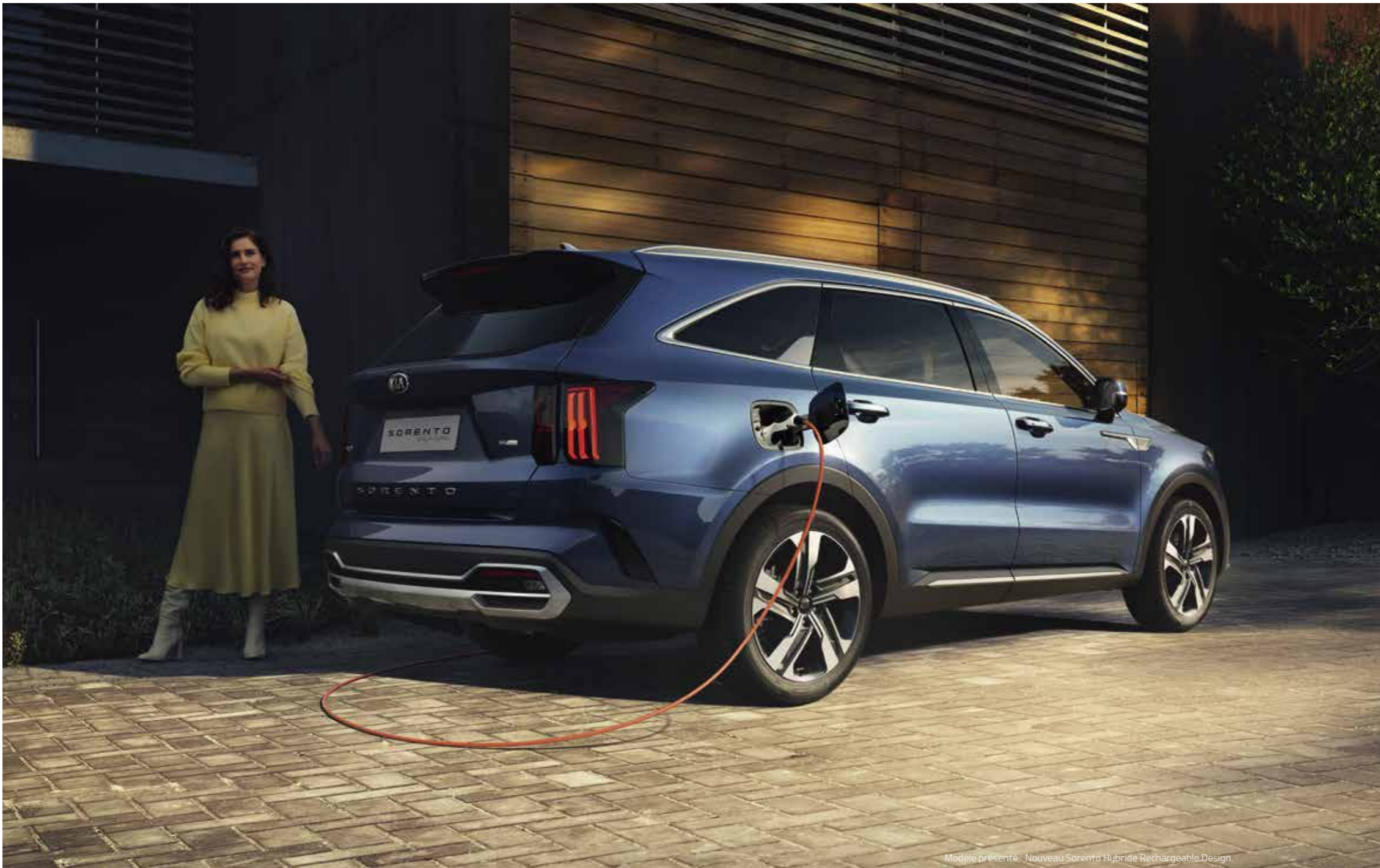
Modèle présenté : Nouveau Sorento Hybride Rechargeable Design.