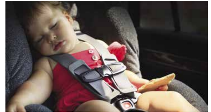
SYSTÈME D'ALERTE DES OCCUPANTS ARRIÈRE (ROA)

Si votre airbag se déclenche suite à une collision primaire, un signal est immédiatement envoyé au système de contrôle électronique de stabilité afin de freiner le véhicule. Le système MCB serre les freins pour éviter toute collision secondaire ou en réduire la gravité.