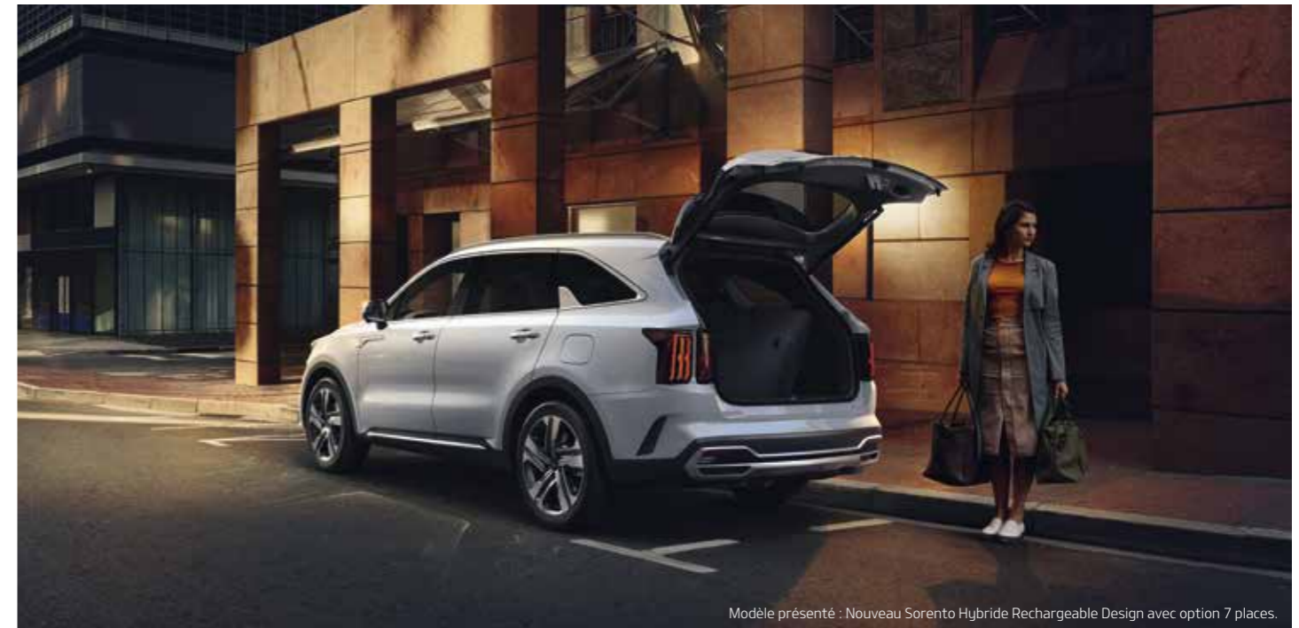
Modèle présenté : Nouveau Sorento Hybride Rechargeable Design avec option 7 places.

Vous voulez repousser vos limites ? Le Sorento vous invite à le faire avec style. Vous bénéficierez d'un maximum de confort, d'espace et de flexibilité, le tout rehaussé par un design extérieur des plus audacieux.