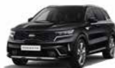
Noir Ebène (ABP) (1)