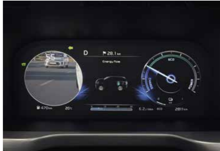
SYSTÈME D'AFFICHAGE DES ANGLES MORTS (BVM)

Si vous entreprenez un changement de voie alors qu'un véhicule se trouve dans votre angle mort, le Sorento serrera automatiquement les freins pour éviter toute collision, les symboles d'avertissement sur le rétroviseur extérieur et l'affichage tête haute clignoteront et un signal sonore se fera entendre.