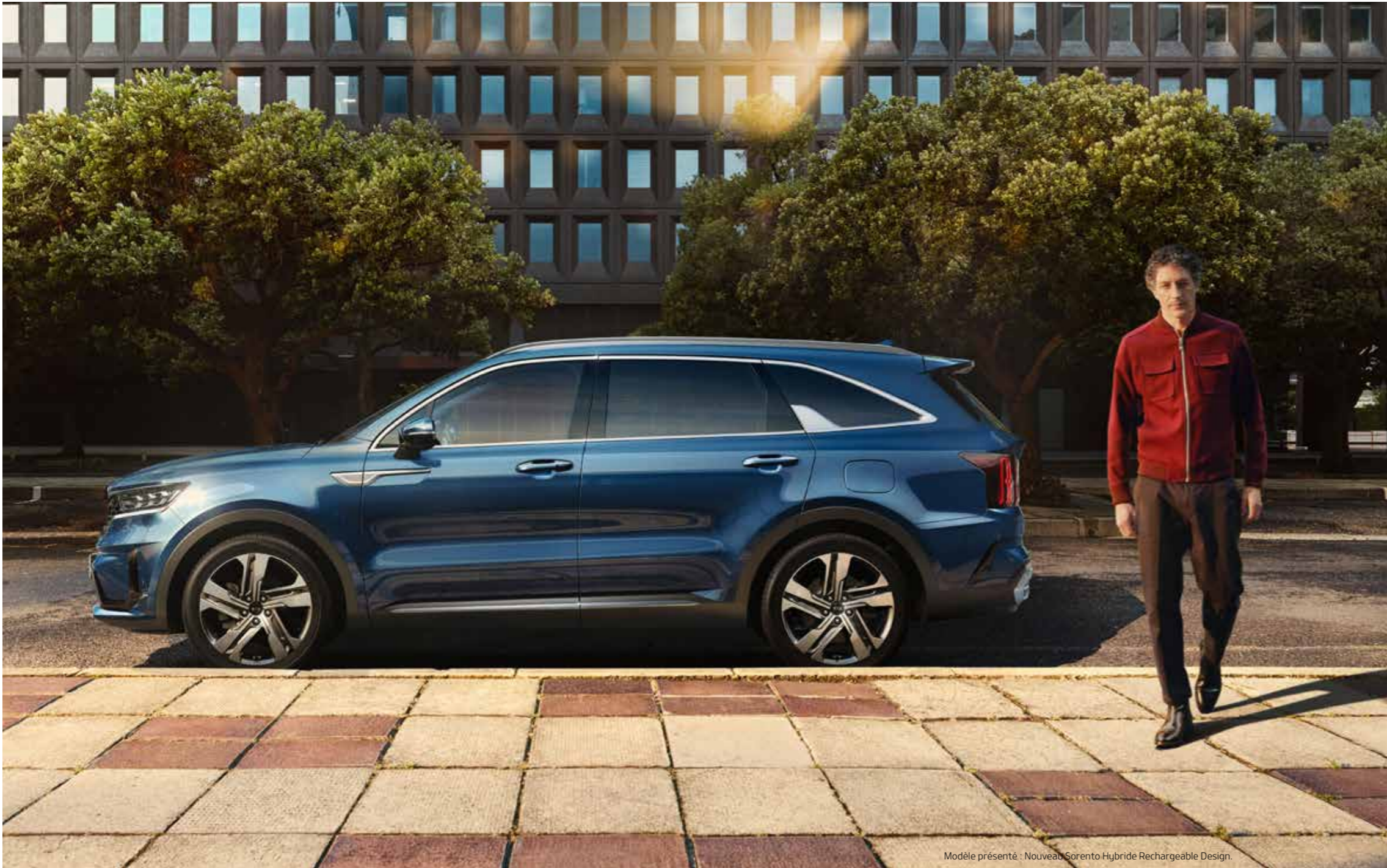
Modèle présenté : Nouveau Sorento Hybride Rechargeable Design.