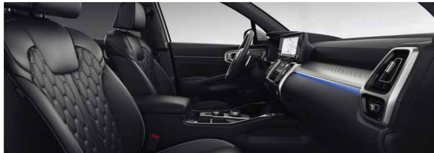
Sellerie cuir noir Nappa matelassé (de série sur la finition Premium)