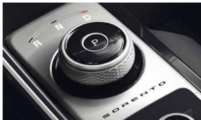
SÉLECTEUR DE RAPPORT ROTATIF

Les élégantes palettes de vitesses au volant en finition chromée se marient parfaitement au design de l'habitacle, et vous permettent de changer de rapport rapidement sans même lâcher le volant. Elles améliorent également la dynamique de conduite, vous permettant de disposer sans effort et plus rapidement d'un couple accru tout en conservant une parfaite maîtrise du véhicule.