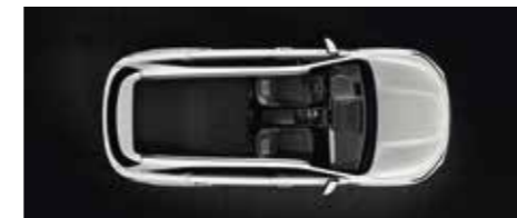
Sièges de la 2 ème rangée totalement repliés à plat (5 places)

Quels que soient vos projets et quoi que vous souhaitiez emporter, le Sorento est paré.