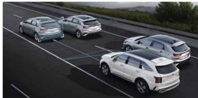
ASSISTANCE ACTIVE A LA CONDUITE DANS LES EMBOUTEILLAGES (LFA)

Le système DAW surveille les sollicitations du volant, des clignotants et de l'accélérateur, et vous avertit en cas de perte de concentration. Par exemple, dans les embouteillages, si le véhicule en amont redémarre et que vous restez à l'arrêt, le système vous alertera ; si vous montrez des signes d'endormissement, il vous encouragera à faire une pause.