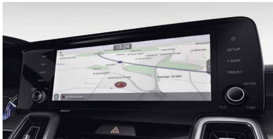
SYSTÈME DE NAVIGATION 10,25"

Dès l'instant où vous monterez à bord du nouveau Kia Sorento, vous découvrirez un éventail de technologies d'information et de divertissement de pointe, conçues pour vous garantir une parfaite maîtrise en toutes circonstances.