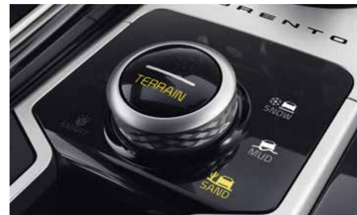
SÉLECTEUR DE MODE DE TERRAIN (TMS)

Le système de sélection du mode de conduite adapte également le degré d'assistance offert par le système de direction assistée, pour une conduite plus détendue ou une plus grande réactivité.