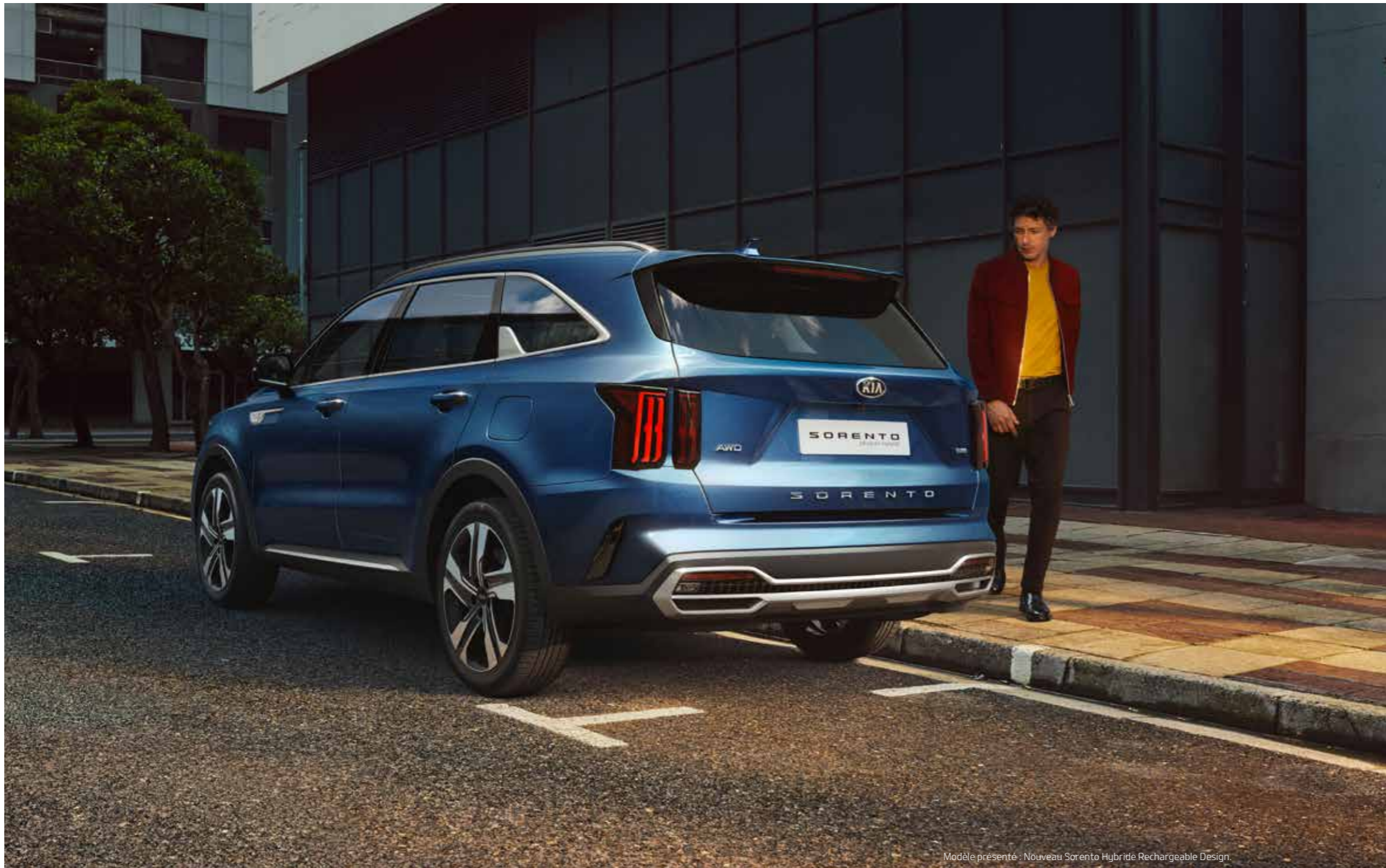
Modèle présenté : Nouveau Sorento Hybride Rechargeable Design.