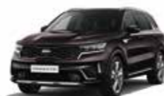
Brun Taïga (BE2) (1)