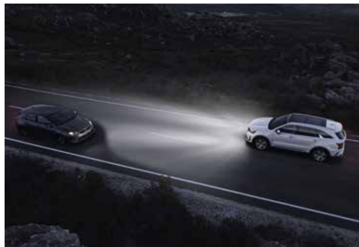
SYSTÈME DE GESTION INTELLIGENTE DES FEUX DE ROUTE (HBA)

Sur les courts comme sur les longs trajets, votre Kia Sorento contribue toujours à votre sécurité et à celle de vos passagers, pour que vous partiez l'esprit tranquille.