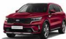
Rouge Magma (CR5) (1)