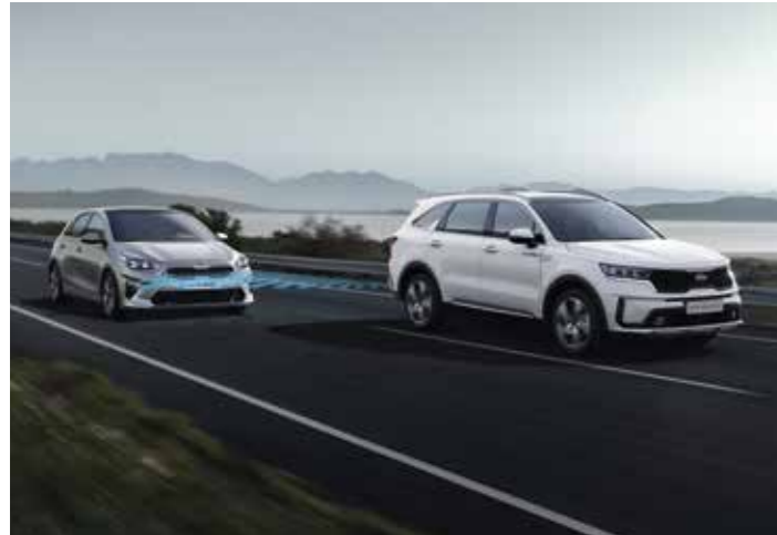
SYSTÈME ANTI-COLLISION AVEC DÉTECTION DES ANGLES MORTS (BCA)

Personne ne sait ce que nous réserve la route, c'est pourquoi le nouveau Sorento est équipé de solutions de pointe pour garantir une sécurité accrue.