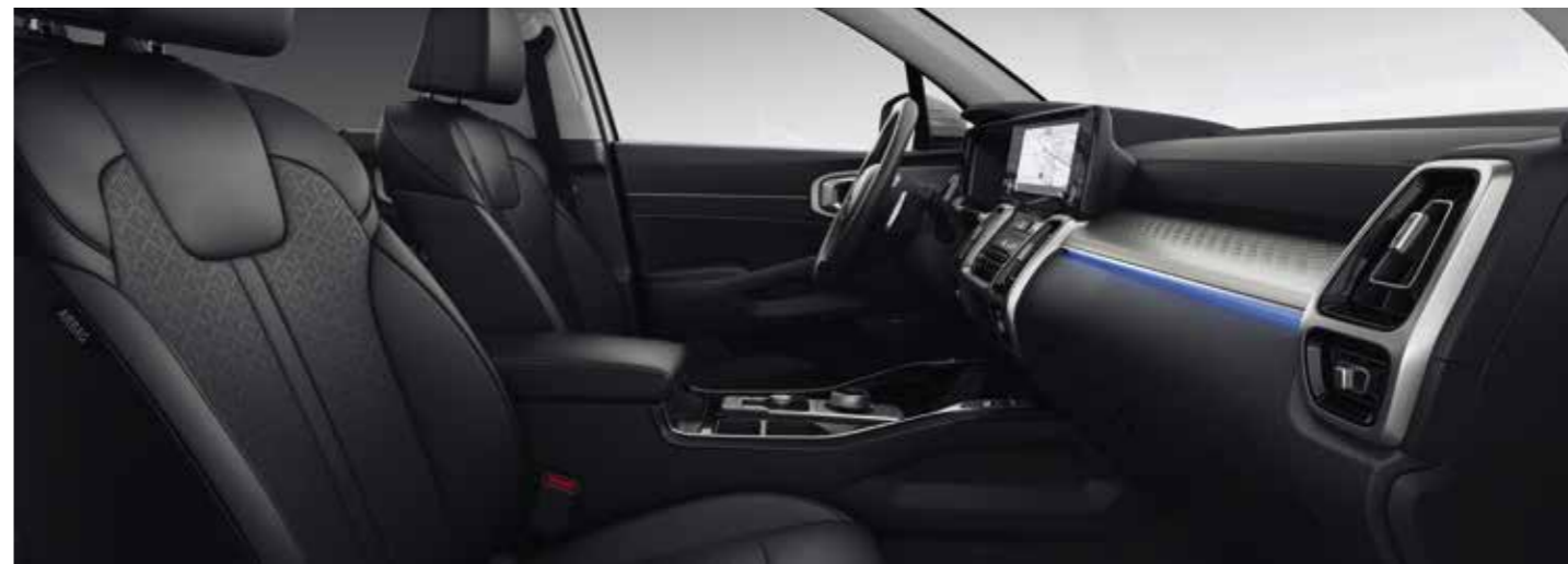
Sellerie cuir noir (de série sur la finition Design)