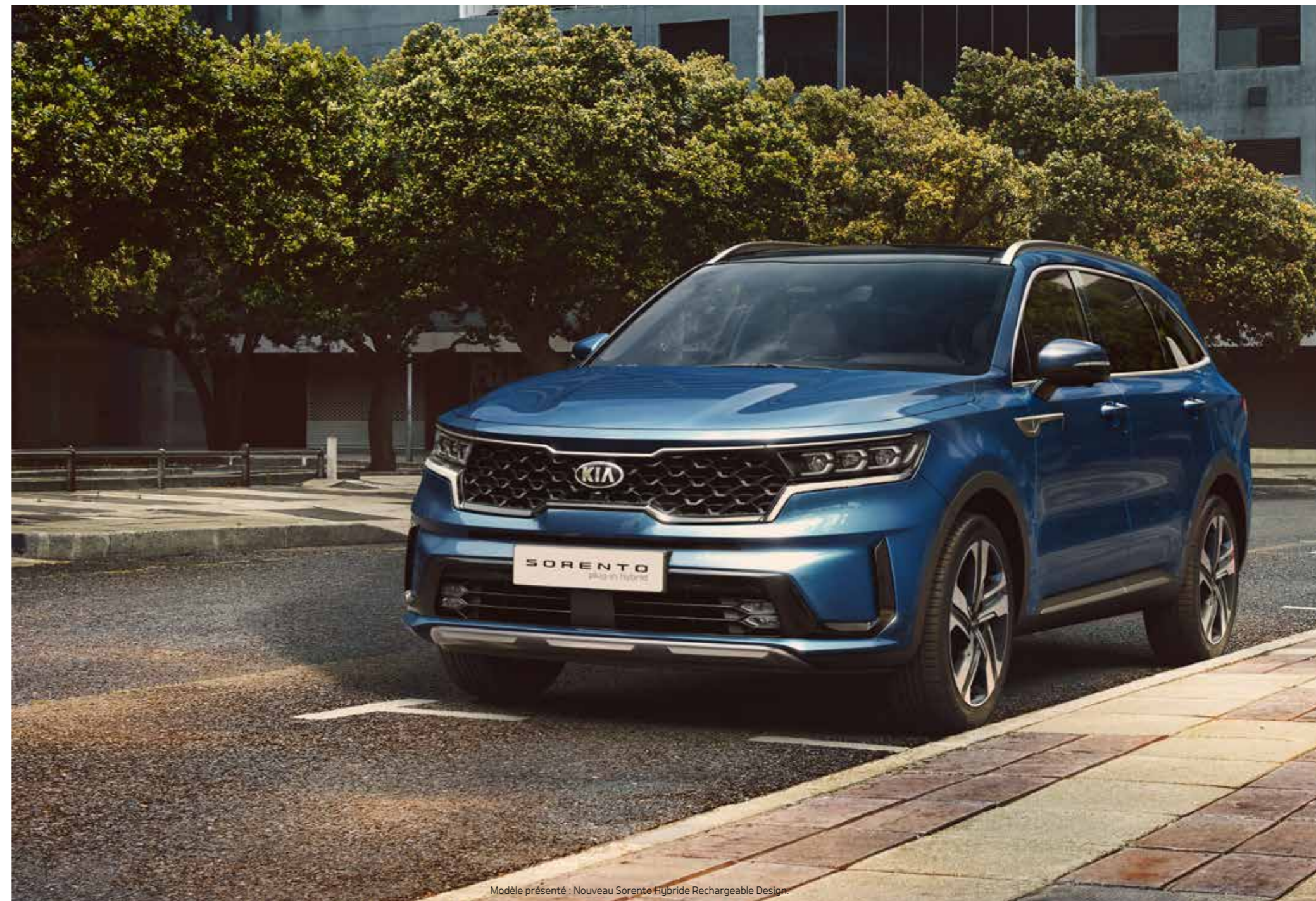
Modèle présenté : Nouveau Sorento Hybride Rechargeable Design.

Le design athlétique et tout en puissance du nouveau Sorento vous permettra d'affirmer votre personnalité sur la route. Admirez sa superbe calandre texturée, rehaussée d'un entourage chromé et noir brillant, son bouclier avant typé sport intégrant une grille de prise d'air en forme d'aile, son sabot de protection avant au profil élégant et ses splendides jantes alliage 19". Sans oublier la nouvelle technologie d'éclairage des projecteurs Full LED (de série dès la finition Active) ainsi que les feux de jour et antibrouillards à LED qui conjuguent à la perfection style et fonctionnalité.