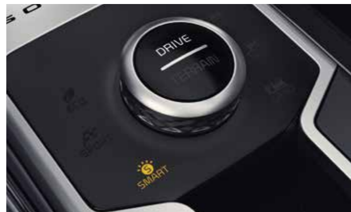
SÉLECTEUR DE MODE DE CONDUITE (DMS)

Le nouveau Sorento Hybride Rechargeable 1.6 T-GDi est équipé de la transmission automatique à six rapports, garantissant ainsi un passage des rapports tout en douceur.