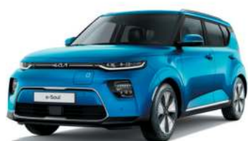
Bleu Cobalt (SRB)