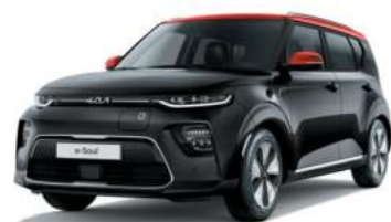
Noir Fusion / Toit Rouge Inferno (FA1)