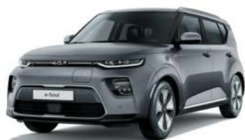
Gris Gravité (KDG)*