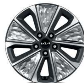
Jantes en alliage de 17" finition diamantée

* Teintes métallisée, nacrées ou bi-ton disponibles en option