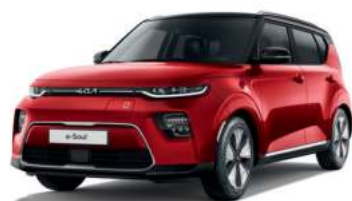
Rouge Inferno / Toit Noir Fusion (FA2)