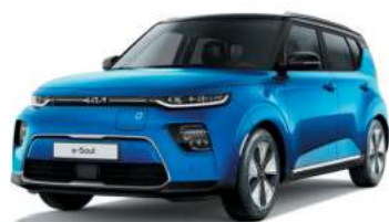
Bleu Neptune / Toit Noir Fusion (FB1)