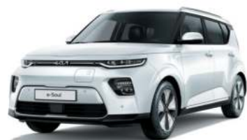
Blanc Nacré (SWP)*