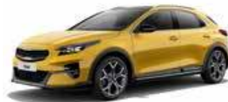
Jaune Equinoxe (YQM)