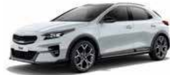
Blanc (WD) (1)