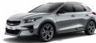
Gris Perle (CSS)