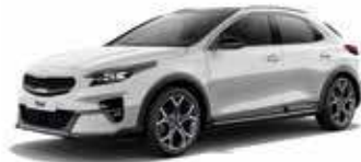
Blanc Sensation (HW2) (2)