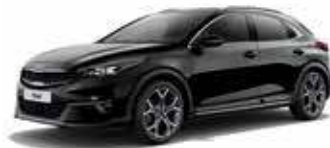
Noir Basalte (1K)