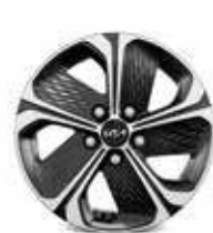
Jantes en alliage 16" (Motion & Active)