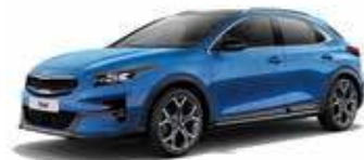
Bleu Fusion (B3L)