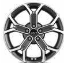
Jantes en alliage 18" (Design & Premium)