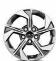
Jantes en alliage 16" (Motion & Active)