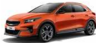
Orange Cuivre (RNG)