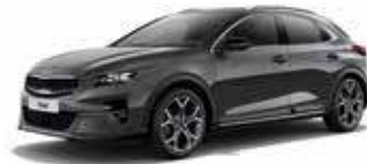
Gris Eclipse (H8G)