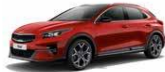
Rouge Rubis (AA9)