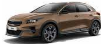
Bronze Ambré (M6Y)