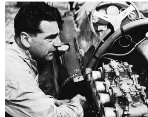
Figure de légende.

La gamme MINI John Cooper Works tire sa légendaire puissance de ses pièces et accessoires haute performance. Ses moteurs Twin Power Turbo génèrent un couple ahurissant qui promet de vous clouer à votre siège. Le grondement guttural sous le capot aura tôt fait de vous donner des palpitations, avant même que vous n'enfonciez l'accélérateur.