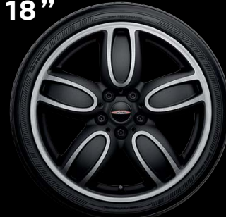
"CUP SPOKE" BICOLORES