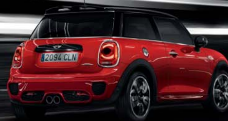
MINI 3 PORTES JOHN COOPER WORKS.