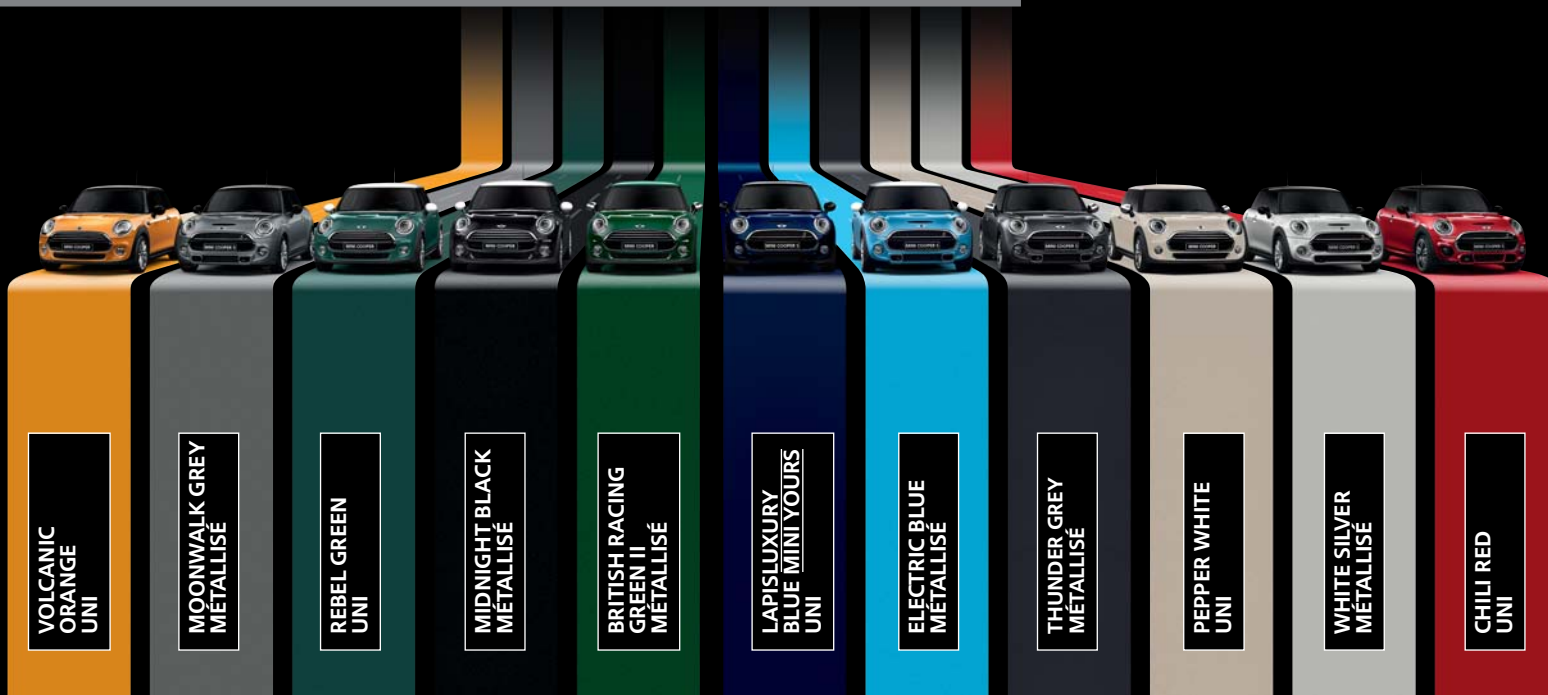
VOLCANIC ORANGE UNI