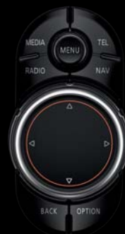
► MINI TOUCH CONTROLLER