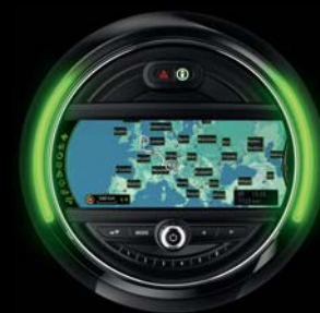
► SYSTÈME DE NAVIGATION

Une connexion Internet haut débit est nécessaire. Les frais supplémentaires en résultant [dus par exemple à l'itinérance des données] font partie du contrat signé entre le client et son fournisseur d'accès. L'application MINI Connected peut être téléchargée gratuitement sur la boutique d'applications du fournisseur de périphériques multimédias (exigences et conditions spécifiques au pays à respecter). Possibilité de mise à jour de l'application MINI Connected sans supplément de prix. Les extensions peuvent être payantes. Pour de plus amples informations notamment sur la compatibilité des périphériques multimédias, rendez-vous sur MINI.com/connectivity .