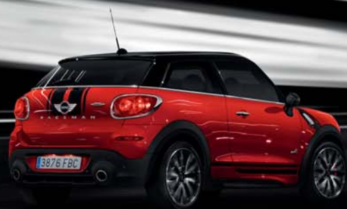
MINI PACEMAN JOHN COOPER WORKS.