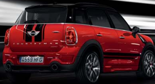
MINI COUNTRYMAN JOHN COOPER WORKS.