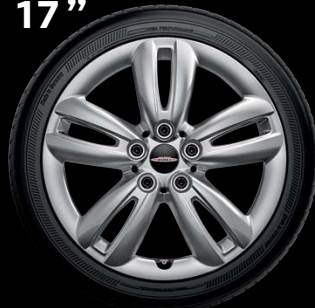
"TRACK SPOKE" SILVER