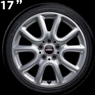
"RACE SPOKE" SILVER