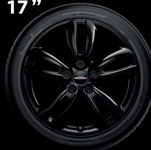
"TRACK SPOKE" NOIRES