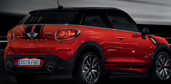
MINI JOHN COOPER WORKS PACEMAN.