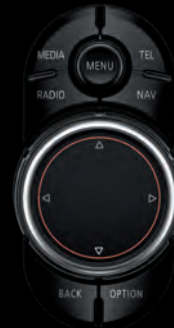
► MINI TOUCH CONTROLLER Niveau 2