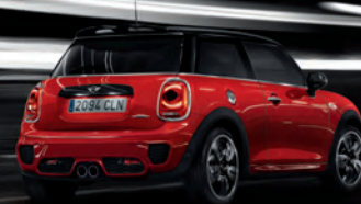
MINI JOHN COOPER WORKS 3 PORTES.