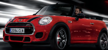
MINI JOHN COOPER WORKS CABRIO.