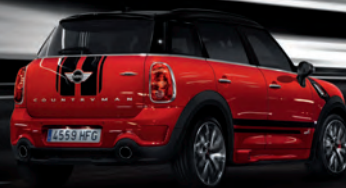
MINI JOHN COOPER WORKS COUNTRYMAN.