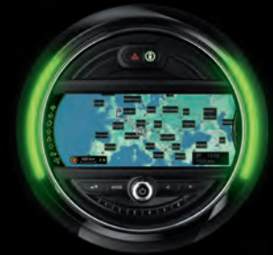
► SYSTÈME DE NAVIGATION

Une connexion Internet haut débit est nécessaire. Les frais supplémentaires en résultant [dus par exemple à l'itinérance des données] font partie du contrat signé entre le client et son fournisseur d'accès. L'application MINI Connected peut être téléchargée gratuitement sur la boutique d'applications du fournisseur de périphériques multimédias (exigences et conditions spécifiques au pays à respecter). Possibilité de mise à jour de l'application MINI Connected sans supplément de prix. Les extensions peuvent être payantes. Pour de plus amples informations notamment sur la compatibilité des périphériques multimédias, rendez-vous sur MINI.com/connectivity .