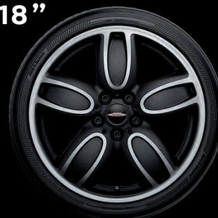
"CUP SPOKE" BICOLORES