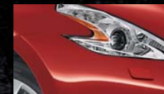
Vibrant Red A54 / (O)