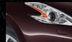
Black Rose NAG / (M)