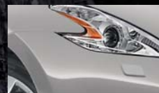
Gris Argent K23 / (M)