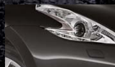
Noir Intense G41 / (M)