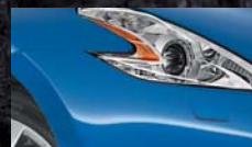
Bleu Royal RAE / (M)