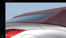
Capote Bordeaux (indisponible avec la couleur Vibrant Red)