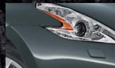
Gris Squalé KAD / (M)