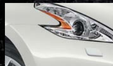
Blanc Lunaire QAB / (M)