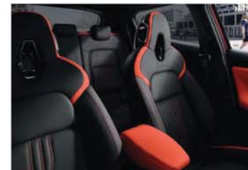
N-DESIGN PACK INTÉRIEUR ORANGE Sellerie Perso Orange : sellerie Cuir/TEP*