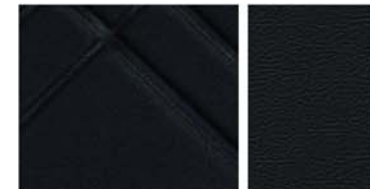
TEKNA Sellerie mixte TEP*/Tissu