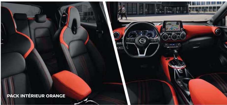
PACK INTÉRIEUR ORANGE