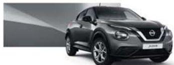
Gris Squalle (M) - KAD