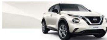
Blanc Lunaire (MS) - QAB