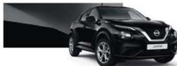
Noir Métallisé (M) - Z11