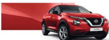
Rouge Toscane (O) - Z10