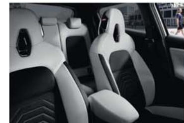
N-DESIGN PACK INTÉRIEUR BLANC Sellerie Perso Blanc : sellerie mixte TEP*/Tissu