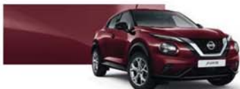
Rouge Passion (MS) - NBQ