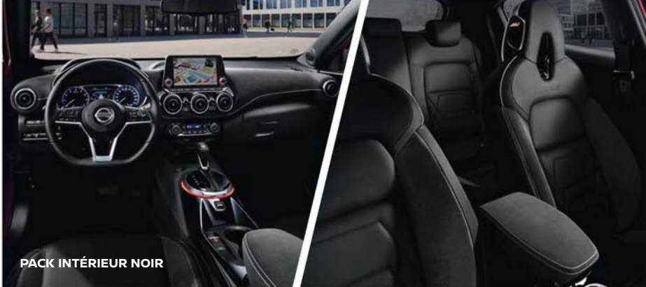
PACK INTÉRIEUR NOIR

PERSONNALISATION EXTÉRIEURE* Exprimez votre style avec les 11 combinaisons de couleurs de carrosserie bi-ton à votre disposition.