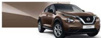
Bronze Intense (M) - CAN