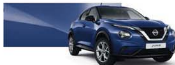
Bleu Indigo (M) - RBN