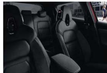
N-DESIGN PACK INTÉRIEUR NOIR Sellerie Perso Noir : sellerie Cuir/Alcantara*