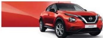
Rouge Fuji (MS) - NBV