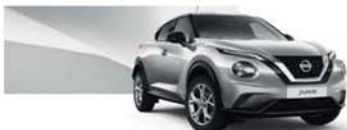
Gris Perle (M) - KYO