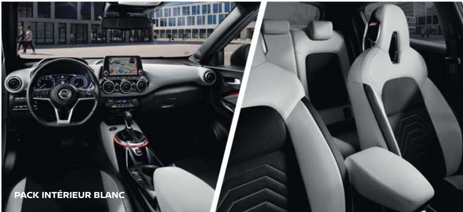
PACK INTÉRIEUR BLANC