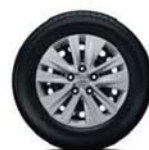
Acier 16" (avec enjoliveurs)