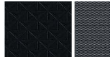
N-CONNECTA Sellerie Tissu Noir avec surpiqûres grises