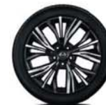
Alliage 19" AKARI