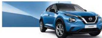
Bleu Topaze (MS) - RCA