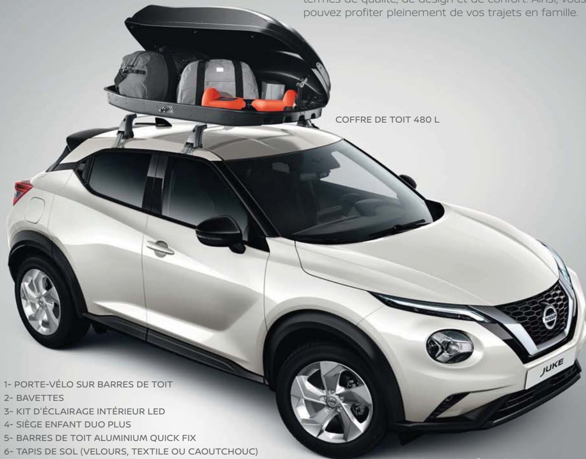
COFFRE DE TOIT 480 L

Comme votre Nissan JUKE, la gamme d'accessoires Nissan est conçue pour répondre à vos attentes en termes de qualité, de design et de confort. Ainsi, vous pouvez profiter pleinement de vos trajets en famille.