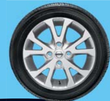
Demandez la brochure d'accessoires spécifiques Pixo