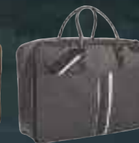
Valisette en cuir marron et TEP brun