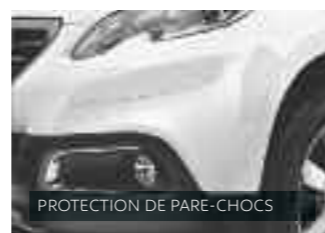
PROTECTION DE PARE-CHOC