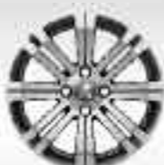
Jante alliage 16" Cetus