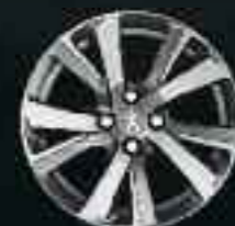
17" Roue diamantée Eridan Gris Mat (4)