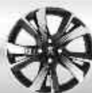
Jante alliage 17" Pyxis