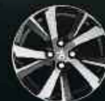
17" Roue diamantée Eridan Noir Brillant (5)