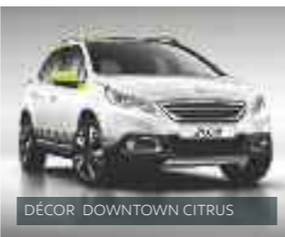
DÉCOR DOWNTOWN CITRUS