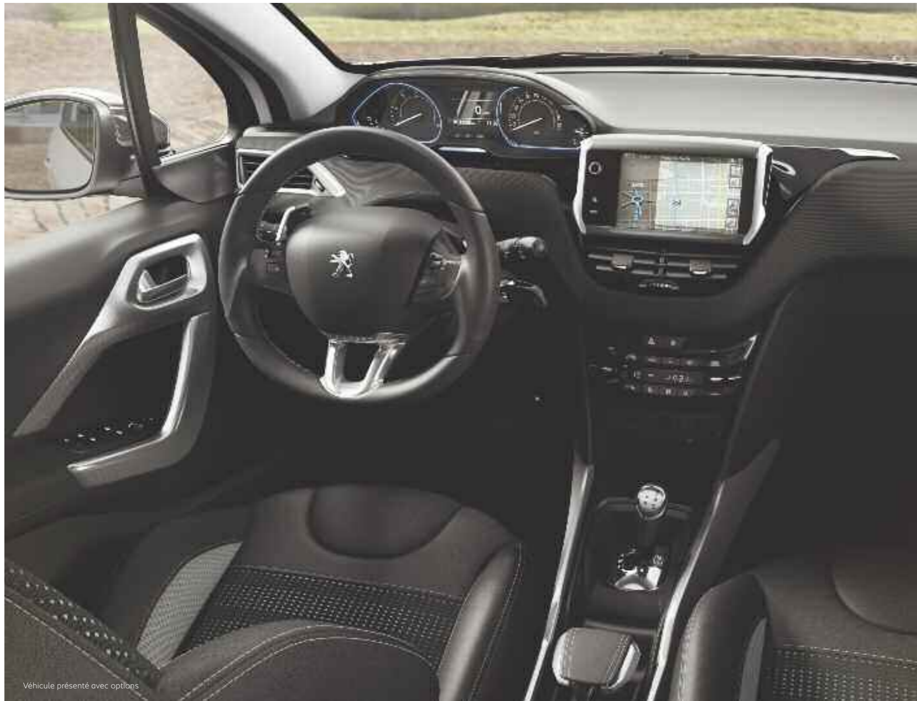
Véhicule présenté avec options