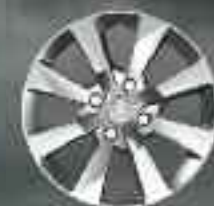
15" Enjoliveur Iode (1)

Un choix de différentes jantes est également disponible pour habiller votre 2008.