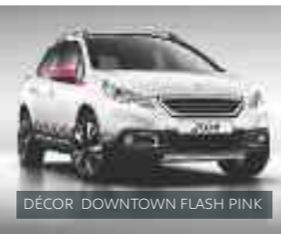
DÉCOR DOWNTOWN FLASH PINK