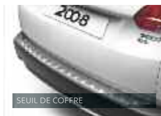
SEUIL DE COFFRE