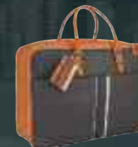
Valisette en cuir orange et TEP brun

Découvrez la ligne de style 2008 qui vous accompagnera avec élégance lors de vos déplacements.