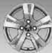
Jante alliage 15" Draco