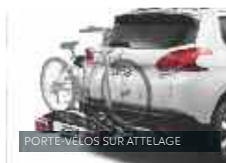
PORTE-VÉLOS SUR ATTELAGE