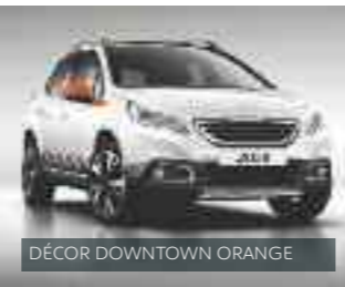
DÉCOR DOWNTOWN ORANGE