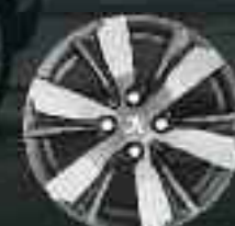
16" Roue diamantée Hydre Gris Ten Mat (3)