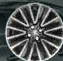
16" Enjoliveur Silice (2)