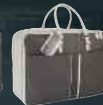
Valisette en cuir gris perla et TEP brun