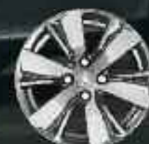
16" Roue diamantée Hydre Gris Dilium Brillant (3)