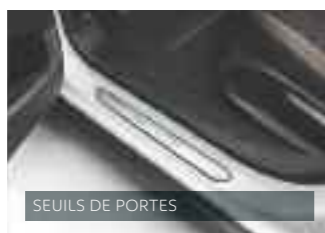
SEUILS DE PORTES