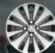
16" Enjoliveur Strontium (2)