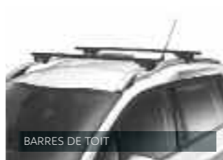
BARRES DE TOIT