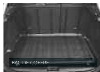
BAC DE COFFRE