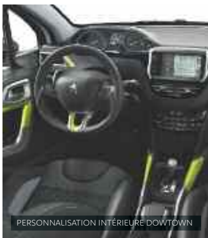
PERSONNALISATION INTÉRIEURE DOWNTOWN