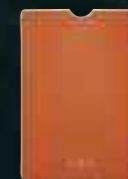
Étui pour tablette en cuir orange