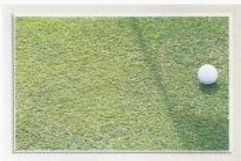
GREEN DE DAR EL SALAM