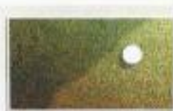
GREEN DE MIA