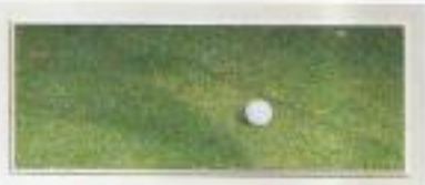
GREEN DE GSTAAD