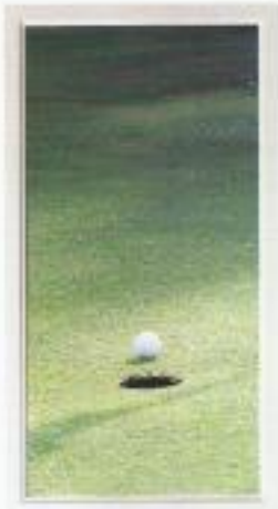
GREEN DE MARBELLA