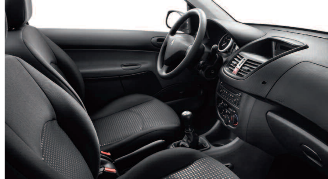
Maille Chekmate Mistral

*Disponible en option selon les versions.