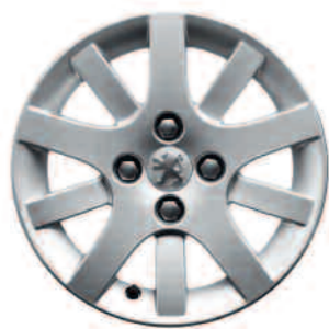
Jante aluminium 15\" data-bbox="150 817 228 837"/>

*Disponible en option selon les versions.