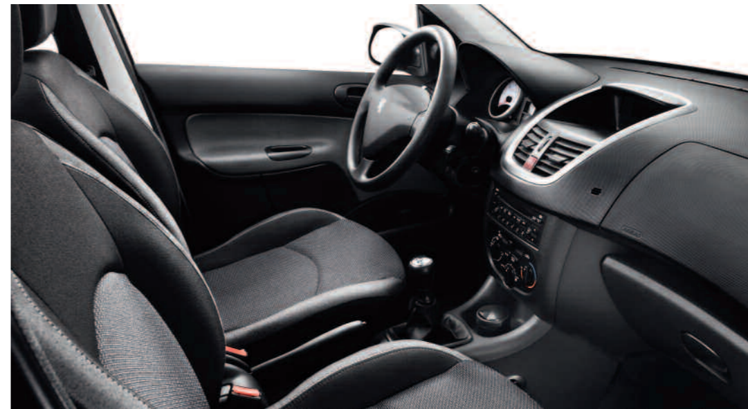
Chaîne et trame Pacifico Noir Bleuté