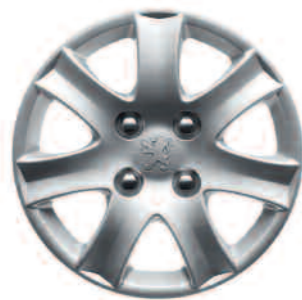
Enjoliveur 14\" data-bbox="50 817 99 837"/>