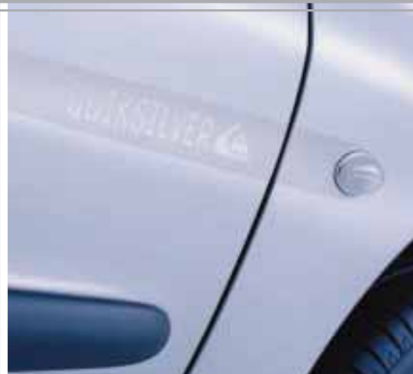
Signe extérieur de sensations fortes, le monogramme Quiksilver habille les portes et montants de portes.

Série très spéciale, proposée exclusivement en version 3 portes et habillée de gris Quartz métallisé, 206 Quiksilver se distingue par ses monogrammes spécifiques, ses coquilles de rétroviseurs et ses pare-chocs couleur carrosserie. La canule d'échappement chromée, les jantes aluminium «Sirocco» et les projecteurs à glace lisse affichent délibérément son caractère sportif. A l'intérieur, l'alliance des traitements aluminium et de la sellerie «Slater» renforce l'authenticité et la singularité Quiksilver. Le bac de coffre, amovible, peut accueillir un snowboard couvert de neige.