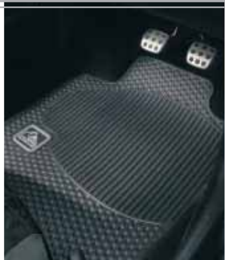
Pratiques et esthétiques, les surtapis en caoutchouc sont marqués du logo Quiksilver.