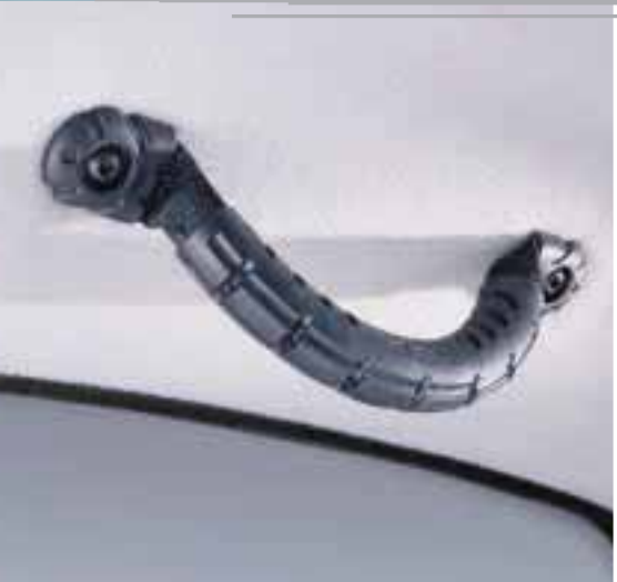
Poignée de maintien du passager avant style «foot-strap» de planche à voile.