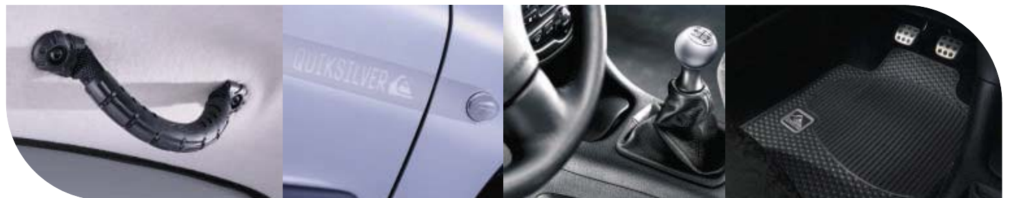
Poignée de maintien des passagers avant et arrière style "foot-strap" de planche à voile.

A l'intérieur, l'alliance des traitements aluminium et de la sellerie "Slater" renforce l'authenticité et la singularité Quiksilver. La berline peut en plus accueillir, grâce à son bac de coffre amovible, un snowboard couvert de neige.