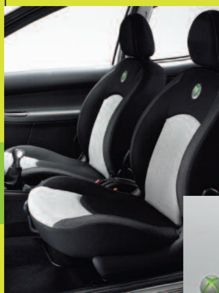
Garnissage spécifique "XBOX 360"