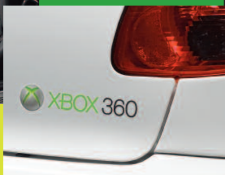
Monogramme "XBOX 360"