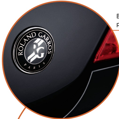
Badges "Roland-Garros" sur les portes avant et le volet de coffre