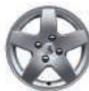
Jante Monaco 15 (3)