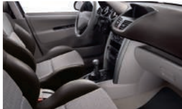
Maille Méilla Grège Criollo Disponible en série sur SW Outdoor