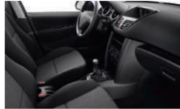
Chaîne et Trame Savana Noir Mistral Disponible en série sur Berline Urban