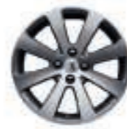
Jante Melbourne 17 (6) (jante non chaînable)