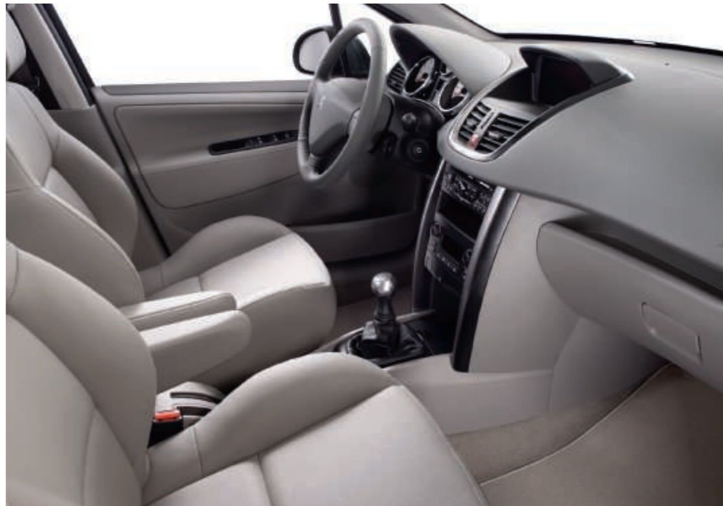
Option Cuir Perforé Grège (1) Disponible sur Berline Féline 5 portes