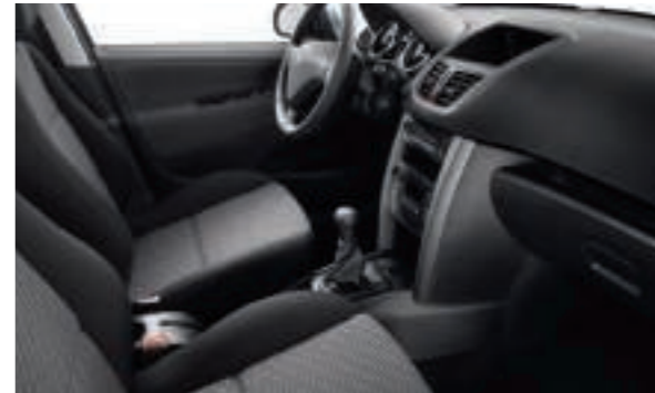
Chaîne et Trame SPA Noir Mistral Disponible en série sur Berline Premium et SW Premium