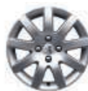
Jante Estoril 16 (4)