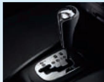
Boîte de vitesses automatique.

*Europe 14 pays – source A.A.A. - mars 2009