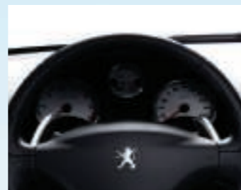
Palettes de changement de vitesses disponibles avec la boîte 2-Tronic (BVM5).