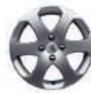
Jante Outdoor 16 (7) (jante non chaînable)