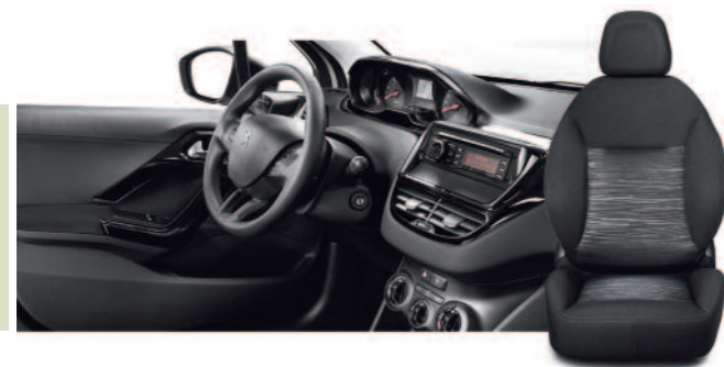
Tissu Etnical noir - Harmonie Mistral Access