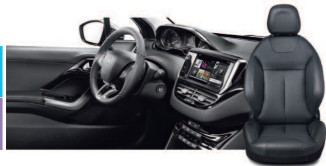
Cuir Claudia noir - Harmonie Mistral Option disponible à partir du niveau Allure