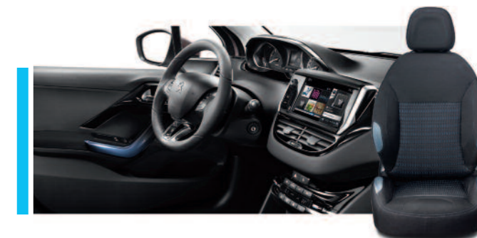
Maille 3D Ekmel bleu - Harmonie Mistral Allure (Disponible exclusivement sur les modèles 5 portes)