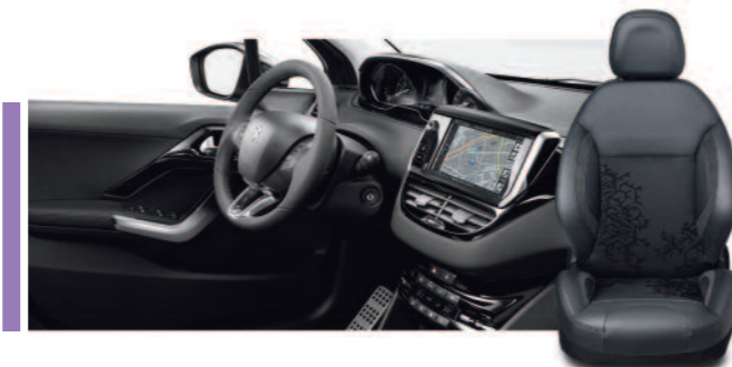
Mi-cuir, Alcantara, Mario Mistral - Harmonie Mistral Féline (Disponible exclusivement sur les modèles 5 portes)