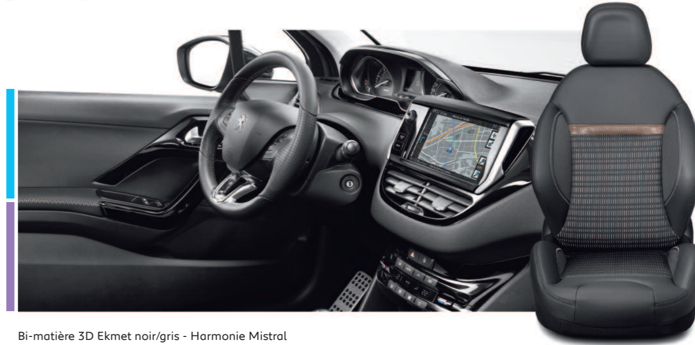
Bi-matière 3D Ekmel noir/gris - Harmonie Mistral De série sur Allure et Féline (Disponible exclusivement sur les modèles 3 portes)