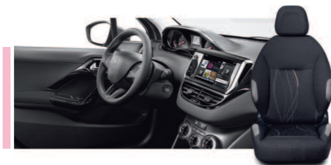
Tissu Curve noir mordoré - Harmonie Mistral Active

Les décors sont déclinés, selon les niveaux, en neuf ambiances différentes. Noir laqué en façade, sièges cuir ou tissu, décors de dégradés noir/bleu sur les crosses de portes,... une offre aux personnalités multiples qui s'inscrit toujours dans une ambiance contemporaine et élégante.