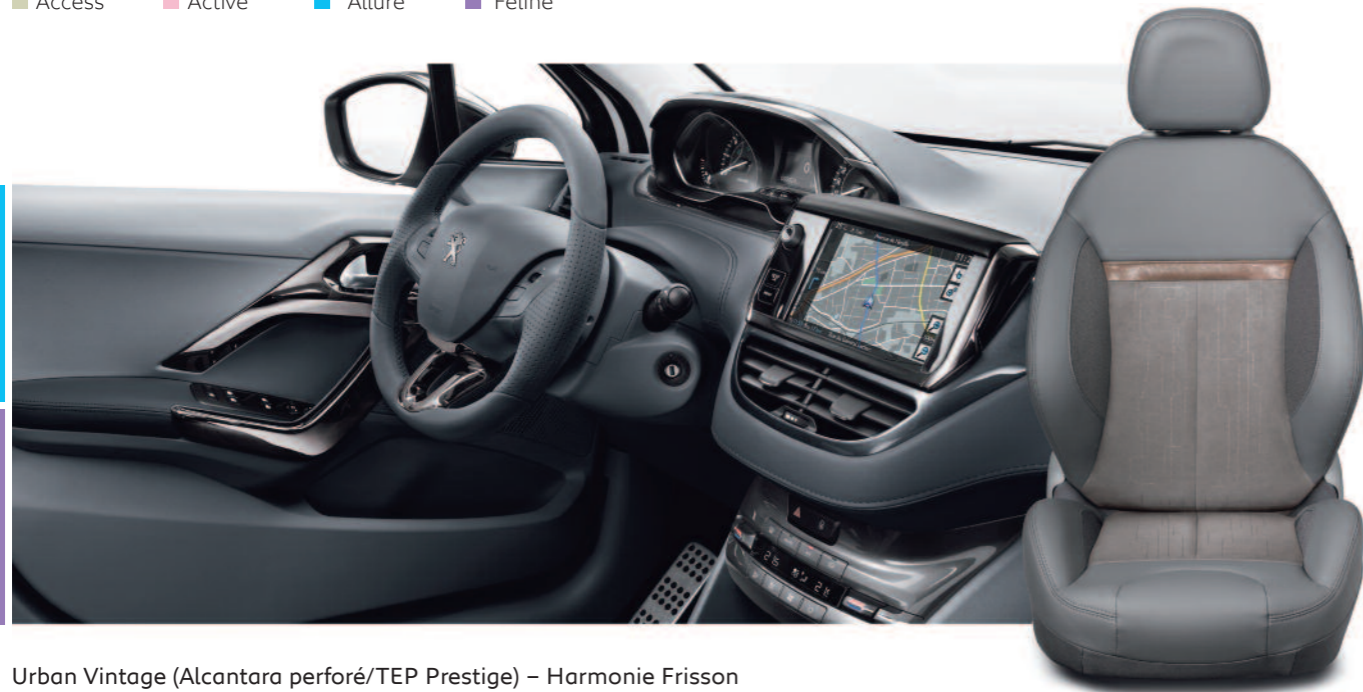
Urban Vintage (Alcantara perforé/TEP Prestige) – Harmonie Frisson avec décors intérieurs Dark Chrome et planche de bord gainée et surpiqûres Option disponible uniquement sur niveaux Allure et Féline (3 et 5 portes)