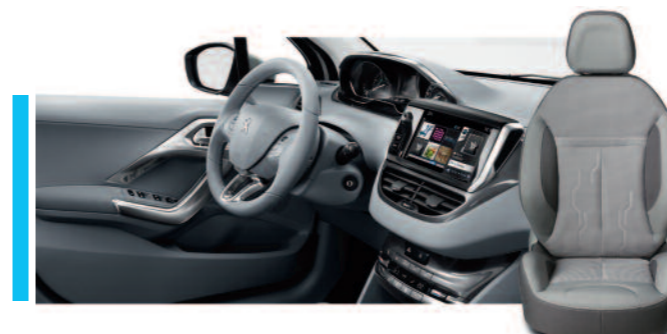
Tissu Textab Tree - Harmonie Frisson Allure (Disponible exclusivement sur les modèles 5 portes)