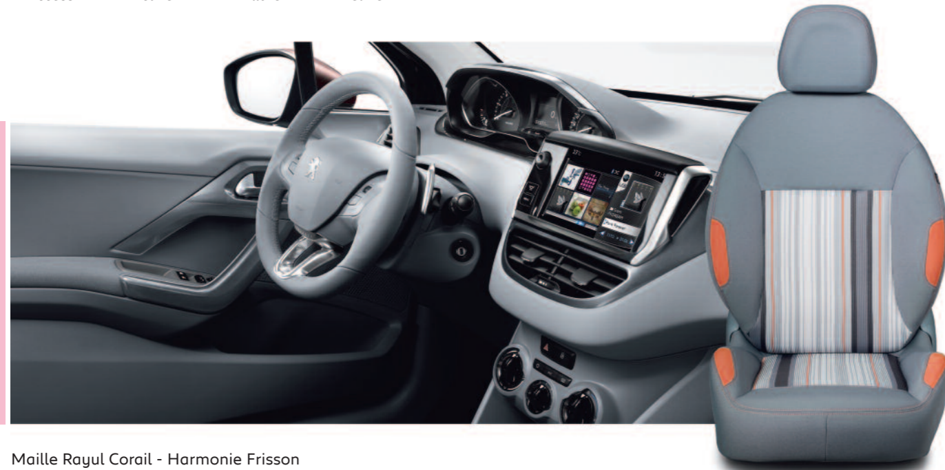
Maille Rayul Corail - Harmonie Frisson Active