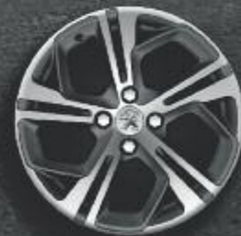
Jante 17" Carbone diamantée Storm (verniss mat)