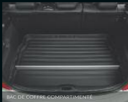
BAC DE COFFRE COMPARTIMENTÉ