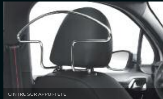
CINTRE SUR APPUI-TÊTE

Démultipliez les effets de l'expérience GT en dotant votre 208 d'accessoires adaptés en fonction de vos envies et de vos besoins pour encore plus de confort et de praticité.