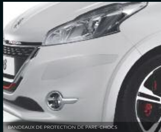
BANDEAUX DE PROTECTION DE PARE-CHOCS