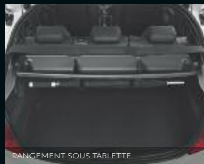
RANGEMENT SOUS TABLETTE