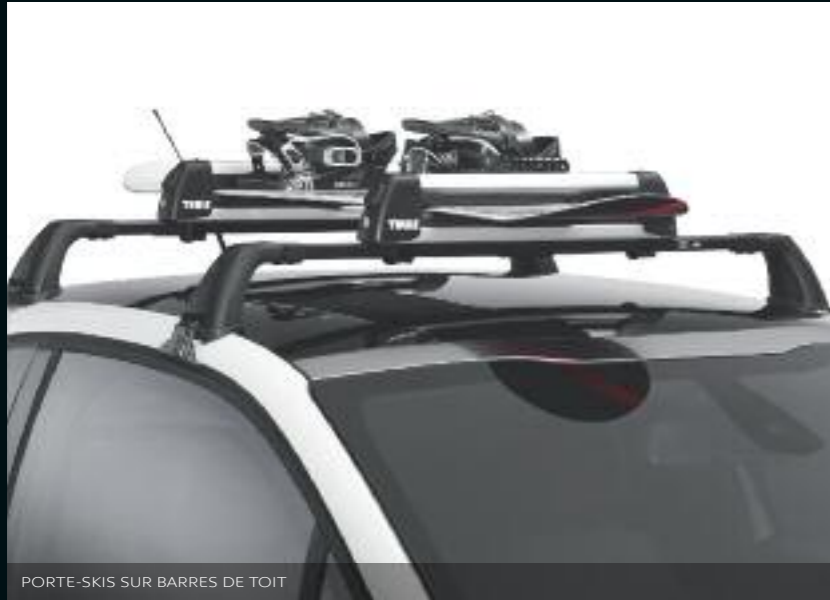
PORTE-SKIS SUR BARRES DE TOIT