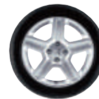
CHALLENGER 17 pouces (roue non chaînable)