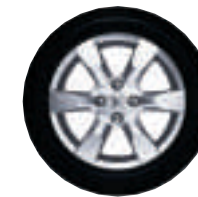
EQUINOXE 16 pouces