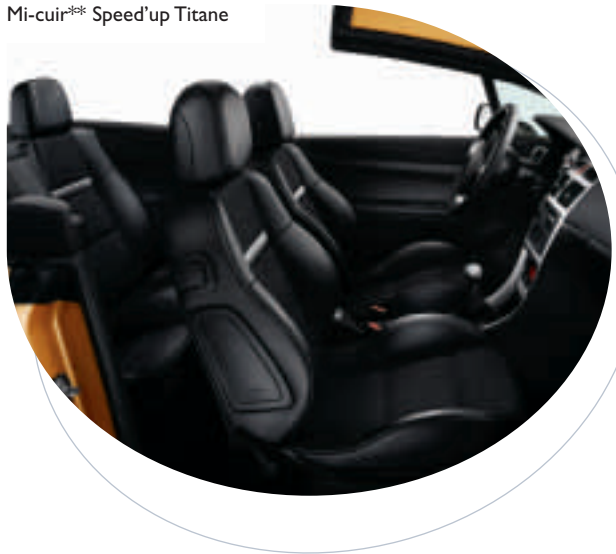
Mi-cuir** Speed'up Titane