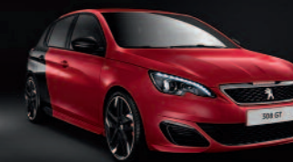
Rouge Ultimate / Noir Perla Nera