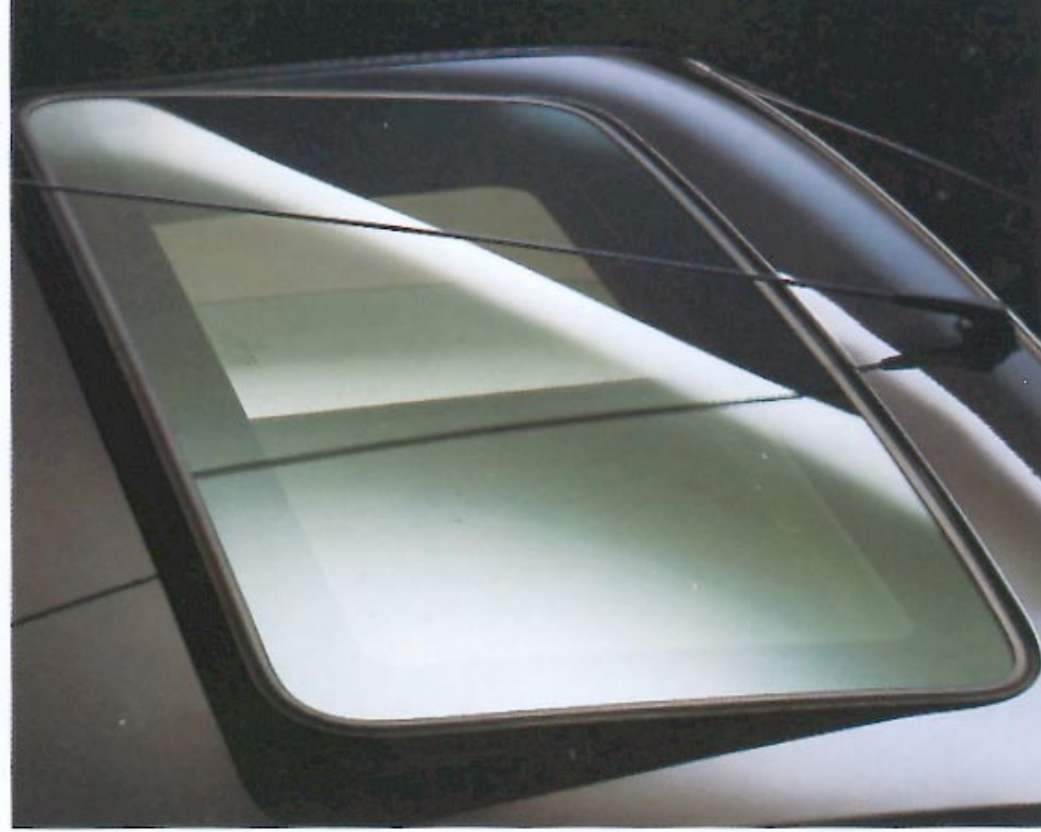
Toit ouvrant à commande électrique en option