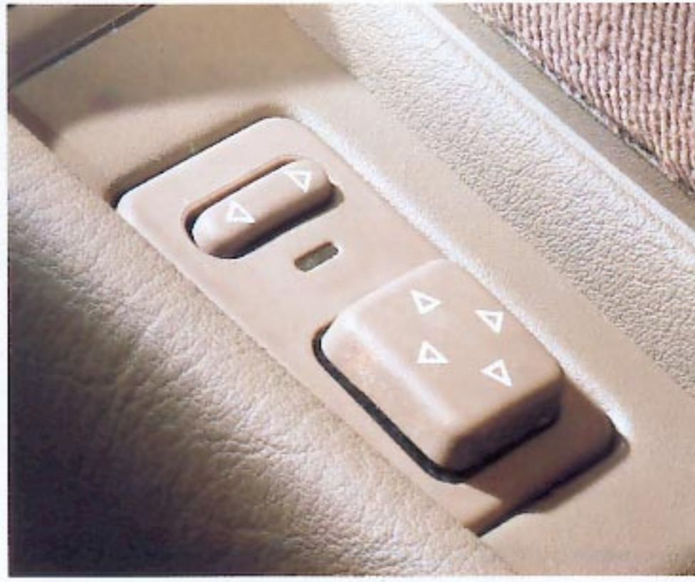
Commandes électriques de réglage des rétroviseurs