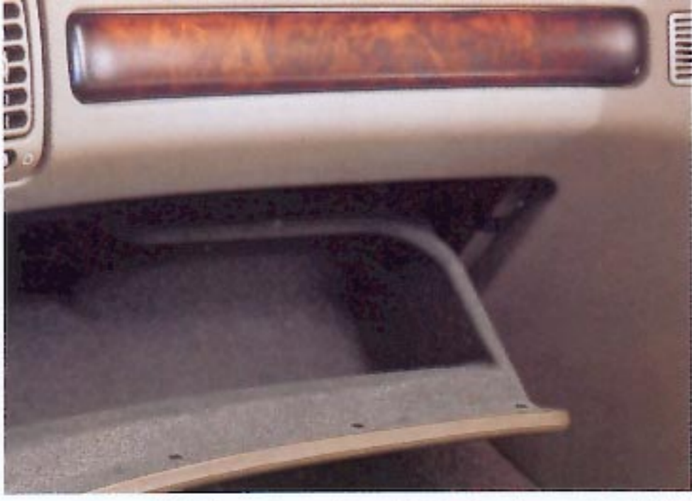
Boîte à gants éclairée et verrouillable