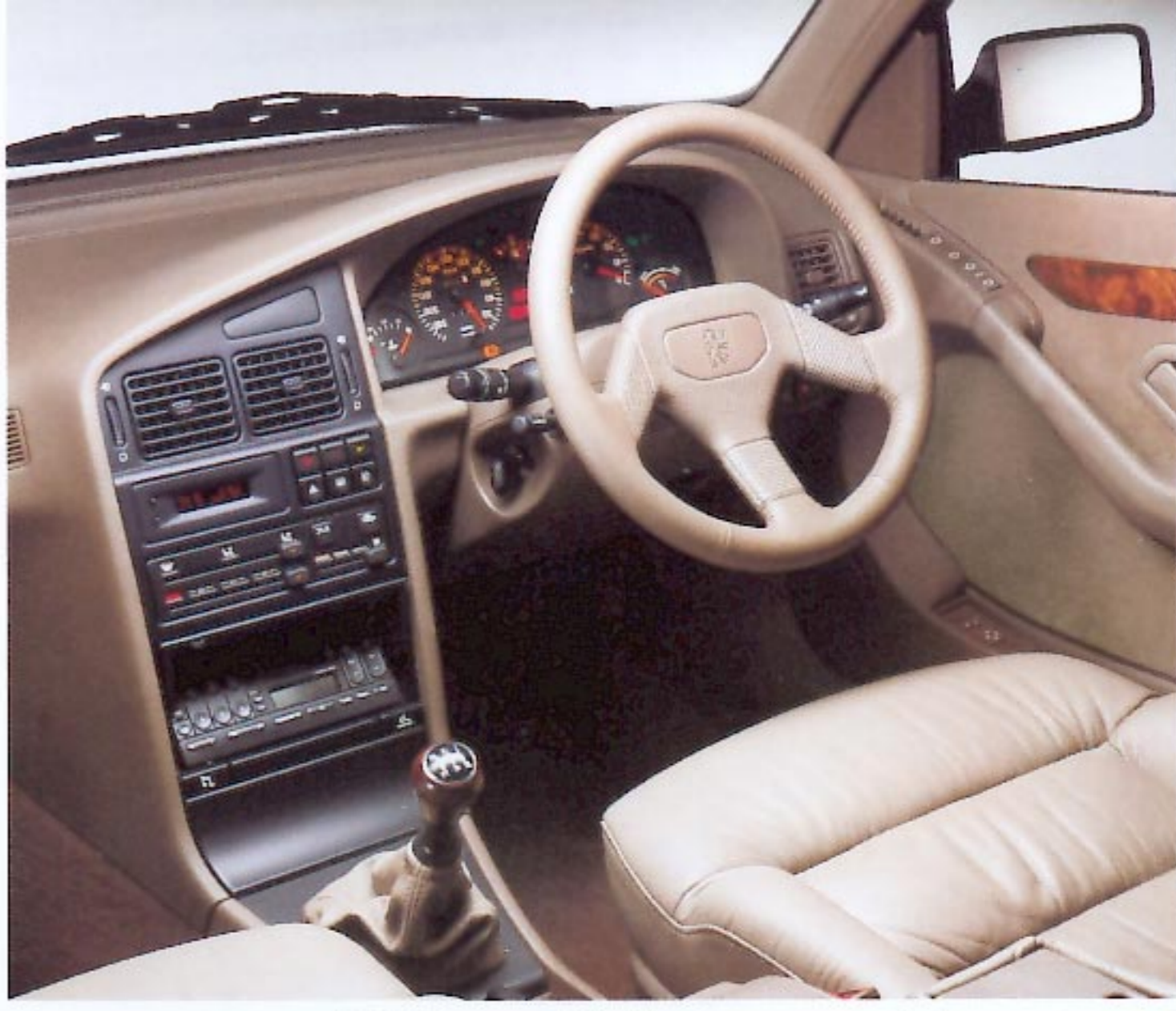
Poste de conduite avec autoradio "Peugeot 405"