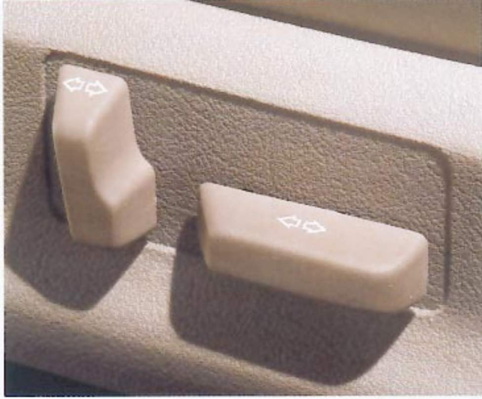
Commandes électriques de réglage du siège conducteur