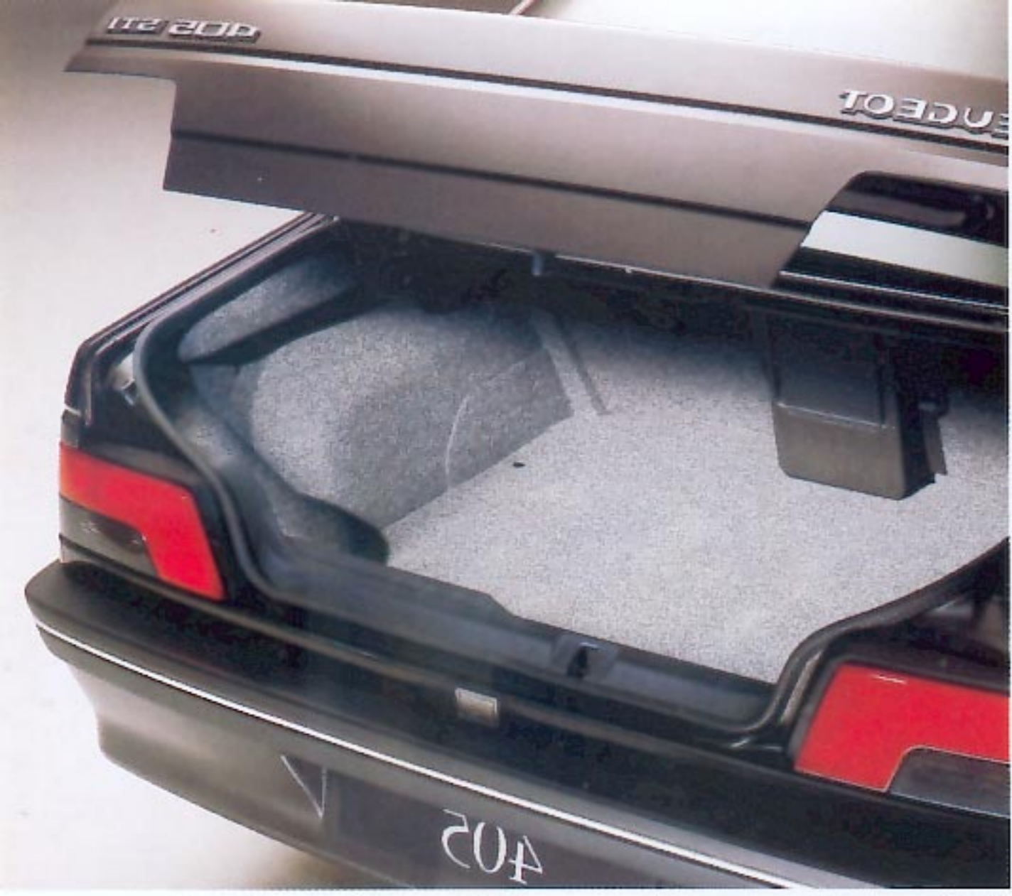
Coffre garni de moquette, avec éclairage et trappe à skis