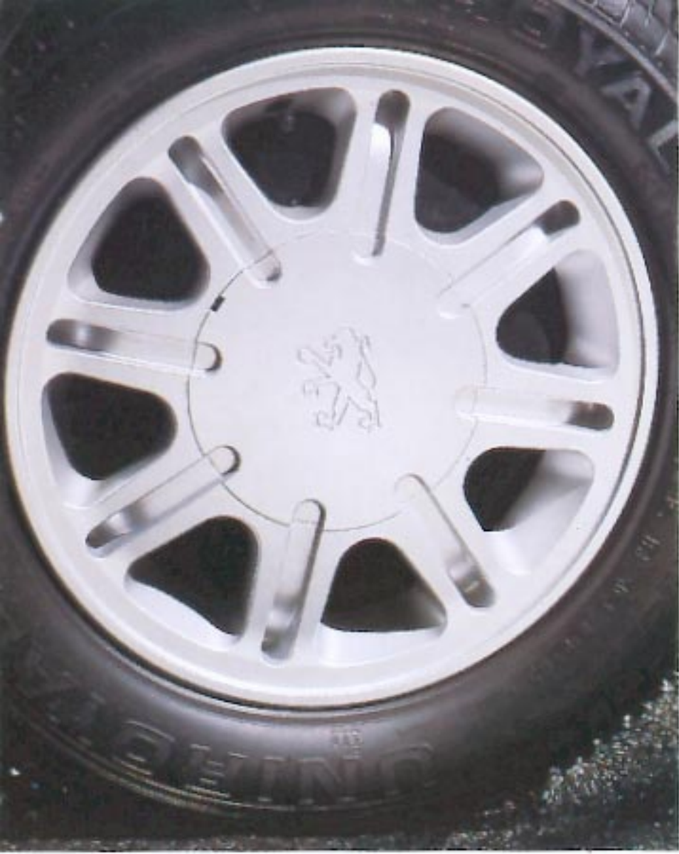
Jante en alliage léger