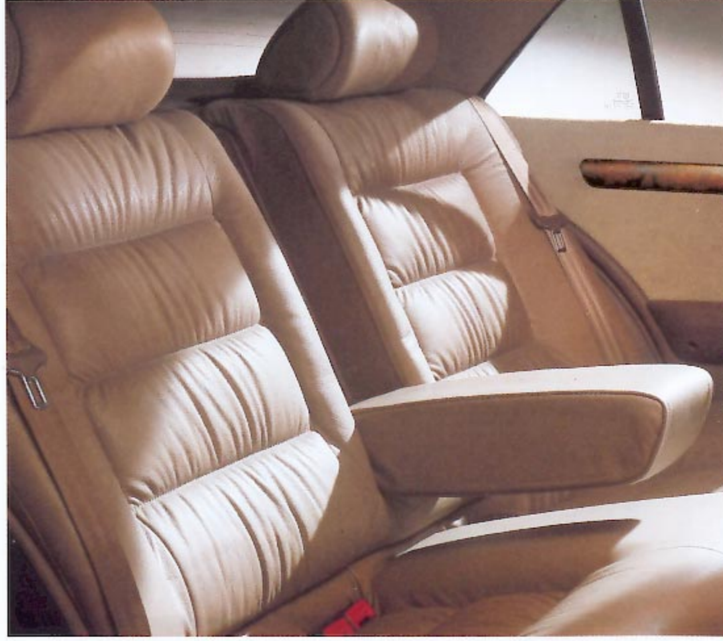
Garnissage des sièges en cuir