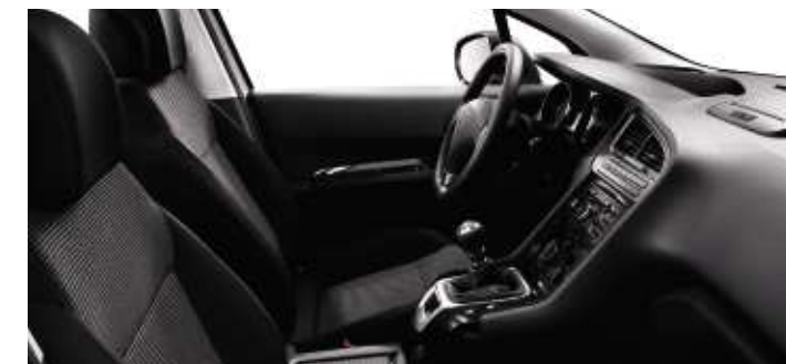
Tissu Strada Noir Tramontane