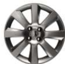
Jante 18" MAGNETIK

* Détail cuir sièges avant : – Appuie-tête : Face avant en cuir. – Dossiers : Face avant et joues intérieures des extensions latérales en cuir. – Coussins : Face supérieure et joues intérieures des extensions latérales en cuir. – Accoudoir central en cuir.