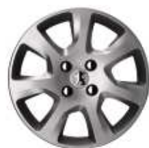
Enjoliveur 16" HAUMEA