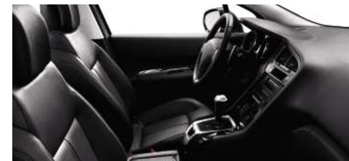
Cuir Noir Tramontane* (en option)