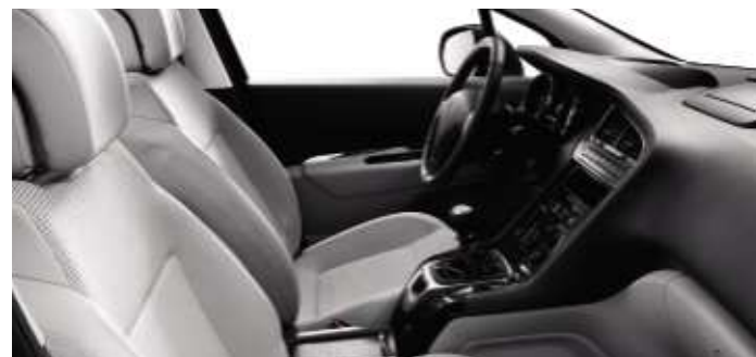
Tissu Strada Guérande