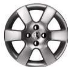
Jante 16" ERIE