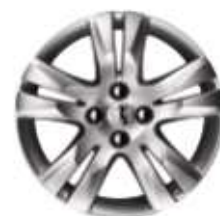
Jante 17" QUARK