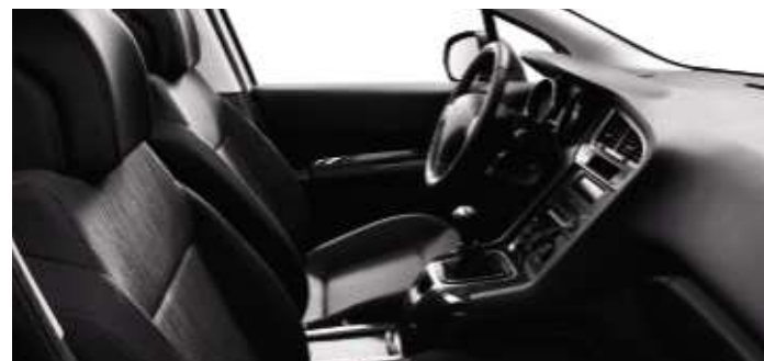
Tissu Ligne Noir Tramontane