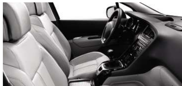
Cuir Guérande* (en option)