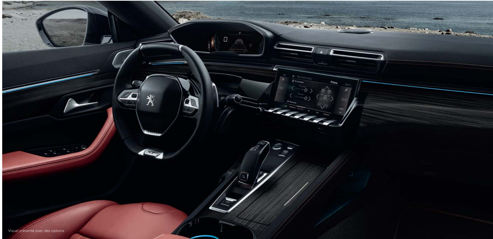
Visuel présenté avec des options