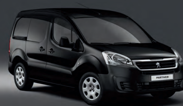
Teinte Opaque Noir Onyx*