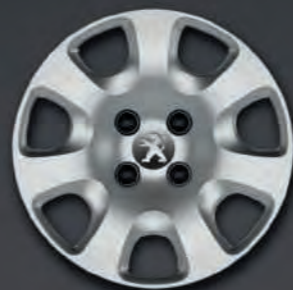
Enjoliveur Atacama 15''