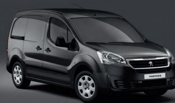
Teinte Métallisée* Gris Shark