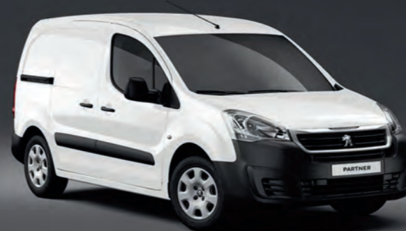
Teinte Opaque Blanc Banquise