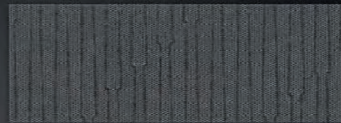
Tissu Réseau Gris