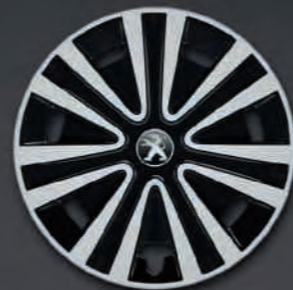
Enjoliveur Nateo 15''**