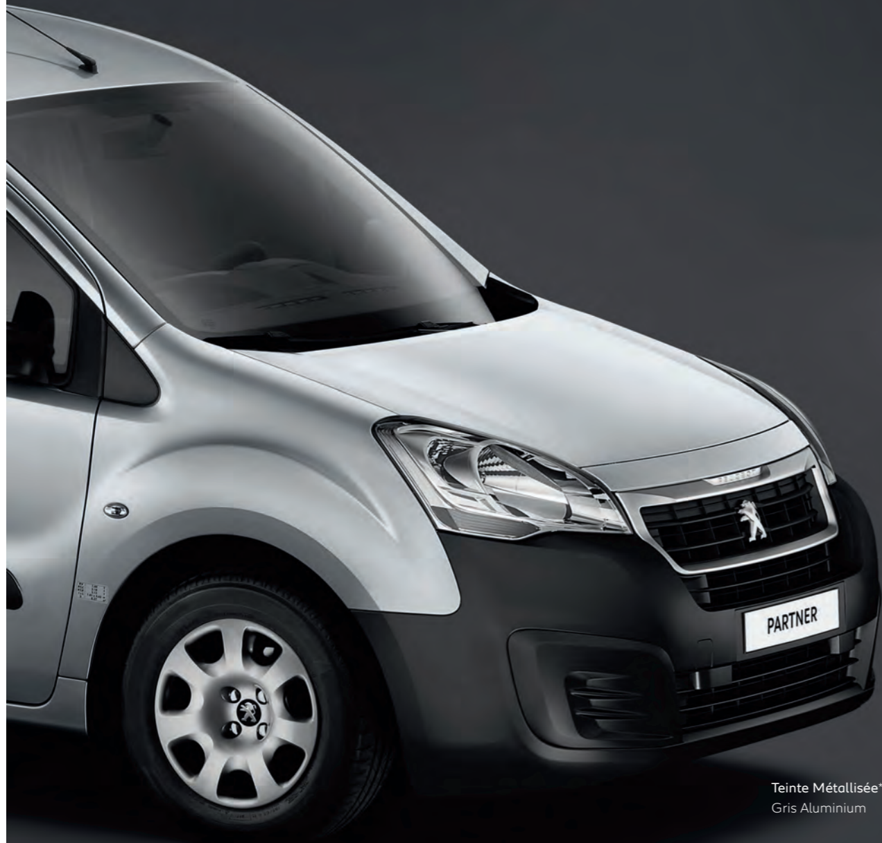
Teinte Métallisée* Gris Aluminium