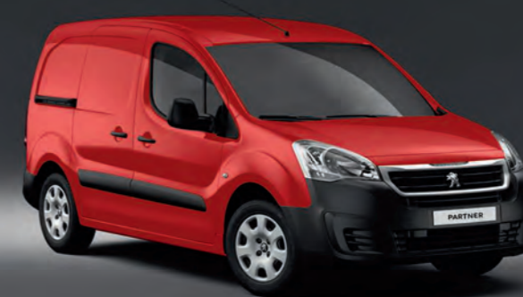
Teinte Opaque Rouge Ardent