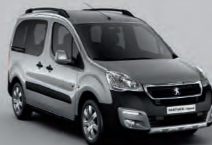
Gris Artense (1)