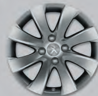
Jante Alu Managua 16" (4)