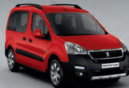
Rouge Ardent *