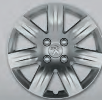
Enjoliveur Grenade 16" (3)