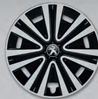
Enjoliveur Nateo 15" (2)