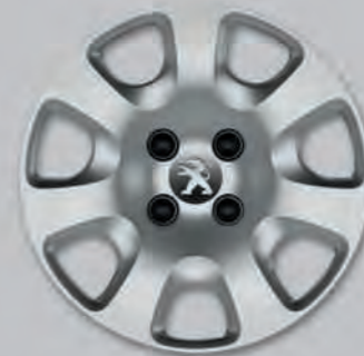
Enjoliveur Atacama 15" (1)