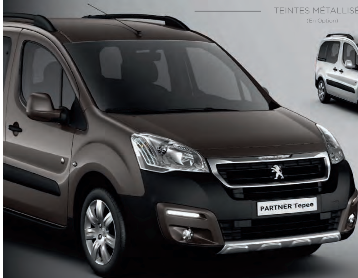
Gris Moka (1)