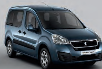
Bleu Kyanos (1)(2)