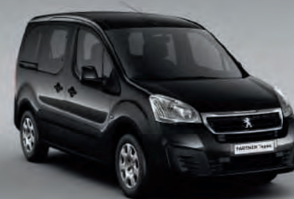
Noir Onyx *(2)