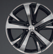
Technical 19" Grey*