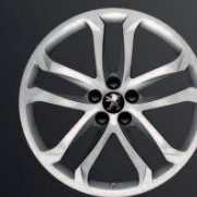
Solstice 19" Anthra Grey*