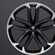
Solstice 19" Mat Black Onyx*

* Disponibles en option. Pneumatiques chaînables disponibles dans le réseau, adaptables sur les jantes 18".