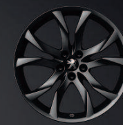
Sortilège 19" Mat Black Onyx*