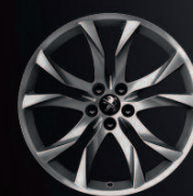
Sortilège 19" Midnight Silver*