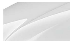
Blanc Cristal (9P9P)