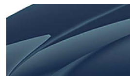
Bleu Pacifique (Z5Z5)