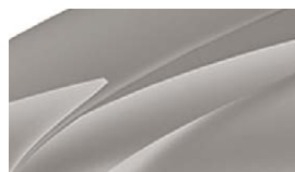
Beige Cappuccino (4K4K)