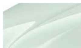
Blanc Laser (J3J3)