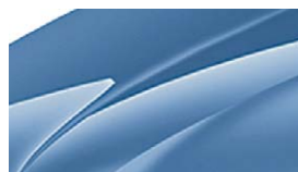
Bleu Denim (G0G0)