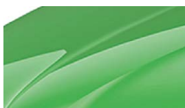
Vert Rallye (P7P7)