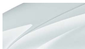
Blanc Lune (Z2Y2)