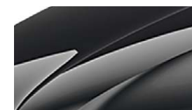
Noir Magic Nacré (1Z1Z)

La Rapid Spaceback Drive bénéficie d'un intérieur très qualitatif : insert type alu brossé et sellerie exclusive tissu noir spécifique. L'ensemble des éléments de carrosserie peints donne au véhicule un caractère statuaire accru.