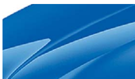
Bleu Racing (8X8X)