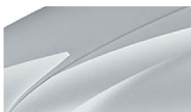
Gris Argent (8E8E)