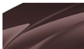
Marron Topaze (4L4L)