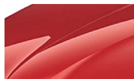
Rouge Corrida (8T8T)