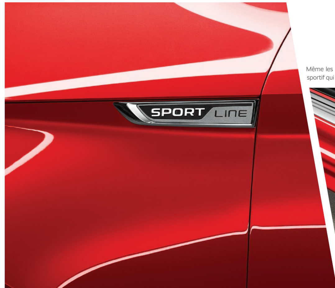
L'emblème SportLine orne les passages de roue avant.

Même les équipements fonctionnels, tels que les seuils de porte décoratifs, affichent un look sportif qui contribue à cette esthétique unique.