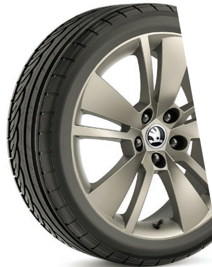
Les jantes alliage 18" ZENITH Platine sont proposées de série.