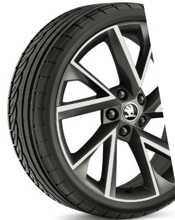
Les jantes alliage 19" VEGA Anthracite sont disponibles en option.