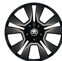
Jantes alliage 17" Origami Noir