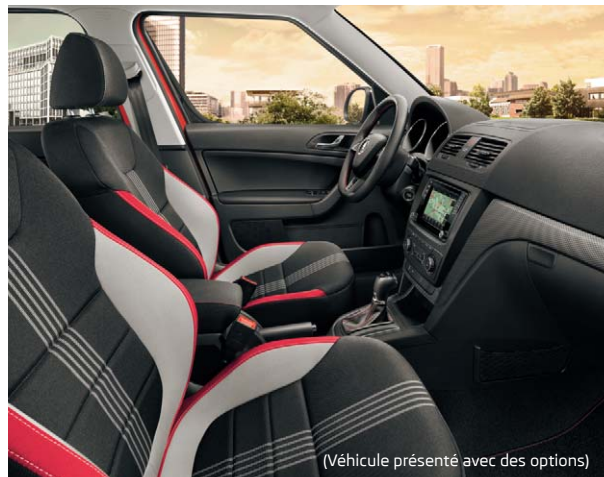
(Véhicule présenté avec des options)