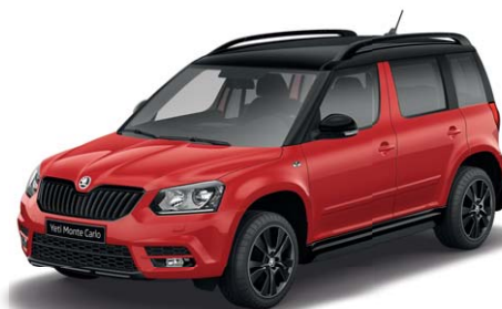
Rouge Corrida (8T8T)