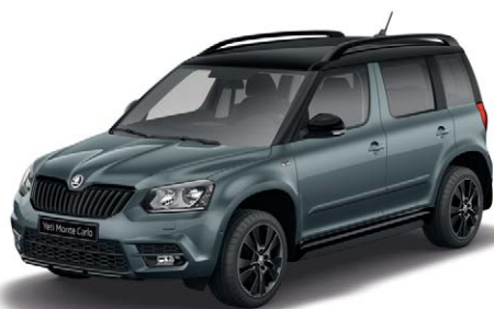
Gris Météore (F6F6)