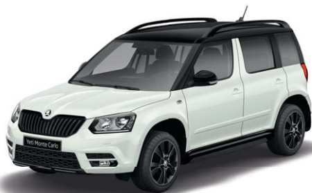
Blanc Laser (J3J3)