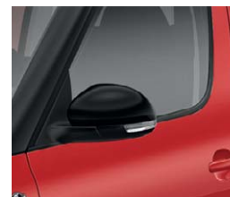
Rétroviseurs extérieurs couleur Noir