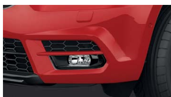
Phares avant antibrouillard