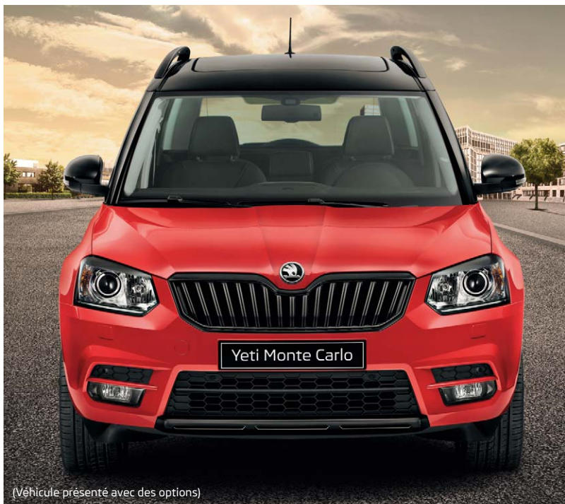
(Véhicule présenté avec des options)