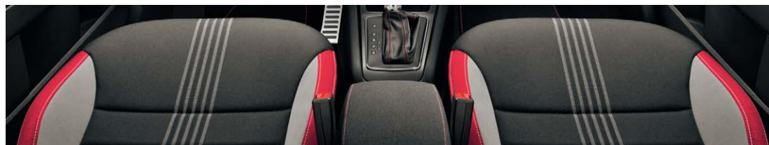
Tissu Monte-Carlo DR