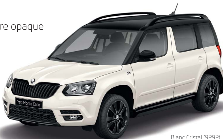
Blanc Cristal (9P9P)