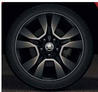
Jantes alliage 17" "Origami Noir"