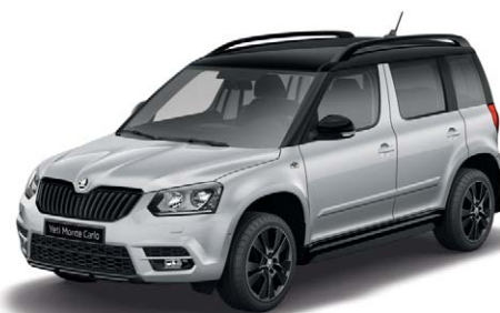
Gris Argent (8E8E)