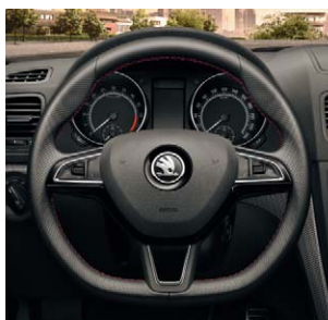
Volant multifonctions Sport 3 branches à méplat