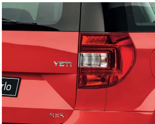
Feux arrière à LED