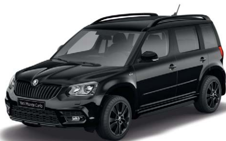
Noir Magic Nacré (I2I2)