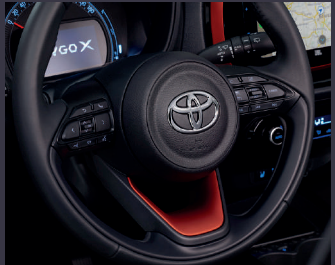
Commandes du véhicule à portée de main