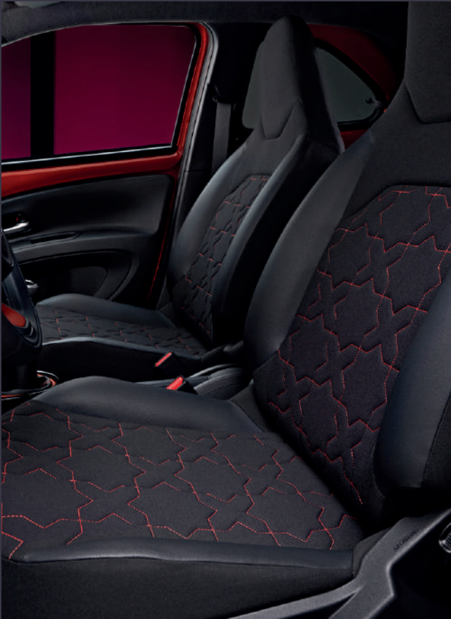
Élégante sellerie mi-cuir avec reprise subtile du symbole X (1)