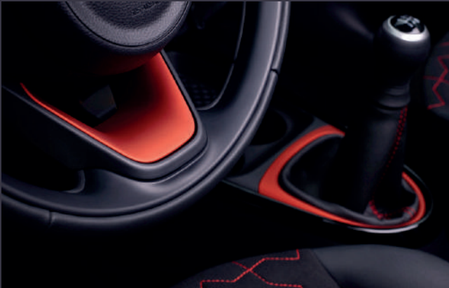
Touches de couleur carrosserie (1) pour un intérieur harmonieux