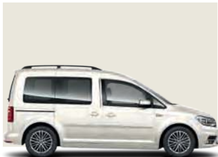
Blanc Candy | peinture unie | CC | TL | CL |