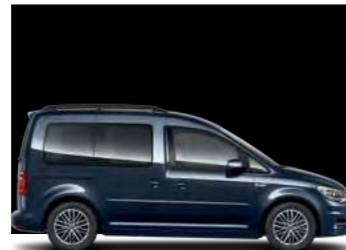
Bleu Starlight | peinture métallisée | CC | TL | CL |