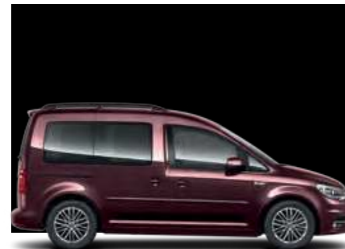
Blackberry | peinture métallisée | CC | TL | CL |