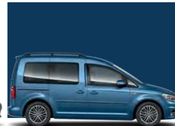
Bleu Acapulco | peinture métallisée | CC | TL | CL |