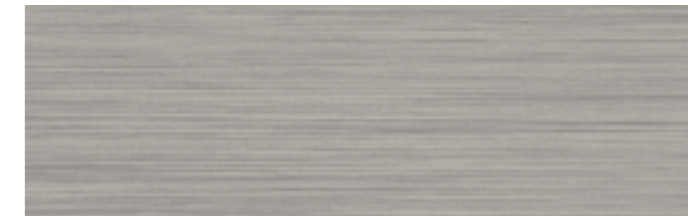
Aluminium brossé | TL | CL |