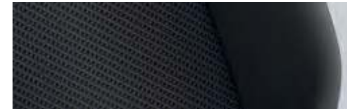
Pilon* | Noir Titane | TL |