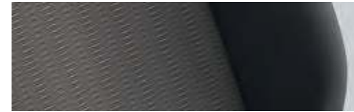
Pandu | Gris Moonrock / Noir Titane | CL |