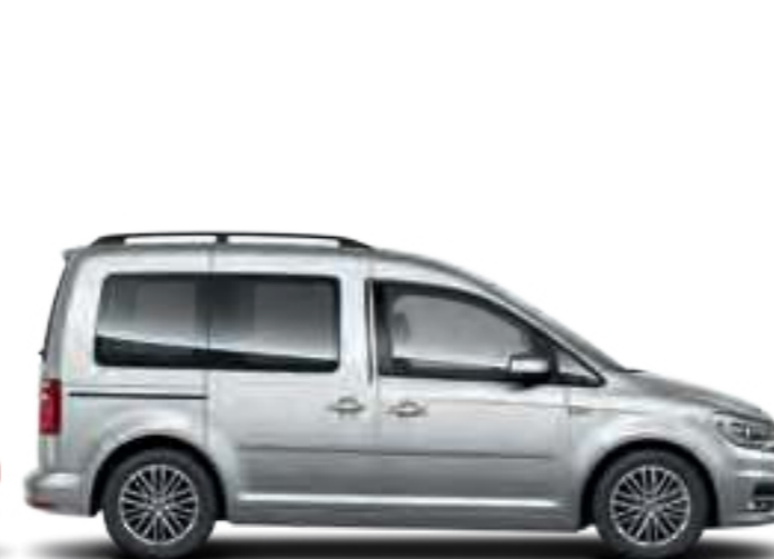
Reflet d'Argent | peinture métallisée | CC | TL | CL |