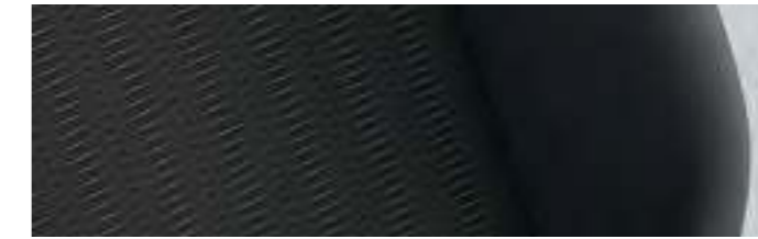
Pandu | Noir Titane | CL |