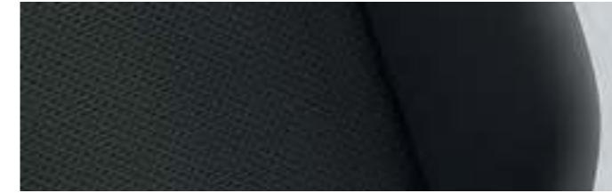
Simora | Noir Titane | CC |