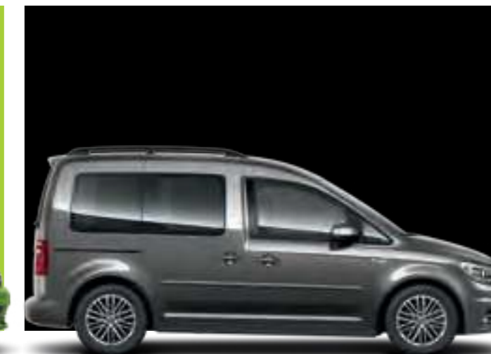
Gris Indium | peinture métallisée | CC | TL | CL |