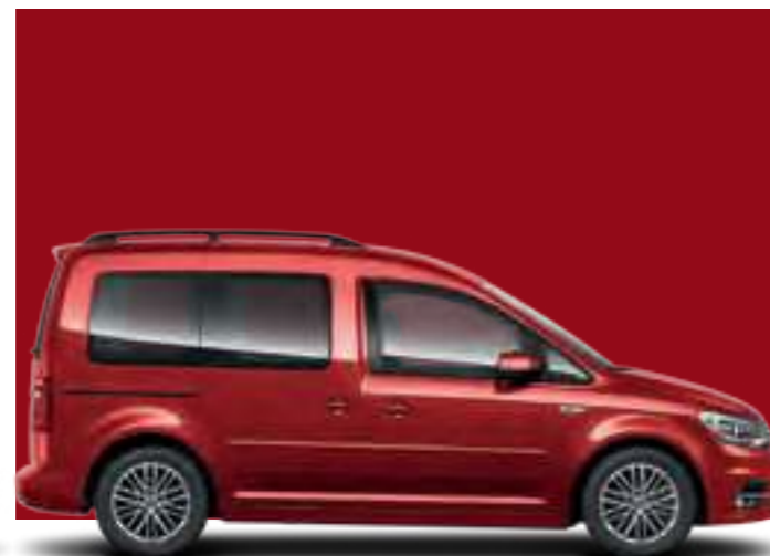
Rouge Cerise | peinture unie | CC | TL | CL |