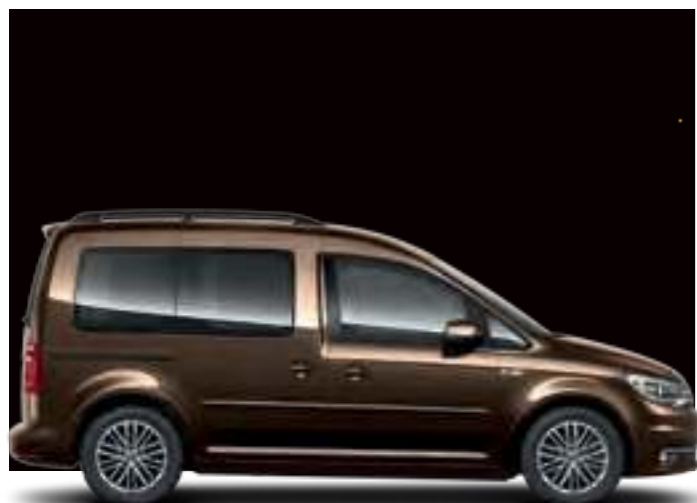
Brun Noisette | peinture métallisée | CC | TL | CL |