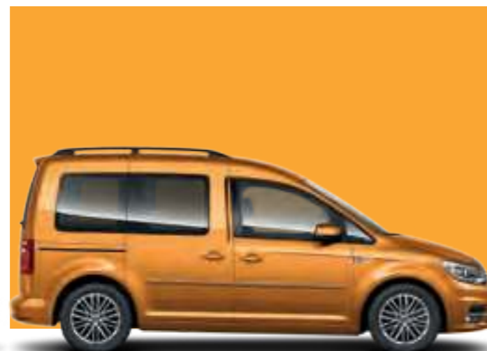
Orange Miel | peinture métallisée | CC | TL | CL |