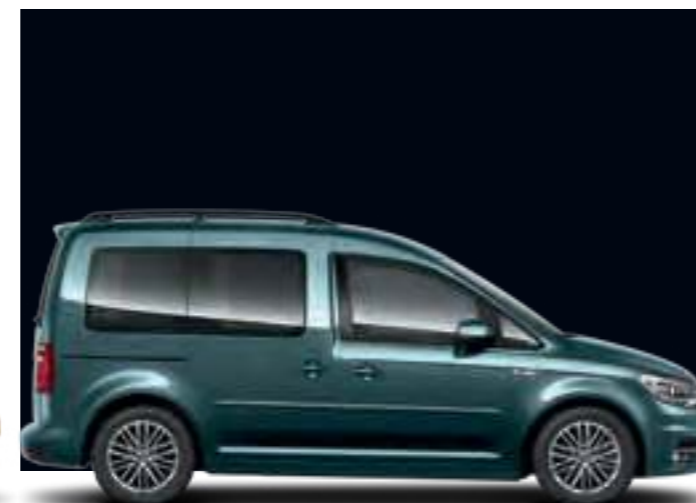
Vert Bamboueraie | peinture métallisée | CC | TL | CL |