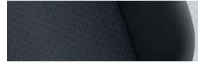
Kutamo* | Noir Titane / Bleu | TL |