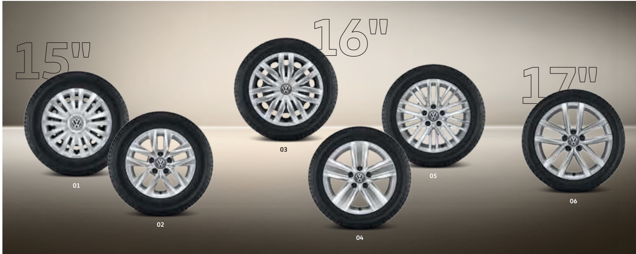
01 Jante acier avec enjoliveur 6 J x 15. Avec pneus 195/65 R 15. | CC | TL |