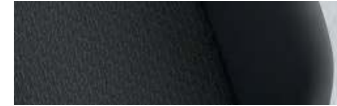
Kutamo | Noir Titane / Gris Moonrock | TL |