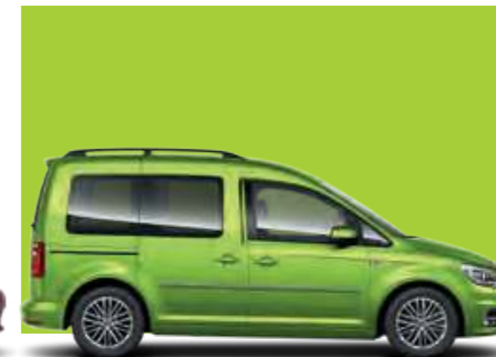
Vert Vipère | peinture métallisée | CC | TL | CL |