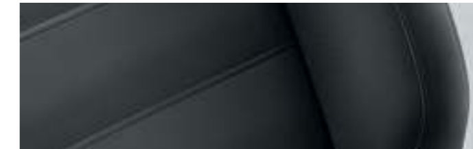
Vienna | Noir Titane | cuir | CL |