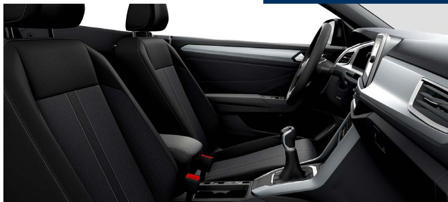
1 Sellerie en tissu "Tracks 2" noire