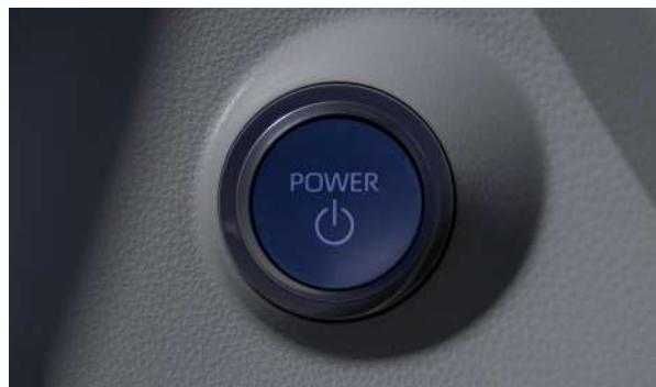
Botón de encendido disponible en versión Híbrida.