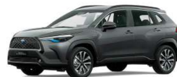
1G3 GRIS METÁLICO