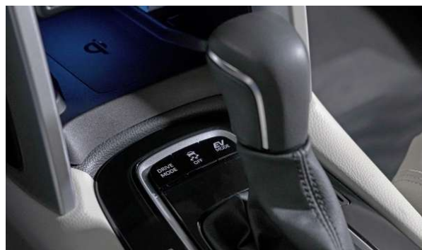
Conducción cómoda, con confianza y perfección en su operatividad.