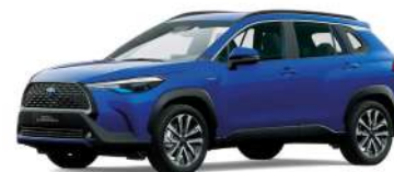
8X2 AZUL METÁLICO