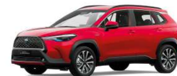
3R3 ROJO MICA