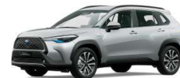
1H6 PLATA METÁLICO