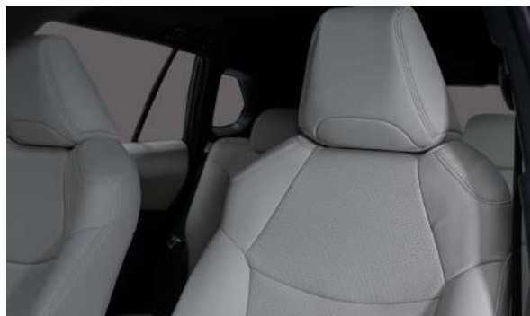
Asientos tapizados en cuero (disponible en color claro y oscuro) y también en tela.