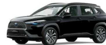
215 NEGRO MICA