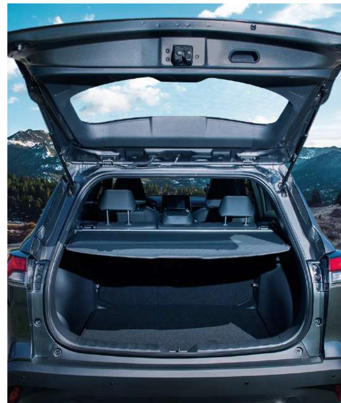
La SUV con todo el espacio que necesitas.