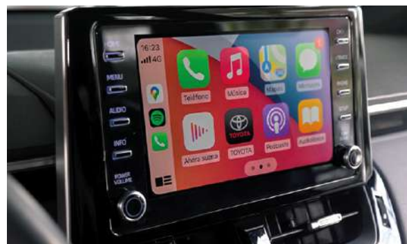
Pantalla táctil de 8" con Apple CarPlay y Android Auto.