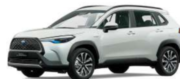
089 BLANCO PERLA