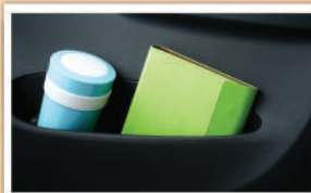
Door Trim Pocket (Tipe M & X)