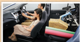
Kursi baris kedua dapat dilipat untuk menampung barang yang berukuran panjang