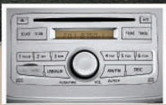
2DIN Integrated Audio System Include 4 Speakers (Tipe X) Pemutar musik dari berbagai media (Radio, CD, MP3, WMA, USB, AUX) untuk menambah keceriaan berkendara.