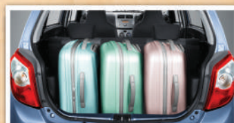
Bagasi dengan kapasitas maksimal sehingga bisa memuat barang berukuran besar