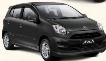
Type M Sporty