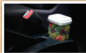
Center Console (Tipe M & X)