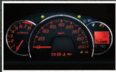
Meter Combination (Tipe M & X) Dengan desain chrome ring yang keren dan sporty namun tetap mudah dibaca.