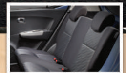
Full Fabric Seat Material with 2 nd Row Head Rest (Tipe M & X) Material berkualitas dilengkapi sandaran kepala di semua baris memberikan kenyamanan dan keamanan bagi semua penumpang.