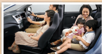
Nyaman untuk 5 penumpang dan barang bawaan