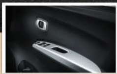
Stylish Molded Door Trim (Tipe X) Paduan warna hitam dan ornamen silver pada doortrim, tampil keren dan sporty.