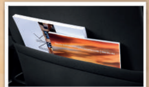
Seat Back Pocket (Tipe M & X)