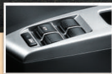
Electric Power Window (Tipe D+, M & X) Lebih mudah membuka / menutup kaca jendela secara elektrik.