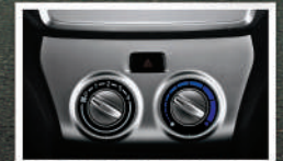
Air Conditioner (Tipe D+, M-, & X) Kesejukan kabin lebih merata sehingga penumpang lebih nyaman.