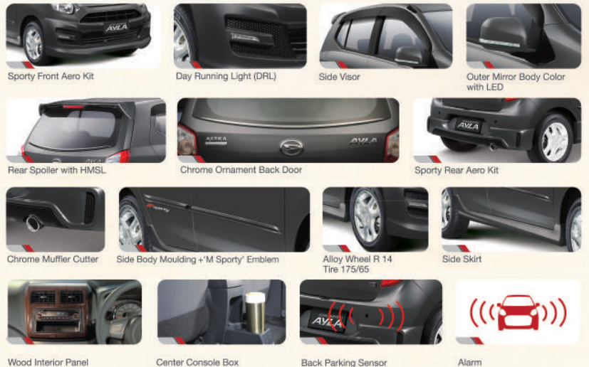
Sporty Front Aero Kit