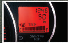
MID (Multi Information Display) (Tipe M & X) Jam & Alarm (peringat waktu) Average / Range / Trip / Odo Meter Fuel Bar (status konsumsi bahan bakar)