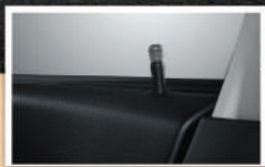
Central Door Lock (Tipe M & X) Penguncian pintu dapat diatur dari kursi pengemudi, lebih praktis dan aman.