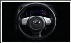
Stylish Steering Wheel (Tipe X) Setir palang tiga terbaru dengan ornamen silver, keren dan sporty.

Kabin yang lega, desain interior yang modern, dan kapasitas bagasi yang luas, memberikan keleluasaan serta kenyamanan saat melakukan perjalanan.