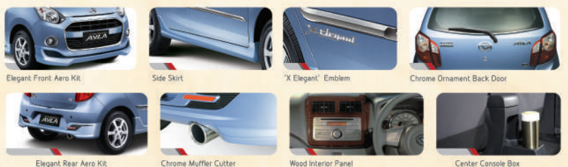
Elegant Front Aero Kit