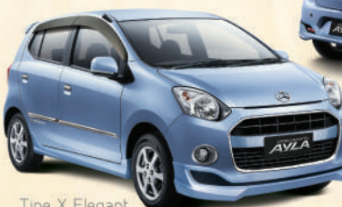
Type X Elegant