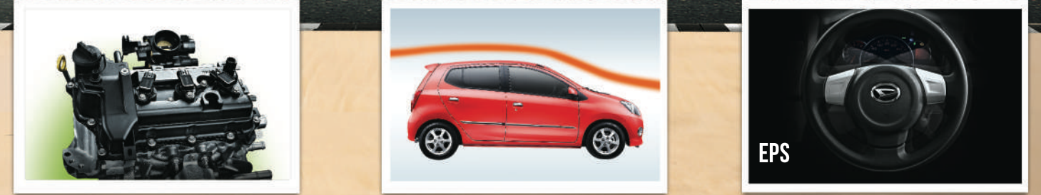
1KR-DE Engine Mesin Eco Technology terbaru dari Daihatsu. Sangat irit, bertenaga, dan ramah lingkungan. Max. Power 65 PS/6.000 Rpm Max. Torque 8.7 Kg.m/3.600 Rpm Aerodynamic Body Design Desain body aerodinamis membuat mobil lebih stabil dan irit bahan bakar. Electric Power Steering (Type D+,M,X) Stir lebih ringan dan sekaligus irit bahan bakar.

Selain penampilan yang keren dan kabin yang lega, Astra Daihatsu Ayla memiliki konsumsi bahan bakar yang sangat irit, performa yang responsif, lincah bermanuver di berbagai kondisi jalan dan dilengkapi fitur keselamatan yang memadai.