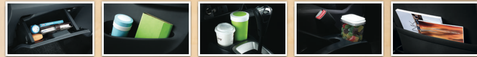
Glove Box Door Trim Pocket (Tipe M & X) Bottle Holder Center Console (Tipe M & X) Seat Back Pocket (Tipe M & X)

Tersedia banyak tempat penyimpanan sehingga kabin terlihat rapi.