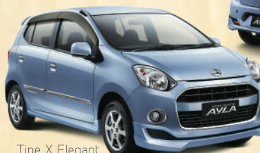
Tipe X Elegant