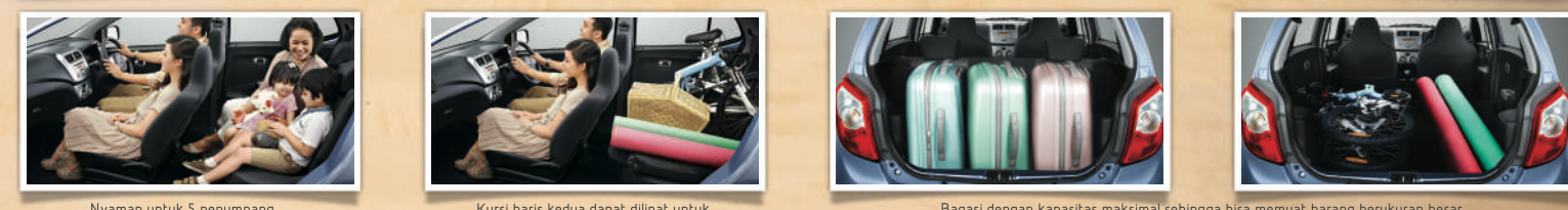
Nyaman untuk 5 penumpang dan barang bawaan Kursi baris kedua dapat dilipat untuk menampung barang yang berukuran panjang Bagasi dengan kapasitas maksimal sehingga bisa memuat barang berukuran besar Collapsible Steering Column