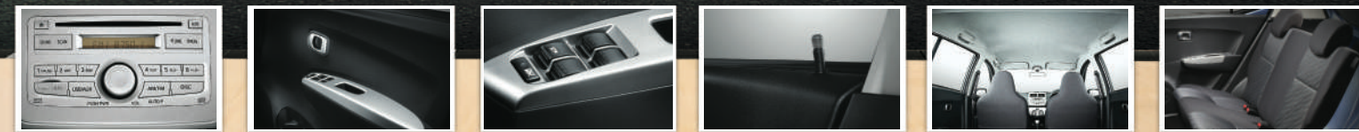
2DIN Integrated Audio System Include 4 Speakers (Tipe X) Pemutar musik dan berbagai media (Radio, CD, MP3, WMA, USB, AUX) untuk menambah keseruan berkendara. Stylish Molded Door Trim (Tipe X) Paduan warna hitam dan ornamen silver pada doortrim. Tampil keren dan sporty. Electric Power Window (Tipe D+, M & X) Lebih mudah membuka / menutup kaca jendela secara elektrik. Central Door Lock (Tipe M & X) Penguncian pintu dapat diatur dari kursi pengemudi, lebih praktis dan aman. Molded Head Lining Kabin terlihat rapi dan mewah. Full Fabric Seat Material with 2 nd Row Head Rest (Tipe M & X) Material berkualitas dilengkapi sandaran kepala di semua baris memberikan kenyamanan dan keamanan bagi semua penumpang.