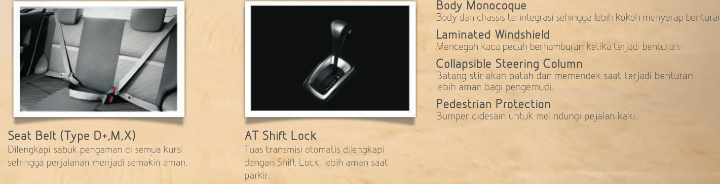
Seat Belt (Type D+,M,X) Dilengkapi sabuk pengaman di semua kursi sehingga perjalanan menjadi semakin aman. AT Shift Lock Tuas transmisi otomatis dilengkapi dengan Shift Lock, lebih aman saat parkir. Body Monocoque Body dan chassis terintegrasi sehingga lebih kokoh menyerap benturan. Laminated Windshield Mencegah kaca pecah berhamburan ketika terjadi benturan. Collapsible Steering Column Batang stir akan patah dan memendek saat terjadi benturan lebih aman bagi pengemudi. Pedestrian Protection Bumper didesain untuk melindungi pejalan kaki.