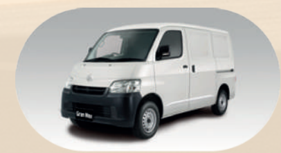
Tipe Blind Van