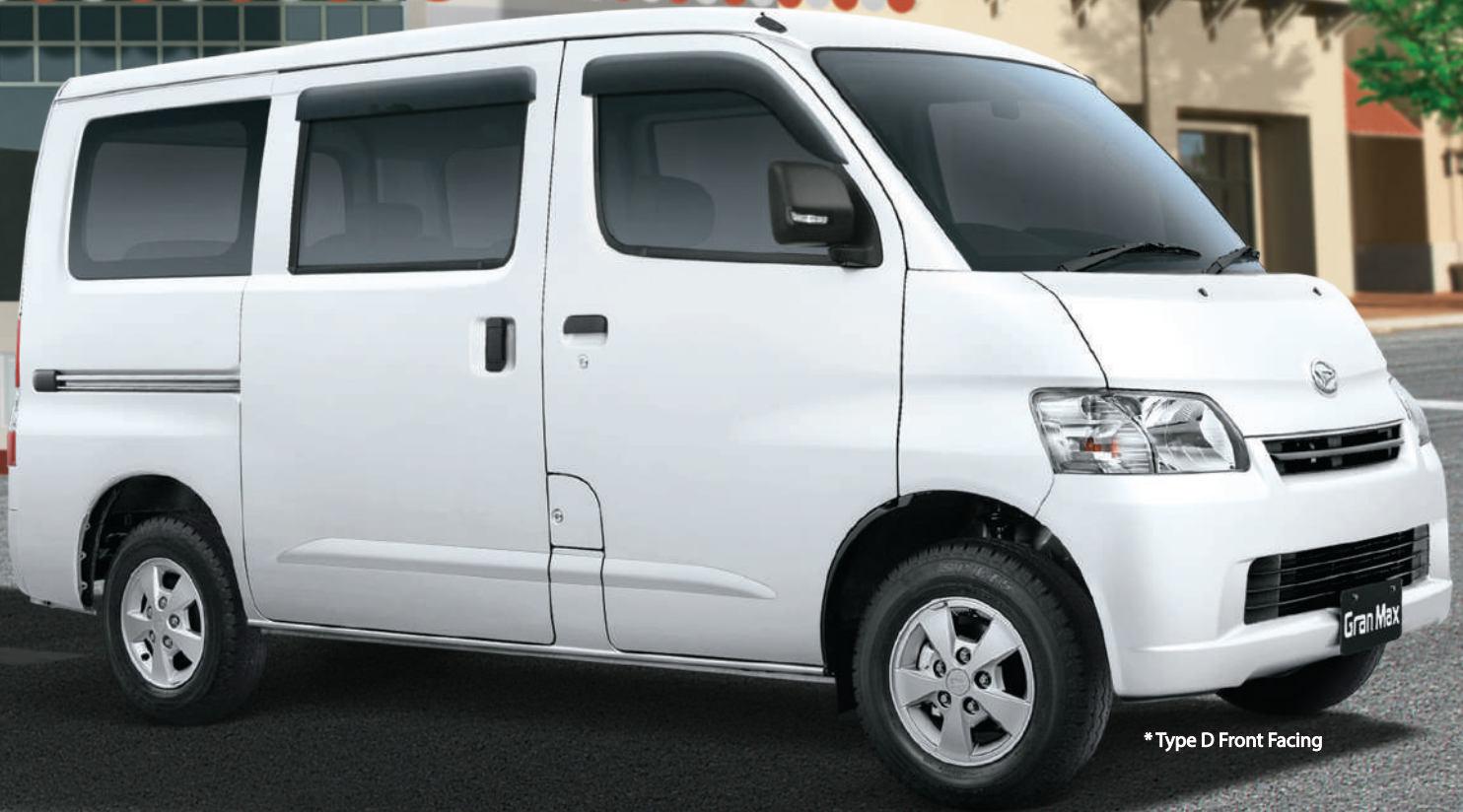
*Type D Front Facing