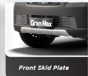
Front Skid Plate