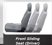
Front Sliding Seat (Driver)