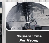
Suspensi Tipe Per Keong