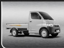
Classic Silver Metallic