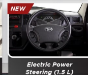
NEW Electric Power Steering (1.5 L)