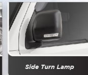
Side Turn Lamp