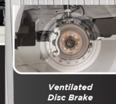
Ventilated Disc Brake