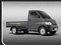
Rock Grey Metallic