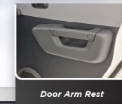
Door Arm Rest