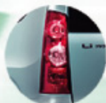
New Rear Lamp Makin elegan

Dari depan sampai belakang, banyak yang baru pada Daihatsu Xenia VVT-i. Makin keren. Makin membanggakan. Kini semua makin suka.