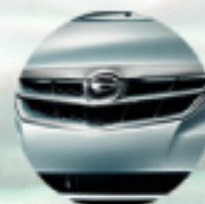
New Front Grille & Front Bumper Makin sporty.