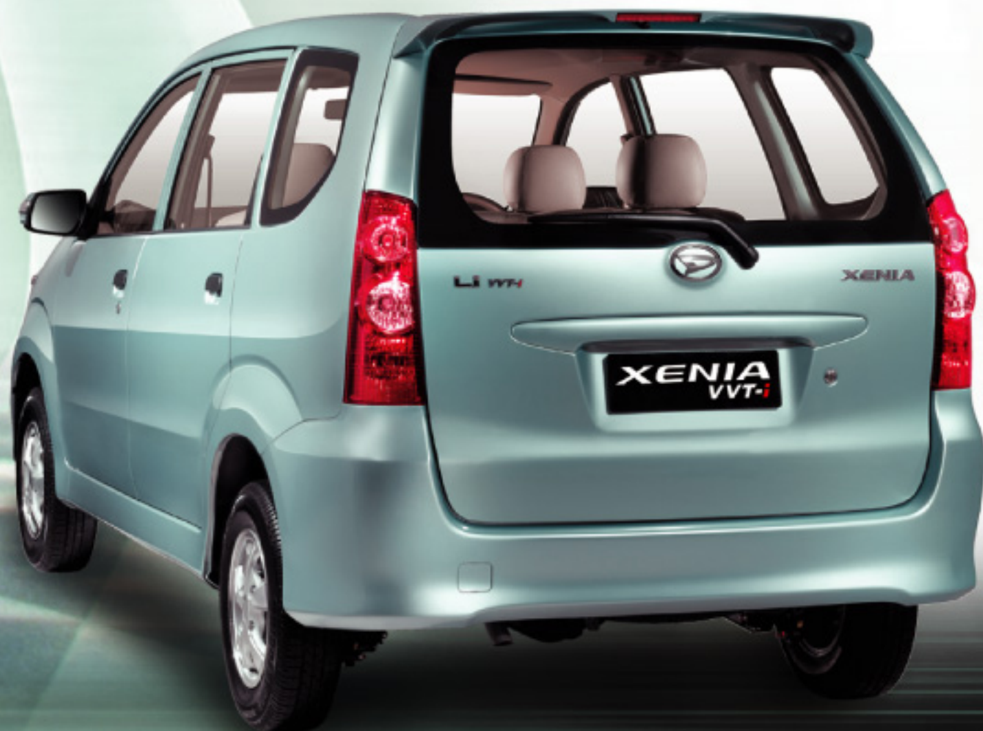
Tipe Li *

* Alloy Wheel, Electric Mirror, Rear Spoiler, Fog Lamp dan Fog Lamp Cover adalah optional.