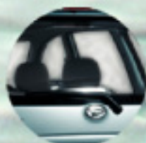
Rear Wiper Jarak pandang tetap tajam dan luasa di segala kondisi.