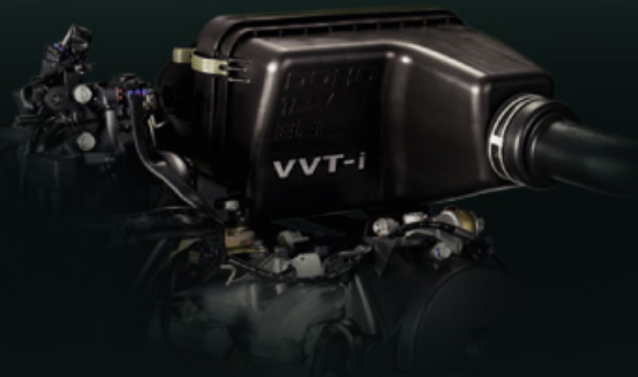
Mesin EJ-VE DOHC VVT-i 1000 cc, 12 Valve

Mesin baru dengan VVT-i, memberikan power yang semakin besar, tarikan responsif, dan konsumsi bahan bakar yang tetap irit. Kecanggihan mesin dengan kinerja optimal menjadikannya lebih ramah lingkungan.