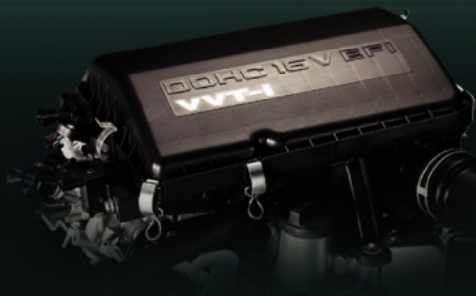
Mesin K3-VE DOHC VVT-i 1300 cc, 16 Valve