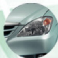
New Head Lamp Makin gaya.