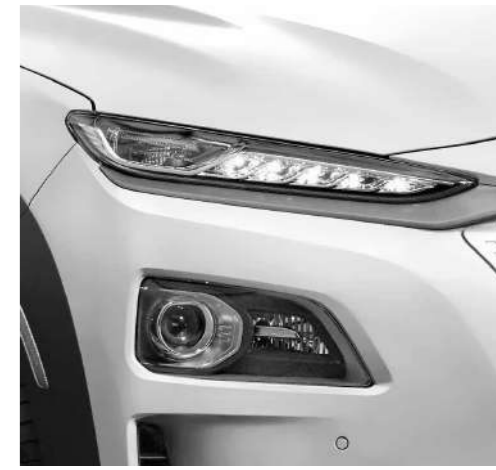
LED Headlight with Auto Light Control + DRL Perpaduan Lampu LED Projector dan LED Daytime Running Light menghasilkan pencahayaan yang jelas dengan tampilan modis, membantu penerangan dan visibilitas pada saat berkendara.