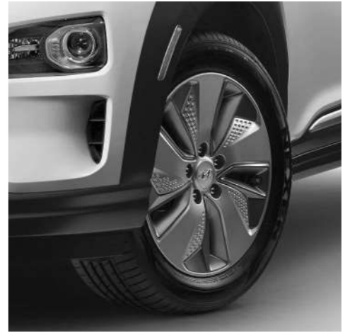
17" Alloy Wheel Dengan desain modern khas mobil electric dan struktur yang kokoh untuk kenyamanan berkendara, cocok untuk rutinitas sehari-hari maupun perjalanan panjang.