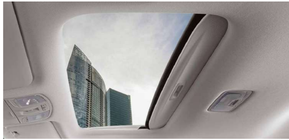
Electric Sunroof Untuk menikmati indahny langit, bukalah sunroof yang digerakan secara electric dengan sensor anti-pinch sehingga tidak perlu khawatir jari terjepit ketika sunroof tertutup.

KONA Electric diciptakan sebagai hasil dari visi Hyundai atas mobilitas masa depan. Didesain dalam bentuk compact SUV yang mengedepankan sisi mobilitas, efisiensi, dan tampilan yang modern. Tampil sebagai mobil listrik murni dan tanpa emisi untuk membantu menciptakan lingkungan masa depan yang lebih baik.