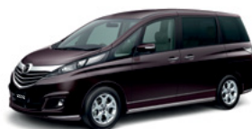
Radiant Ebony Mica