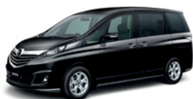
Jet Black Mica

*** ERA, Emergency Road Assistant, keadaan darurat dalam kota, saat ini baru tersedia di Jakarta, Bogor, Depok, Tangerang dan Bekasi. Hubungi: 0812 11 62932 (bebas biaya selama masa garansi, 24 jam/7 hari)