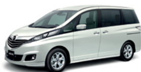
Crystal White Pearl Mica