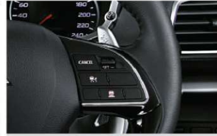
Adaptive Cruise Control