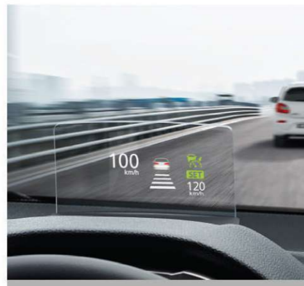
Heads Up Display