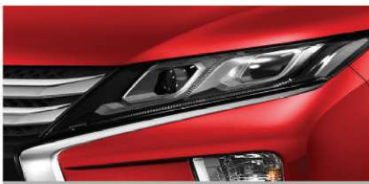
Projector LED Headlamp

Desain futuristik dan garis tegas yang mewah membuat tampilan Eclipse Cross menjadi pusat perhatian, di mana pun Anda melintas.