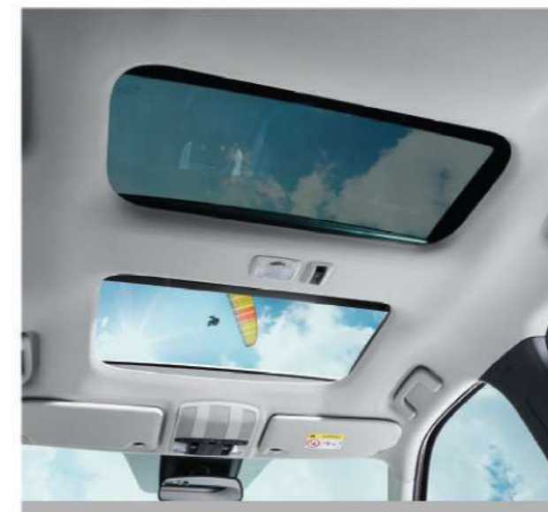
Power Panoramic Sunroof