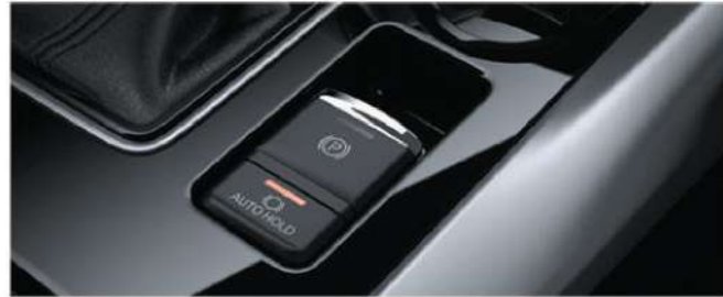
Electric Parking Brake with Brake Auto Hold